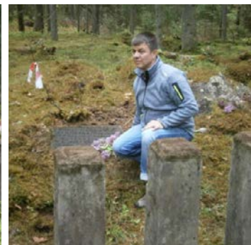
Stefans pie vecvectēva kapa