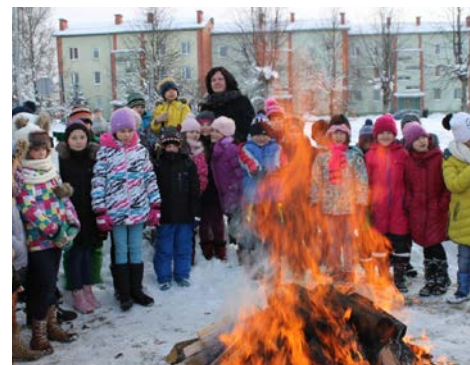
Barikāžu ugunskurs, kas tika iekurts pie skolas 20. janvārī no skolēnu sanestām malkas pagalēm.

par vēsturi, kopā kurināsim barikāžu uguns-kurus un vienkārši uzticēsimies.