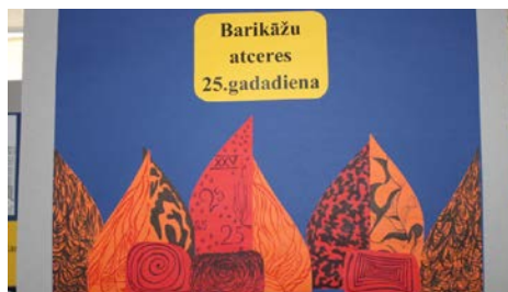
Izstāde „Barikāžu atceres 25. gadadiena” Ķeguma komercnovirziena vidusskolā

To, kas kādreiz izcīnīts, palīdzēs saglabāt mūsu bērni un bērnubērni, kuriem stāstīsim