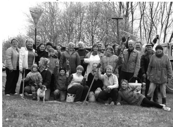
Birzgalieši pēc labi padarīta darba – Lielajā Talkā

Šī gada 25. aprīlī visā Latvijā norisinājās pasākums, kas ne tikai veicina mūsu skaistās zemes sakoptību, bet pierāda arī to, cik saliedēti un gaiši mēs katrs spējam būt!