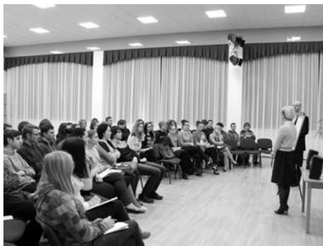
Semināra saturā ar interesi iedzījinās skolēni no 8.-12. klasei, kā arī ciemiņi no Bīrzgales pamatskolas

27. un 28. janvārī Ķeguma komercnovirziena vidusskolā norisinājās ASV vēstniecības un organizācijas Young Media Sharks rīkotais jauniešu karjeras attīstības programmas seminārs „Start Strong!”. 58 jauniešiem no Ķeguma un Bīrzgales bija iespēja uzzināt, kā kļūt konkurētspējīgiem darba tirgū, parādīt sevi no labākās puses un kā runāt ar darba devēju. Semināra vadītāji jauniešiem stāstīja un deva praktiskus padomus, kā rakstīt CV un motivācijas vēstuli, lai tā piesaistītu darba devēja uzmanību un tiktu pamanīta pārējo vidū.