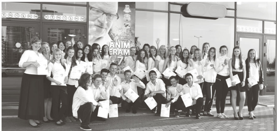
Keguma jauniešu koris pie Arēnas Rīga