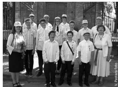
Birzgalieši pie Žeimes luterāņu baznīcas