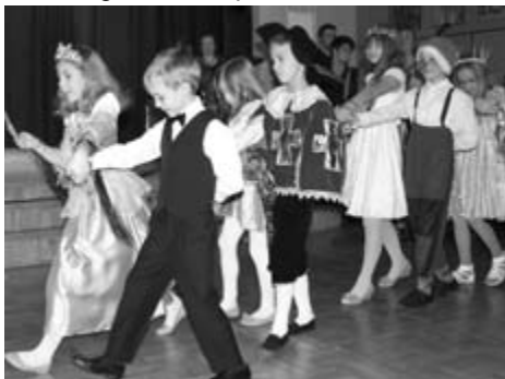
Polonēze pils ballē mazo izpildītāju priekšnesumā bija neaizmirstama