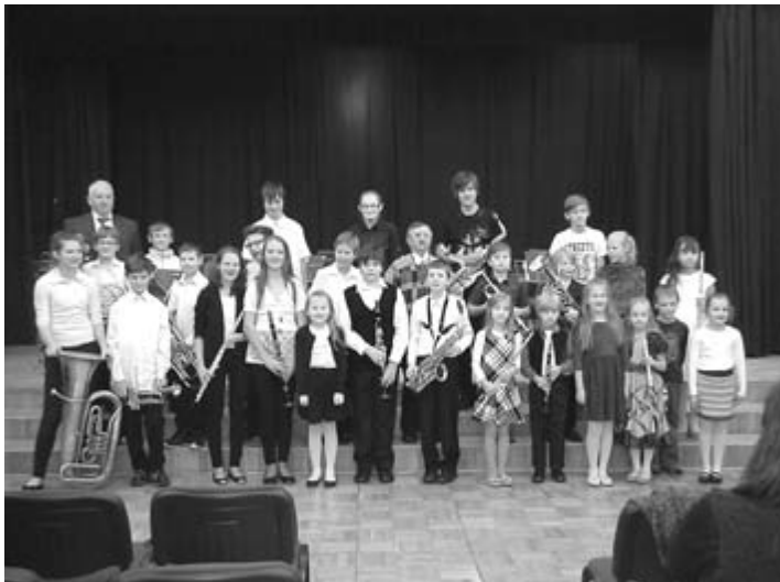
Koncerta dalībnieki pēc mūzikas skolas koncerta Ķeguma komercnovirziena vidusskolā 2013. gada 12. decembrī

Birzgales Mūzikas skolas pedagogi jau 5. mācību gadu dodas arī uz Ķeguma komercnovirziena vidusskolu. Tur pēcpusdienās audzēkņiem ir iespēja apgūt visdažādāko pūšamo un sitamo instrumentu spēles iemaņas, pirmās klavierspēles iemaņas vispārējo klavieru klasē un mūzikas teoriju. Tiem, kuriem pirmo iemaņu daudzums ir pietiekams, tiek atļauts spēlēt pūtēju orķestrī. Te nu arī visātrāk atklājas katra varēšana vai vēl nevarēšana, jo kopējam priekšnesumam jābūt skaidri saprotamam, ausij tīkamam. To var panākt tikai ar ļoti rūpīgu darbu katram individuāli un tikai tad visiem kopā.