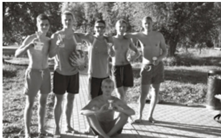
Ķreklos komanda Ķeguma HES, blakus komanda Pusstopiņi, sēdus un no labās komanda Vilki