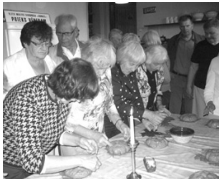
Pašas veidojam kukulīti, pašas ēdīsim

Blomē lauku mājās „Donas” baudījām gardu zupu un „Maizes darbnīcā” iepazīnāties ar sentēvu tradīcijām maizes cepšanā. Kā suvenīrus līdzī paņēmām pašu veidotos slavenos Blomes maizes kukulīšus. Pavisam karstus!