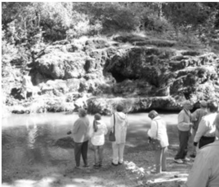
Pie Raunas Staburaga

Kad rīta agrumā uz Ķeguma tautas nama pusi dodas smaidīgi senioru paaudzes ķegumieši, ir skaidrs – būs ekskursija. Tā bija arī 14. augustā, kad mūsu ceļi veda uz Raunu, Blomi un Smilteni. Taču pirmo pārsteigumu par to, cik daudz skaistuma var redzēt pavisam netālu, sagādāja Ieriķu dzirnavu dabas taka Melderupītes krastos. Tur redzējām trešo augstāko ūdenskritumu Latvijā, 400 gadus vecus dzirnavu mūrus, vienu no lielākajiem ūdensratiem Baltijā, interesantus floristikas veidojumus un citus ievērbas cīnīgus objektus. Un tas viss – vienu kilometru garā pastaigā! Ja gadās būt Ieriķos – nepabrauciet garām!