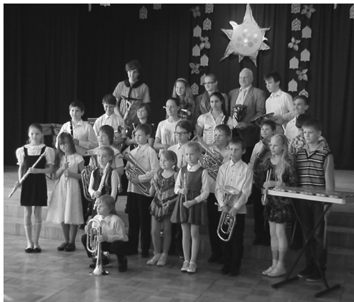
Pēc Mūzikas skolas koncerta Ķeguma komercnovirziena vidusskolā

11. maijā koncertu – godināšanu Birzgales tautas namā „Mēs esam viens otram” jau tradicionāli iesāka pūtēju orķestra priekšnesumi un tad raibā virtenē to turpināja visi pārējie pašdarbības kolektīvi un viesi.