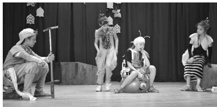
Izrāde „Gliemezītis – rītenbraucējs”

Sirsniņš paldies pasākuma atbalstītājiem – Ķeguma novada domei; Ķeguma komercnovirziena vidusskolai; SIA „VIA Mežs”,