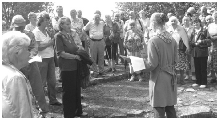
Grupa Skrīveru dendroloģiskajā parkā

Skrīveri mūsu atmiņā saistās ar Andreja Upīša vārdu. Īsā pastaigā apskatījām nelielo dārzu un vasaras mājiņu, kurā cienjama rakstnieks mīlēja uzturēties vasaras mēnešos.