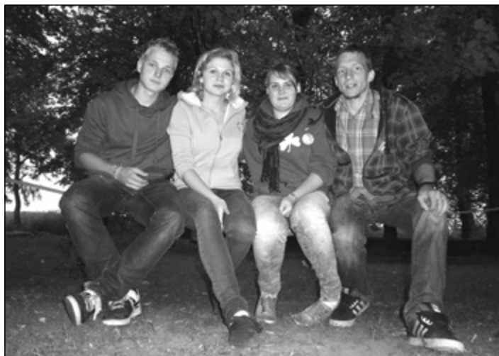
Komanda „Heisā – Hopsā”

Sacensību koordinators un galvenais tiesnesis