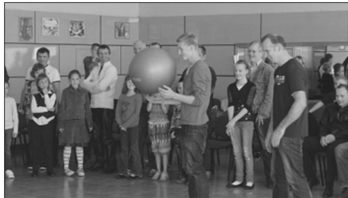
20 tēti un vectētiņi un kopā ar saviem bērniem piedzīvoja jautru darbošanos kopā. Bija gan mīļi vārdi, gan dziesmas, gan stafetes un erudīcijas konkurss, bet, naglojot savu koka mašīnu vai lidmašīnu, tēti atkal pārtapa agrākajos skolas puikās.

Jaunas iespējas mums pavērusi arī sporta zāles atjaunošana, radot sakoptāku vidi.