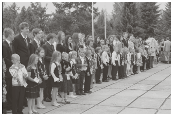
Pats saviļņojošākais brīdis skolā ir tad, kad roku rokā skolas priekšā iznāk mūsu vismazākie un vislielākie - 1. un 12. klases skolēni.