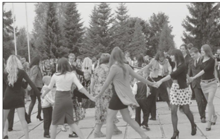
Vēsajā un rudenīgajā rītā pirmie un divpadsmitie visus iesildīja ar rotaļu "Ādamam bija septiņi dēli, visi dara tā". Līdzī lēca gan viesi, gan skolotāji, gan skolēni.