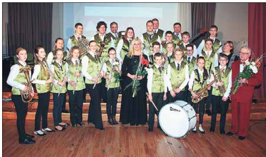
Ikšķiles Mūzikas un mākslas skolas pūtēju orķestris.