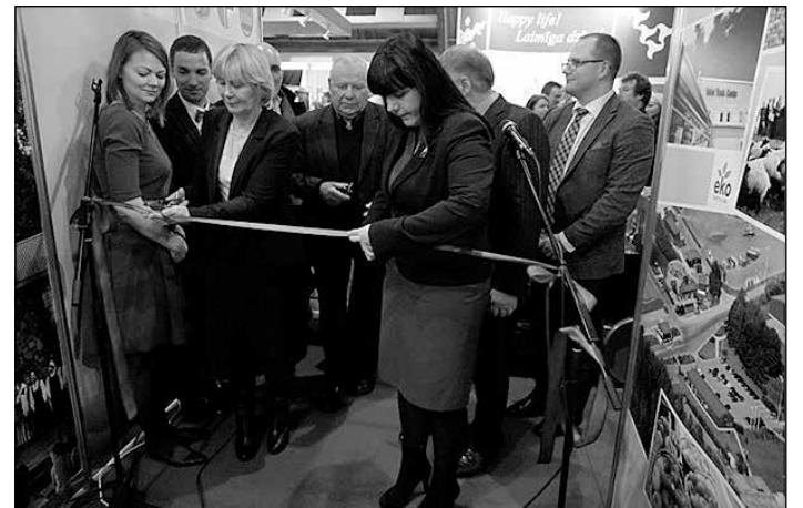
Daugavas lejteces stenda atklāšana starptautiskajā tūrisma izstādē „Balttour”.

Ikšķiles novadā 2015. gadā notika daudz dažādu pasākumu dažādām mērķauditorijām, kas arī veicināja tūristu pieplūdumu novadam. Lielākie no tiem bija pilsētas 830 gadu svinības, Operetes festivāls, SEB kalnu divriteņu maratona posms, SPORTLAT MTB posms,