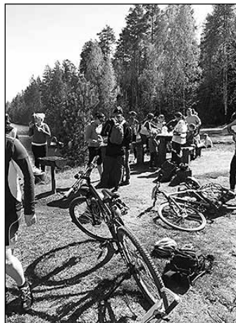
Tūrisma sezonas atklāšanas velobrauciens.

arī aiztikt, kas citos muzejos lielākoties nav ļauts. Šīs žurnālistu vizītes rezultātā tapa vairāki raksti interneta portālos ( www.e-padomi.lv , www.aprinkis.lv ), fotostāsts un arī videomateriāls par atpūtas iespējām ģimenēm ar bērniem Daugavas lejteces reģionā.