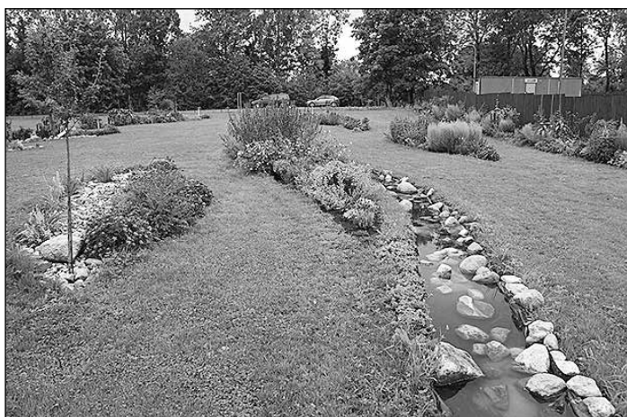
Biedrības „IKS parks” veidotais atpūtas un izglītības parks.