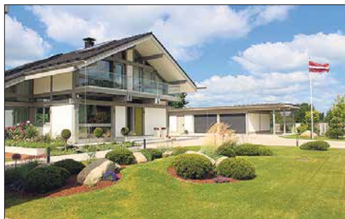
Konkursa „Sakoptākā sēta 2015” uzvarētājs Mižu ģimenes veidotais daiļdārzs Dalbiņu ielā 2 .

IKŠKĪLES NOVADA PAŠVALDĪBAS SABIEDRISKO ATTIECĪBU SPECIĀLISTE