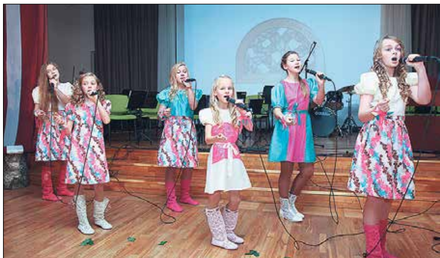
Dzied bērnu vokālais ansamblis „Puķuzirnis”.