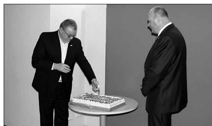
Ikšķiles novada domes priekšsēdētājs iedez sveci Veselības un sociālo lietu pārvaldes tortē.