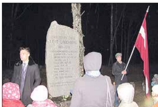
Piemīnas brīdis Lejastinūžu karavīru kapos.