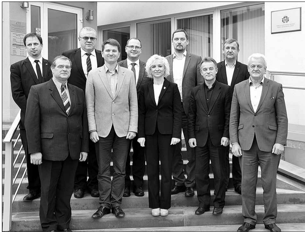
Jaunās apvienības dibināšanā piedalījās 11 Pierīgas pašvaldības.

Visas pašvaldības, kas pēc brīvprātības principa apvienojušās Pierīgas pašvaldību apvienībā, ir Latvijas Pašvaldību savienības biedri. Līdz ar Pierīgas pašvaldību apvienības dibināšanu tika apstiprināti arī tās statūti. Tie nosaka, ka jaunā biedrība uz brīvprātības principiem apvieno Latvijas Republikas pašvaldības, kuru administratīvā teritorija atrodas Rīgas plānošanas reģionā, un tās mērķis ir īstenot Pierīgas pašvaldību tiesisko interešu aizsardzību, veicināt to ekonomisko un sociālo attīstību, kā arī sadarbību savstarpēji un ar citām Latvijas un ārvalstu institūcijām. Statūtos arī noteikts, ka