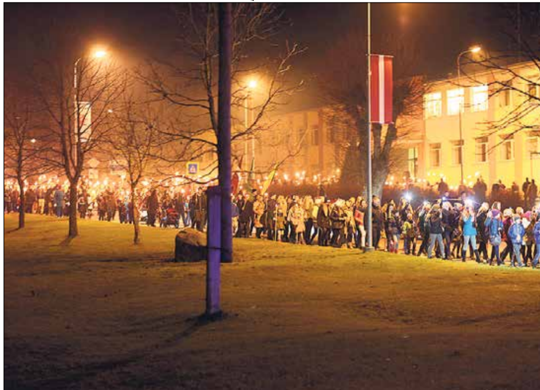
Lāpu un sveču gaismiņas šajā vakarā izgaismoja visu novadu.