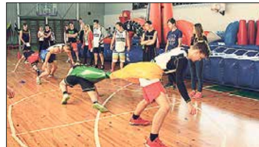
Spēkavīru sacensības „Lāčausis 2015”.