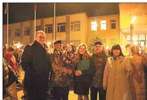
Lāpu gājiens Ikšķilē.

1918.–1919. gadu, atgriešanos no virsnieku kara gūstekņu nometnes Augšsilēzijā, Latvijas valsts un Latvijas armijas izveidošanu, kuras kodols bija Latvijas strēlnieki, sīvās brīvības cīņas. Tas bija stāstījums par uzvaru, kam paši līdzsirds dziļumiem ticēja, par drosmīgiem vīriem, ticību un pašlīdību. Monoizrādē piedalījās aktieris Pēteris Nebars.