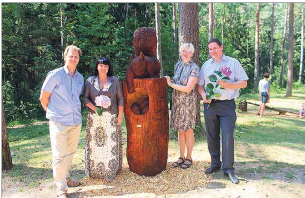
2015. gadā Zilo kalnu bērnu rotaļu laukuma teritorijā atklātas Latvijas mežu iemītnieku skulptūras.