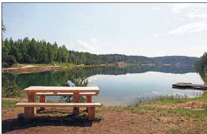
Dabas parkā ir izvietoti soli un atkritumu urnas.

Teritorijas labiekārtojums Viens no labiekārtošanas pamatlīkumiem nosaka – jo labāks kādas