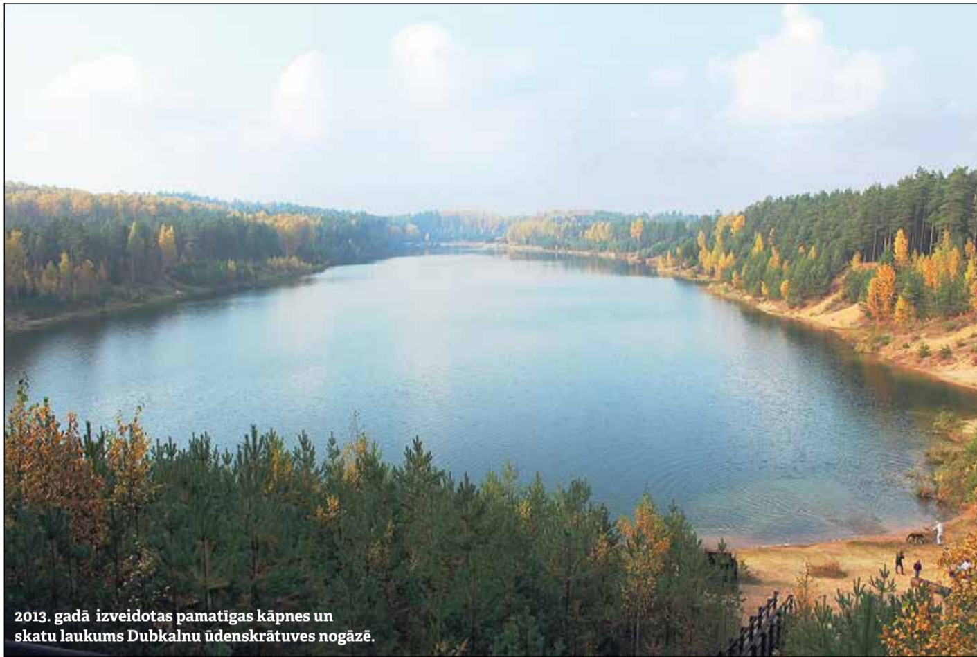
2013. gadā izveidotas pamatīgas kāpnes un skatu laukums Dubkalnu ūdenskrātuves nogāzē.

teritorijas labiekārtojuma līmenis, jo mazāka ir antropogēnā slodze uz piegulošajām teritorijām.