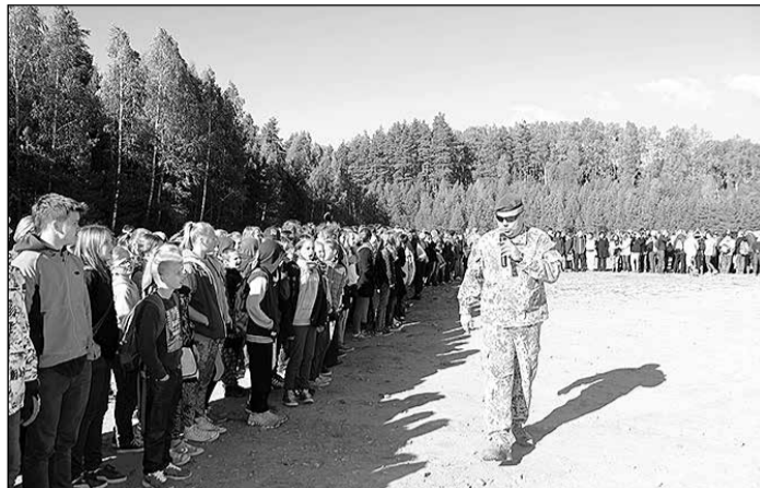
Skolēnu pārgājiens, atceroties latviešu strēlnieku bataljonu dibināšanas 100. gadadienu.

Ogres un Ikšķiles novada pašvaldību aģentūra „Tūrisma, sporta un atpūtas kompleksa „Zilie kalni” attīstības aģentūra” sirsnīgi pateicas meža laboratoriju organizatoriem, kuri brīvprātīgi un pašaieliedzīgi visas dienas garumā stāstīja un rādīja savu ikdienas darbu, lai ieinteresētu tajā jauniešus. Īpaši jāpateicas SIA „Rīgas meži” un tās darbinieku atsaucībai, veicot sagatavošanās