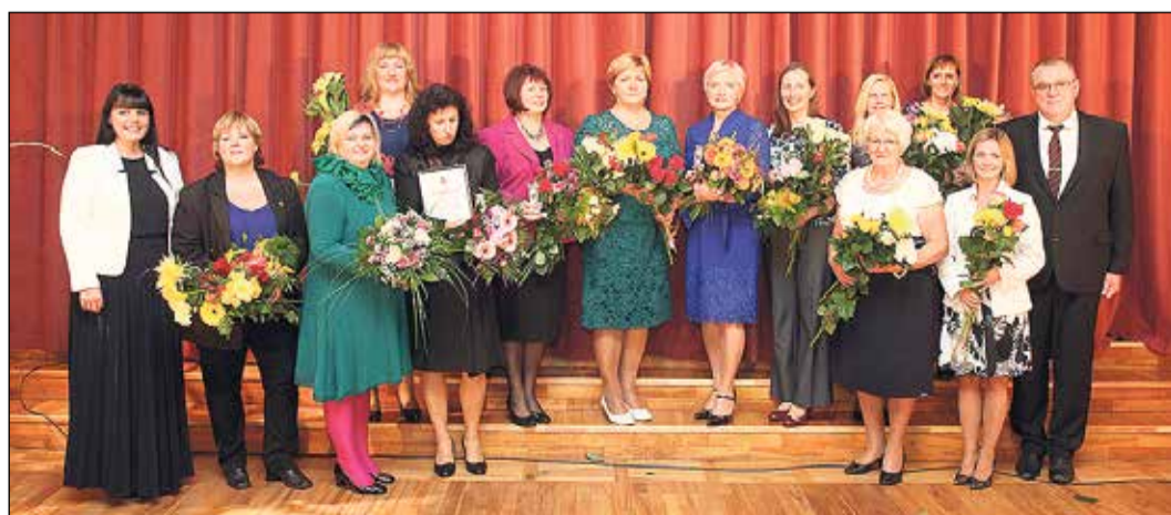
Svinīgajā pasākumā vienkopus pulcējās izglītības iestāžu pedagogi un pašvaldības pārstāvji.