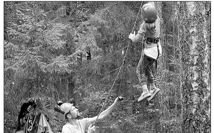
Meža zinību aktivitātes Zilajos kalnos.

Savukārt, atceroties latviešu strēlnieku bataljonu dibināšanas 100. gadadienu, 2015. gada 6. oktobrī Zilajos kalnos notika skolēnu pārgājiens, kas pulcēja vairāk nekā 700 dalībniekus no Ogres un Ikšķiles. Pārgājiena dalībnieku plūsmas ar karognesējiem kolon-