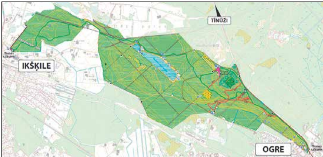
Aģentūras apsaimniekoto teritoriju atrašanās vieta Latvijā un reģionā.

Kompleksa austrumu daļā Ogres pilsētas teritorijā atrodas valsts nozīmes aizsargājamais pilskalns „Zilais kalns – pilskalns” (Valsts kultūras pieminekļu sarakstā Nr. 1861, aizsardzībā kopš 1998. gada). Pēc pētnieka Ernesta Brastiņa