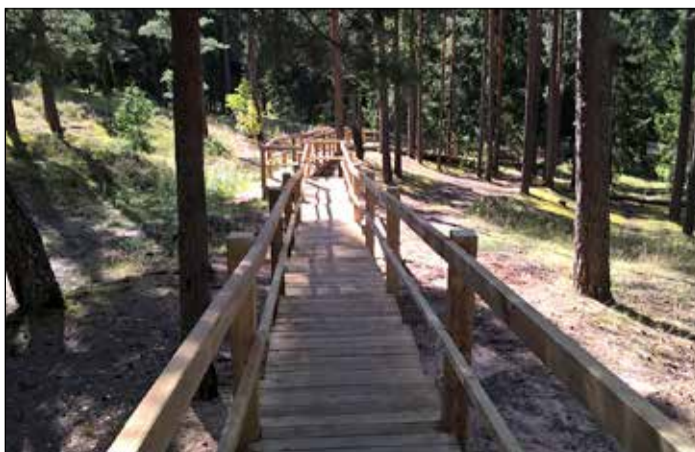
Jaunizveidotās kāpnes Zilo kalnu parka teritorijā.