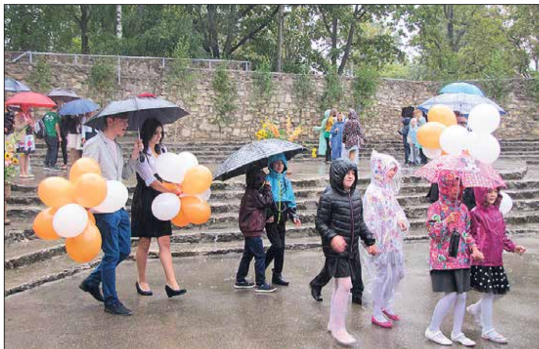
Estrādē iesoļo Ikšķiles vidusskolas pirmo un divpadsmito klašu skolēni.

1. septembrī visās Ikšķiles novada izglītības iestādēs svinēja Zinību dienu. Pirmais svētku stafeti iesāka Tīnūžu pamatskolas kolektīvs, kopā pulcējot 175 skolēnus. Šajā mācību gadā skolas gaitas uzsāka divas pirmās klasītes, kopā 28 skolēni. Svinīgajā pasākumā skolas vadība pateicās par 2014./2015. mācību gadā paveikto projekta „Mammadaba” vides izglītības programmā „Izzini mežu”.