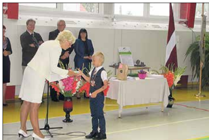
Tīnūžu pamatskolā šogad mācīsies 28 pirmklasnieki.

trīs izlaiduma klašu audzēkņi, kuriem tika uzticēts iezvanīt jauno mācību gadu.