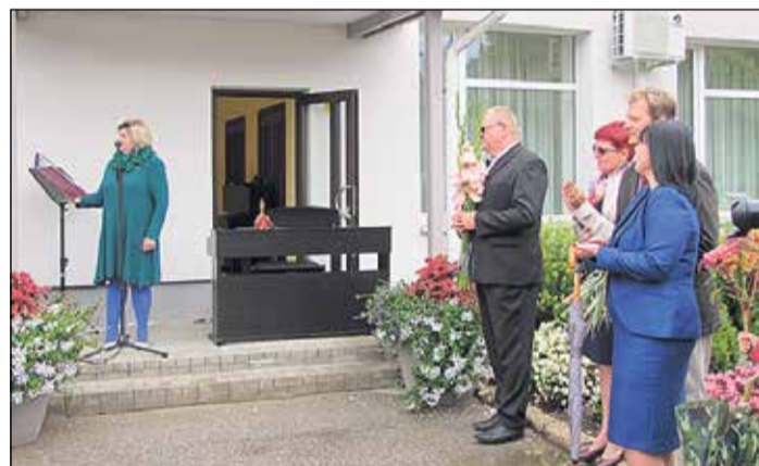
Ikšķiles Mūzikas un mākslas skolas pirmais zvans šajā mācību gadā.