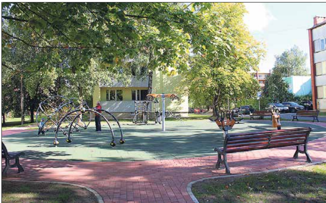
Bērnu rotaļu laukumā uzstādīti septiņi āra trenāžieri un soliņi.

Pie skolas šobrīd jau ir redzama būvtafele ar jaunā skolas korpusa vizualizāciju. Projektēšanā šobrīd esam stadijā, kad ir izveidota