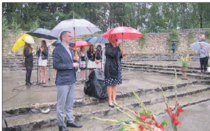
Lietainais laiks nebija šķērslis Ikšķiles vidusskolas kolektīvam pulcēties estrādē.

Savukārt Ikšķiles vidusskolā Zinību diena sākās ar tradicionālo svētbrīdi Ikšķiles Sv.Meinarda ev.luteriskajā baznīcā, uz kuru tika aicināti skolēni, vecāki un skolotāji. Neskatoties uz lietaino laiku, Zinību dienas noslēgums notika Ikšķiles estrādē, lai radītu svētku sajūtu pirmo klašu skolēniem. Ikšķiles vidusskolas skolēniem un skolotājiem izpildot jauno Ikšķiles himnu, mazie ķipari kā simbolisku veiksmes zīmi palaida gaisā krāsainus balonus. Šogad lielo vidusskolas saimi papildinās četras pirmās klasītes, kopskaitā