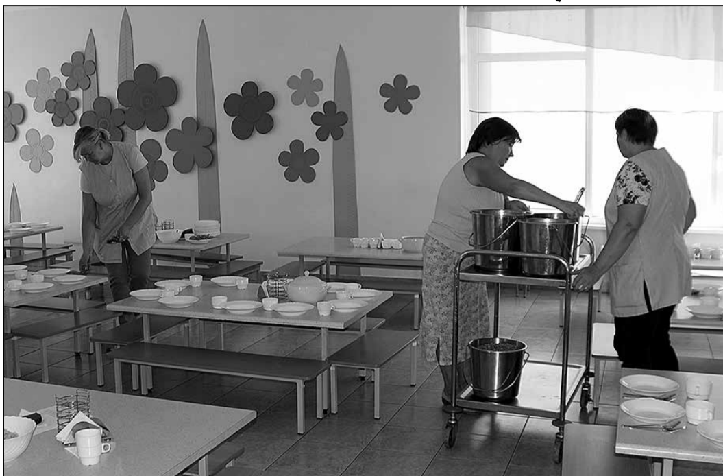
Atlaide bērnu ēdināšanai pašvaldības pirmsskolas izglītības iestādē „Urdaviņa” noteikta 50% apmērā.

Pašvaldība provizoriski aprēķinājusi, ka atlaides piešķiršanai līdz gada beigām tiks izlietoti aptuveni 7,5 tūkstoši eiro par 96 bērnu ēdināšanu, lai arī precīza daudz bērnu ģimeņu bērnu uzskaitē līdz šim nav veikta un to bērnu skaits, kam pieņemtos daudz bērnu ģimeņu atlai-