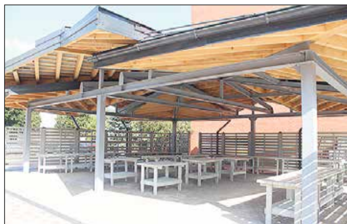
Jaunatklātais tirgus laukums Ikšķiles centrā.

Paralēli šim procesam tiek strādāts pie bērnudārza projekta. Vairu atgādināt, ka bērnudārzs atradīsies Lībiešu parkā – tuvākajā stūrī, no Birzes ielas puses skatoties. Šobrīd jau ir izveidota ēkas telpu eksplikācija, izvietojums, ir izdomāta koncepcija par to, kur kādus rotaļu laukumus būvēsim, kur būs iebrauktuves, stāvvietas un kur iebrauktuves. Projektētājs jau strādā pie ēkas būvkonstrukcijām un ārējā veidola. Paralēli šim procesam ir izsludināts konkurss par Lībiešu ielas rekonstrukciju, kurš noslēgsies 1. oktobrī. Rekonstrukcijas nepieciešamība ir saistīta ar bērnudārza būvniecību, jo jebkuram bērnudārzam ir jābūt sasniedzamam pa trotuāru, kā arī bērnudārza teritorijai ir jāpievada komunikācijas. Lielākā daļa komunikāciju Lībiešu ielā jau ir, projektā jāpievieno pieslēgums tieši uz bērnudārza teritoriju. Kad noslēgsies iepirkums, būs projektētājs, kurš jau kopā ar bērnudārza projektētāju veidos pieslēgumus bērnudārzam un plānos šo divu objektu savietojamību. Šeit ir redzamas šīs bērnudārzam izvēlētas vietas pozitīvās puses – izbūvējot Ozolu ielu, ir trotuārs, Birzes ielā arī, komunikācijas tuvu, augstsprieguma līnija iet tieši gar teritoriju. No šāda viedokļa skatoties,