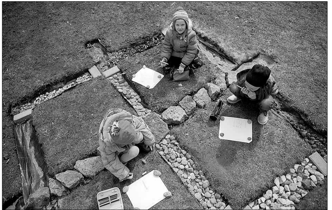
Brīvā skola lepojas ar īpašu attieksmi pret bērniem, izglītību un latviska dzīvesveida kopšanu.

Citā „Zied zeme” projektā centrs ticis pie nepieciešamajiem