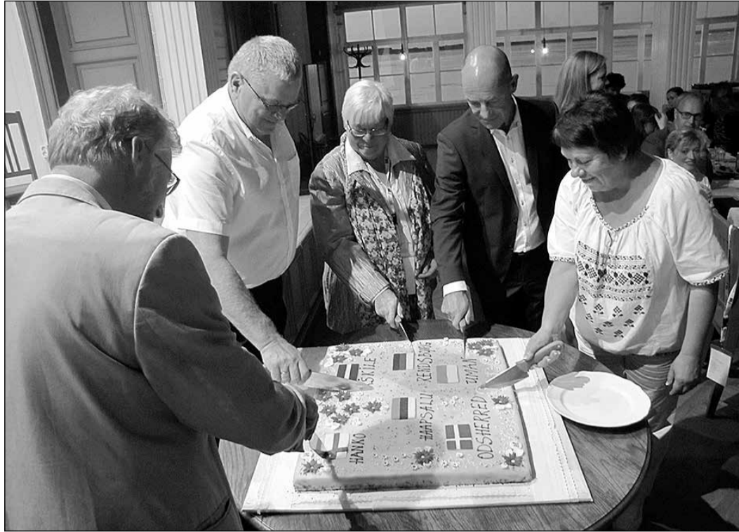
Sadraudzības valstu pārstāvji svīnīgajā pieņemšanā projekta noslēguma pasākumā.

Projekta ietvaros jauniešu piedalījās kopmēģinājumā ar Hāpsalas kultūras centra kora jauniešiem, sagatavojot priekšnesumu svīnīgajam pusnakts koncertam Hāpsalas Doma baznīcā 28. augustā. Šajā koncertā ar skaļiem aplausiem uzņēma arī jauniešu vokālā ansambļa „Vivo” izpildītās latviešu un ārzemju autoru dziesmas.