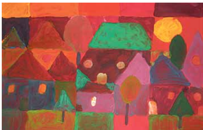
„Saulriets Ikšķilē”. Siltija Paura, IMMS, 2. kl. Sākumskolas grupā 2. vieta

zilas, kad skraidījām mēs mazi caur Ikšķiles ābeļdārziem un klusi jo klusi slepus čīpām ābolus.