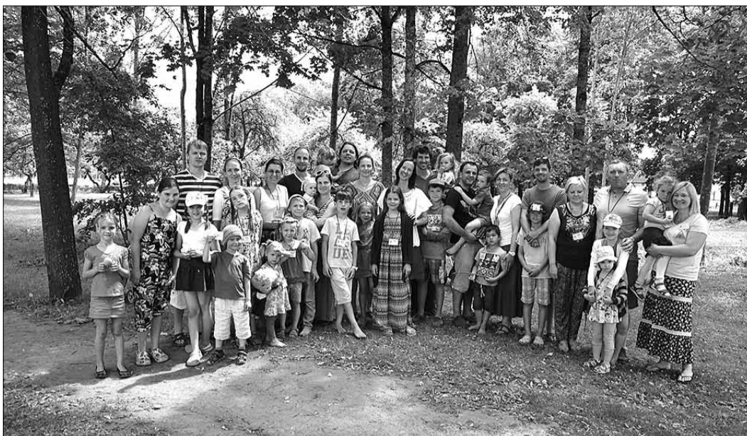
Visi ikšķilieši Viļānu „3x3” saietā 2015. gada jūlijā.

Viļānos šis bija jau 50. „3x3” saiets Latvijā, uz kuru ik gadu laipni aicinātas visas tās ģimenes, neatkarīgi no vecuma, dzimtas un dzīves vietas, kas vēlas apgūt latviskās tradīcijas un sajūst kopības sajūtu ar citiem līdzīgi domājošajiem. Acimredzot tieši mūsu novadā – Ikšķilē – šādu ģimeņu netrūkst, jo šis bija pirmais gads, kad „3x3” nometnē tik liels dalībnieku īpatsvars pārstāvēja vienu mazpilsētu. Mūsējo vidū bija gan vairākas ģimenes, kas pārstāvēja