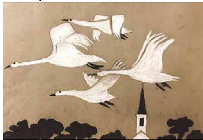
Sākumskolas grupas 2. vietas ieguvējas kategorijā „Zīmējumi” Alises Geides darbs

INGA ŠULCA , KONKURSA VĒRTĒŠANAS KOMISIJAS PRIEKŠSĒDĒTĀJA