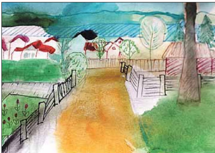
Sākumskolas grupas 1. vietas ieguvējas kategorijā „Zīmējumi” Patrīcijas Kancēvičas darbs

Sākumskolas grupā: 1. vietu ieguva Patrīcija Kancēviča un Toms Ulass, 2. vietu – Alise