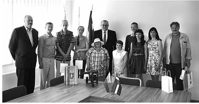
Baltkrievijas delegācijas oficiālā pieņemšana pie Ikšķiles novada domes priekšsēdētāja

Pasākuma otrajā dienā visiem dalībniekiem bija iespēja piedalīties radošajās aktivitātēs – deju terapijas un mūzikas nodarbībās, atslēgu piekariņu izgatavošanas, dekupāžas, origami, putu vai zīda, māla veidošanas un fotorāmīšu izgatavošanas darbnīcās, kā arī apliecināt savas zināšanas par veselīgu organismu un