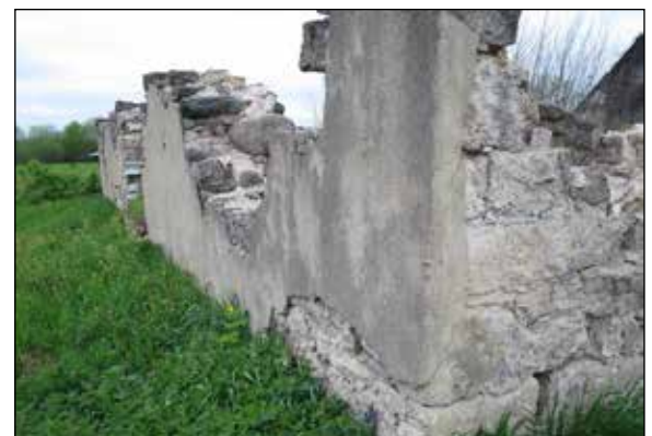
Mūra kroga drupas Līvciema ielā.