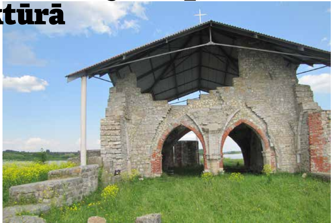
12. gs. vācu misionāra celtās mūra ēkas vieta.

Viena no vissenākajām draudzēm Vidzemē XIX gs. beigās Ikšķilē, Daugavas krastā, uzceļa koka pareizticīgo baznīcu, kas Pirmā pasaules kara laikā nodega. Neskatoties uz to, draudze turpināja tikties Ikšķiles Vecajos kapos. Tā kā kapu