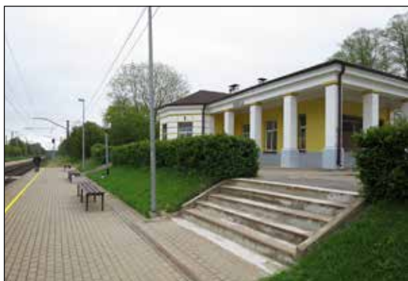
Ikšķiles dzelzceļa stacija.

IKŠKILES NOVADA PAŠVALDĪBAS SABIEDRISKO ATTIECĪBU SPECIĀLISTE