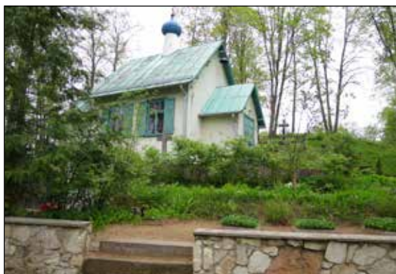
Ikšķiles Sv. Gara pareizticīgo dievnams.