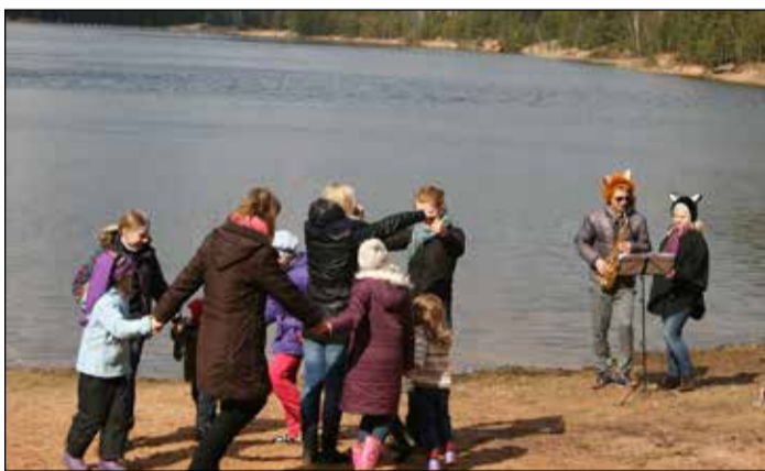
Ģimenes pulcējās Zilo kalnu trases starta laukumā, kur tika sagaidītas ar muzikālu sveicienu

Ģimenes pulcējās Zilo kalnu trases starta laukumā, kur tika sagaidītas ar muzikālu sveicienu un devās uz ugunsкура vietu Dubkalnu karjera krastā, pa ceļam risinot dabas krustvārdu miklu un orientējoties mežā. Izkustējušies mežā un atraduši apslēptos Ogres Zilo kalnu nosaukuma burtiņus, visi kopā, saliekot nosaukumu, atrisināja krustvārdu miklu un nu varēja ķerties pie olu krāsošanas, vārīšanas ugunsкура katlā un skautu maiziņu cepšanas ugunsкура oglēs. Kamēr olas