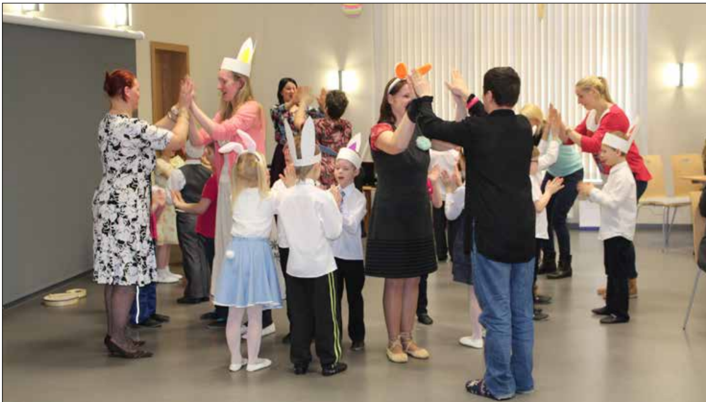
Bērni no grupas „Kaķpēdiņas” griezās lustīgos deju soļos, aicinot pievienoties arī pārējos pasākuma dalībniekus