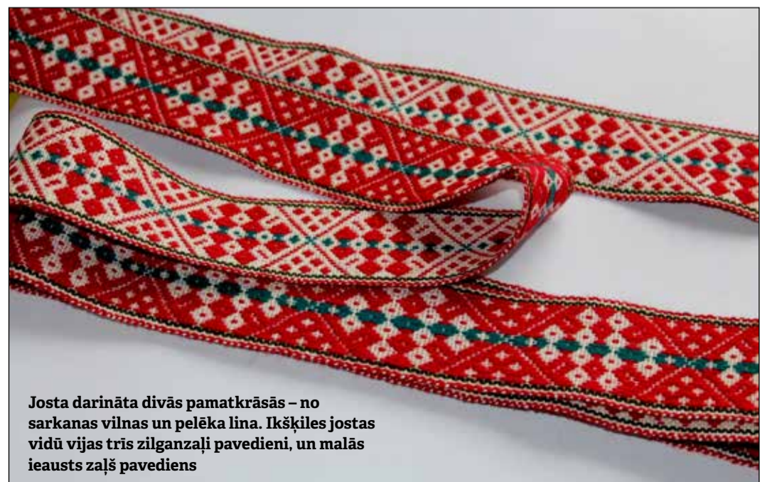
Josta darināta divās pamatkrāsās – no sarkanās vilnas un pelēka lina. Ikšķiles jostas vidū vijas trīs zilganzaļi pavedieni, un malās ieauzta zaļš pavediens