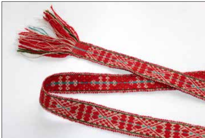
Josta ir šaura, platums – 3 cm, garums ir 120 cm. Tā, iespējams, bijusi bērna josta