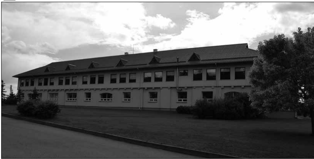
1999. gada saulainajā 1. septembra dienā tika atklāta jaunā Tinūžu pamatskolas ēka

2000. gada 10. jūnijā notika pirmais Tinūžu pamatskolas 9. klases izlaidums. Skolu absolvēja 12 jaunieši.