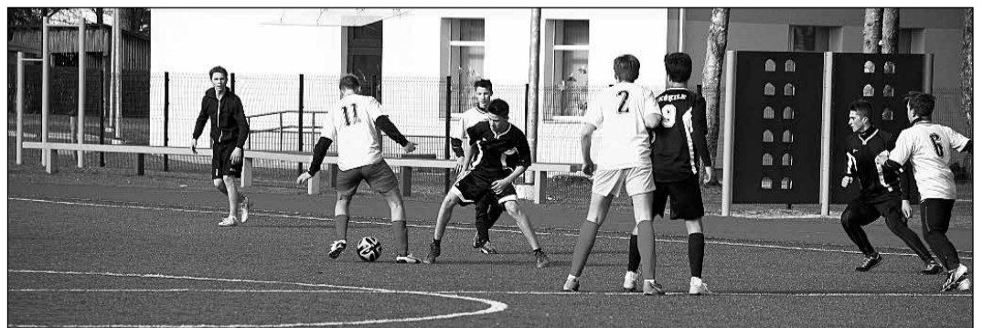
Ikšķiles vidusskolas 8.–9. klašu skolēni ir izcīnījuši iespēju piedalīties Zemgales reģiona finālos, kuri notiks 21. aprīlī Jelgavā

Pārstāvētās komandas – no Salaspils 1. vidusskolas, Olaines 2. vidusskolas, Salaspils 2. vidusskolas, kā arī mājinieku komanda no Ikšķiles vidusskolas. Katra komanda par katru cenu vēlējās iegūt turnīra uzvarētāja titulu. Viss izšķirās tikai pēc pēdējās spēles, kurā Ikšķiles vidusskolas komanda uzvarēja ar minimālu pārsvaru pār Salaspils 1. vidusskolu, kas ļāva mājiniekiem kopvērtējumā