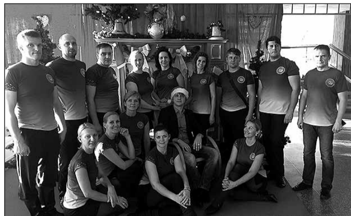
Deju kolektīvs „Upe” turpina ceļu uz XXIV Vispārējiem latviešu dziesmu un deju svētkiem, apgūstot jaunā repertuāra dejas.