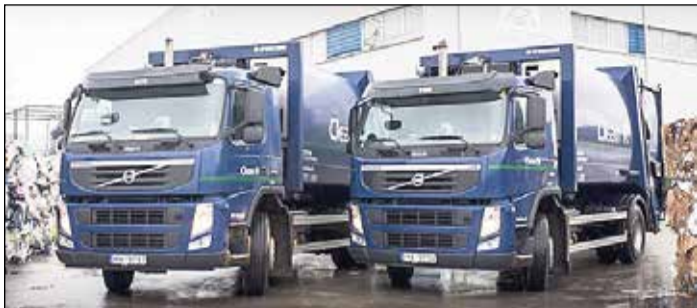
SIA „Clean R” atkritumu apsaimniekošanu pilnībā pārņems no 2017. gada 1. marta.

valdība parakstīja līgumu ar SIA „Clean R” par sadzīves atkritumu apsaimniekošanas pakalpojuma nodrošināšanu Ikšķiles novada administratīvajā teritorijā uz septiņiem gadiem.