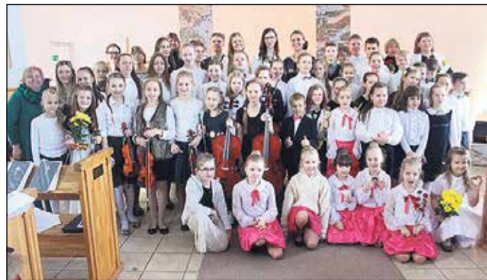
Koncerta „Baltā pasaka” dalībnieki Ikšķiles ev. luteriskajā baznīcā.

cembra Ikšķiles Mūzikas un mākslas skola rotāsies „Baltā pasakas” krāsās – te būs apskatāma Mākslas nodaļas 1.–3. klašu audzēkņu, sagatavošanas un radošo grupiņu darbu izstāde. 10. decembrī Lielvārdes kultūras centra apmeklētājus priecēs Ikšķiles Mūzikas un mākslas skolas pieaugušo mākslas studiju radošo darbu izstāde.