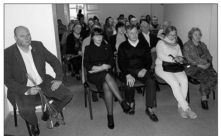
Pasākumu kuplīnāja invalīdu biedrības draugi – pašvaldības un Veselības un sociālo lietu pārvaldes pārstāvji.

D.Kļaviņa atzina, ka Latvijā starptautisko prasību ietekmē 4. lpp. >