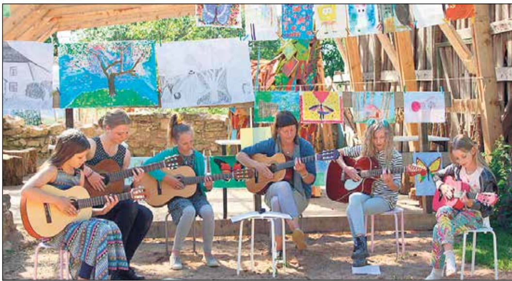
Šajā mācību gadā skola piedāvā 15 interešu izglītības nodarbības bērniem un astoņas nodarbības pieaugušajiem.