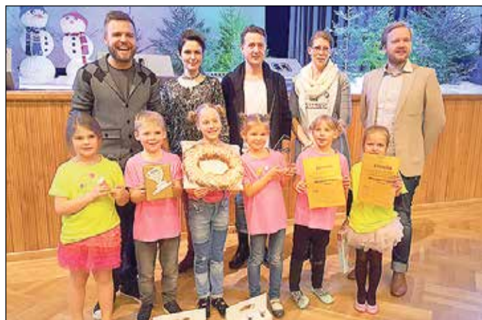
„Puķuzirnis” ar izcilu sniegumu pierādīja, ka ar atraktivitāti un milestību pret mūziku var sasniegt daudz.

Lai prieks un smaidi pavada jaunus un talantīgos māksliniekus arī turpmāk!