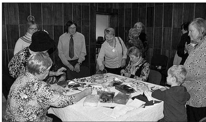
Pasākuma dalībnieki smēla iedvesmu radošajās darbnīcās.

- Ikšķiles novada pašvaldība ir to pašvaldību vidū, kas piedalās deinstitutionalizācijas projektā. Tā ir atbalsta sistēmas izveide,