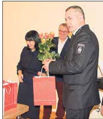
Reģionālās pašvaldības policijas darbiniekiem Ikšķilē uzticas gan pašvaldības iestādes, gan novada sabiedrība.

dienai nelielu koncertu sniedza Tinūžu tautas nama jauniešu vokālais ansamblis „Vivo”.