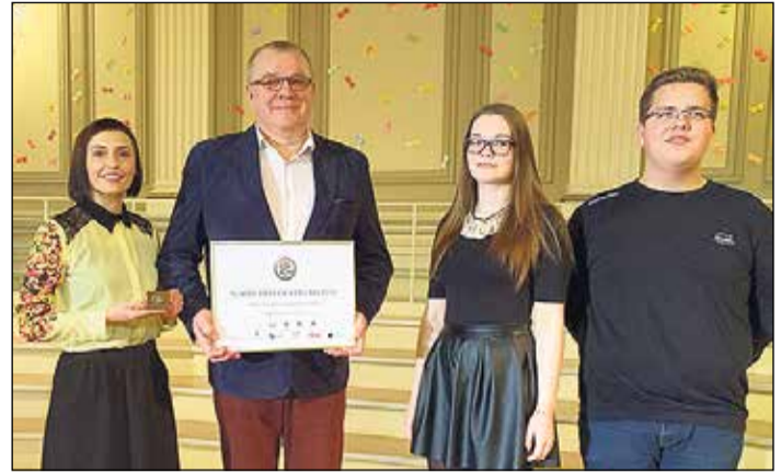
Ikšķiles novada pašvaldība – „Gada brīvprātīgais 2016”.

Jauniešu brīvprātīgā darba kustība Ikšķiles novadā aizsākās 2013. gadā, kad jaunieši sevi pierādīja Ikšķiles novada svētkos. Uz pirmo aicinājumu atsauces 27 jaunieši, kuri vadīja gan radošās darbnīcas, gan sporta un kultūras aktivitātes. Nākamajā pasākumā, jauniešu dienai „Ykescola”, pieteicās jau 40 jaunieši. Redzot lielu atsaucību un saņemot pozitīvas jauniešu atsauksmes, 2014. gadā Ikšķiles novada