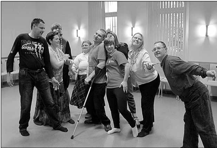
Radošā un pozitīvā atmosfērā top izrādes jauniestudējums.

Augustā Ikšķiles Brīvajā skolā notika neformālās izglītības apmācības jauniešiem „Jauna IE[SPEĻA]”.