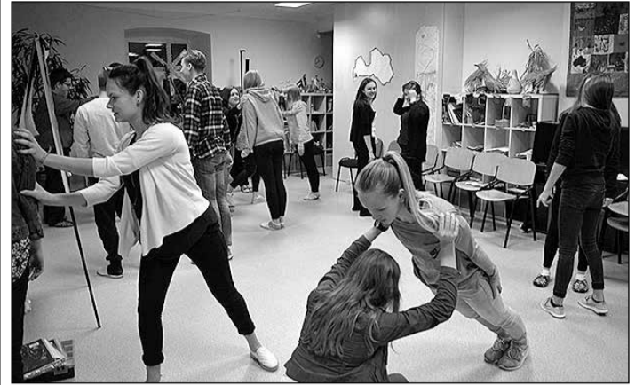
Jaunieši mācās savstarpējo uzticību, veicot praktiskus uzdevumus.

Ikšķiles novada Brīvajā skolā no 5. līdz 6. novembrim notika ikgadējās starpnovadu apmācības jauniešiem par motivāciju, saziņu, mērķiem un to izvērtēšanu, kurās piedalījās jaunieši no Lielvārdes, Ikšķiles un Ogres novada. Apmācības tika organizētas jau trešo gadu. Tajās kopā pulcējās 24 jaunieši no blakus novadiem, lai kopīgi līdzdarbotos un mācītos cits no cita.