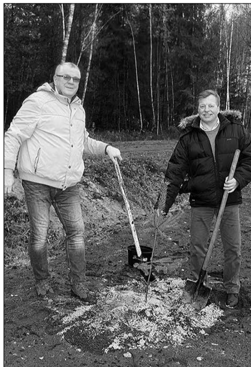
Noslēdzošais darbs – kopīgi iestādītas priedes ceļa malas nogāzē.

IKŠKĪLES NOVADA PAŠVALDĪBAS APBALVOJUMU IZVĒRTĒŠANAS KOMISIJA