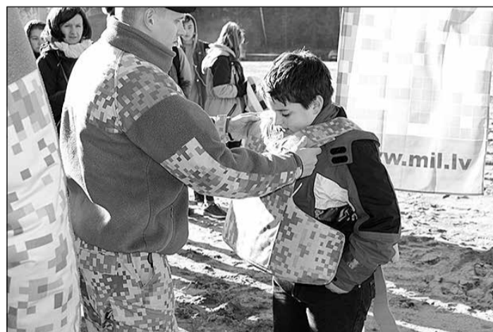
Skolēni iepazīna militāro aprīkojumu.

Apstiprināti ar Ikšķiles novada pašvaldības domes 2016. gada 26. oktobra lēmumu Nr.9 (prot. Nr.12)