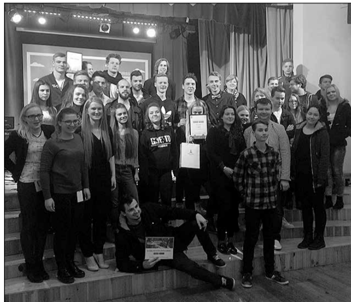
Ikšķilē pulcējās jaunie mūzikas izpildītāji konkursā „Gaisa trīce”.

Žūrijas kopvērtējumā 1. vietu un galveno balvu saņēma gru-