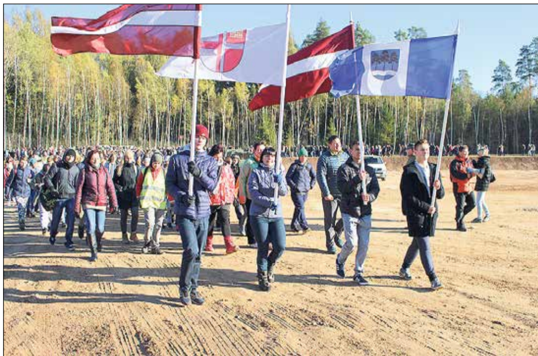
Kājām mērojuši ceļu no savām skolām, pie Dubkalnu ūdenskrātuves satikās jaunieši no Ikšķiles, Tinūžiem un Ogres.