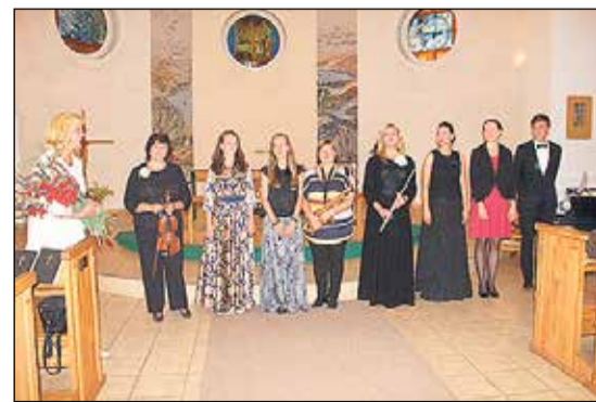
Ikšķiles ev. lut. Sv.Meinarda baznīcā iedzīvotājus priecēja koncerts „Mūzikas dievišķā stīga”, kurā piedalījās Ikšķiles novada profesionālie mākslinieki.