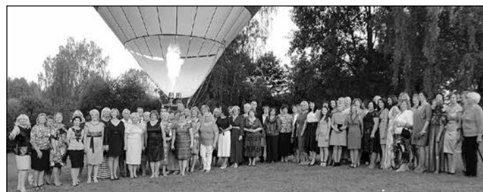
Svinību dalībnieku kopbilde pie gaisa balona.