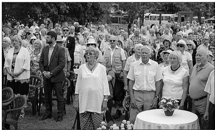
Represētie katru gadu pulcējas Ikšķilē, lai satiktos un atcerētos mūsu valsts un tautas vēstures likločus un dalītos pārdomās par šodien aktuāliem jautājumiem un norisēm.