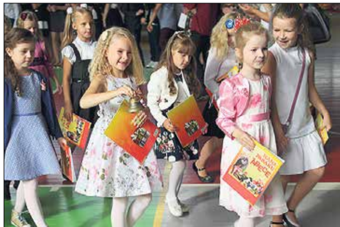
Tīnūžu pamatskolā šogad mācības uzsāka 13 pirmo klašu skolēni.

1. septembrī visās Ikšķiles novada izglītības iestādēs notika jaunā mācību gada atklāšanas pasākumi.