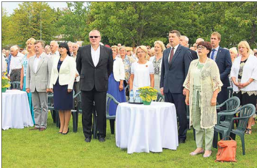
Salidojuma dalībniekus ar savu klātbūtni pagodināja Valsts prezidents Raimonds Vējonis, Saeimas priekšsēdētāja Ināra Mūrniece un Eiroparlamenta deputāte Sandra Kalniete.