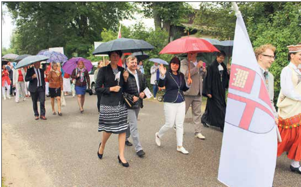
Novadnieki devās iespaidīgā gājienā.