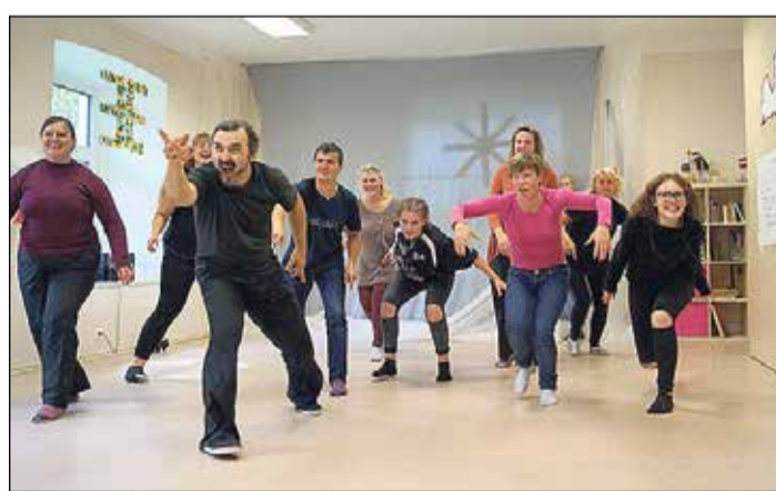
Izrādes iestudējuma process ilga visas dienas garumā.

Apmācībās tikās 12 jaunieši no Ikšķiles, Lielvārdes un Ogres, kā arī viesi no Baltkrievijas. Apmācību mērķis bija veicināt jauniešu izpratni par to, ka ikvienam no mums ir tiesības dzīvot pilnvērtīgu un aktīvu dzīvi, neskatoties uz fiziskajiem vai garīgajiem trūkumiem, kā arī sagatavot brīvprātīgos jauniešus atbalsta dar-