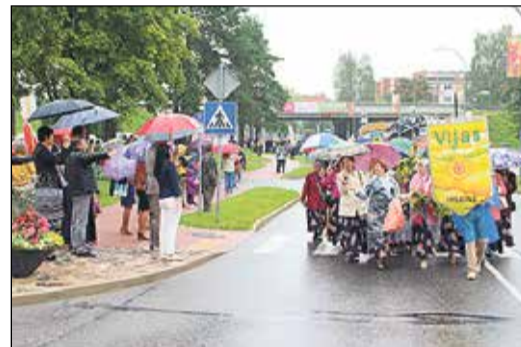
Gājienam pa ceļam pievienojās arvien jauni dalībnieki, to kopskaitam sasniedzot vairākus simtus.