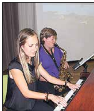
Novada viesus priecēja Ikšķiles Mūzikas un mākslas skolas pedagogi un audzēkņi.