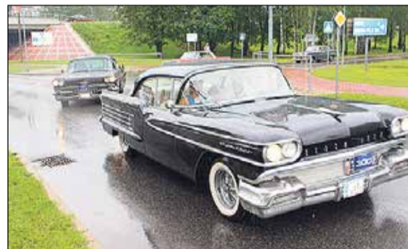
Dienas turpinājumā Ikšķilē iebrauca 100 retro automobiļu.