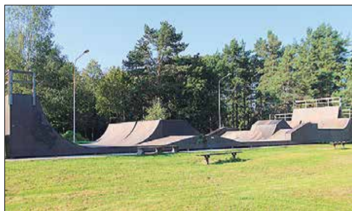
21. augusta svētdienā, aicinot talkā palīgus, tika uzkopta meža teritorija Ikšķilē – aiz skeitparka, blakus šosejai.