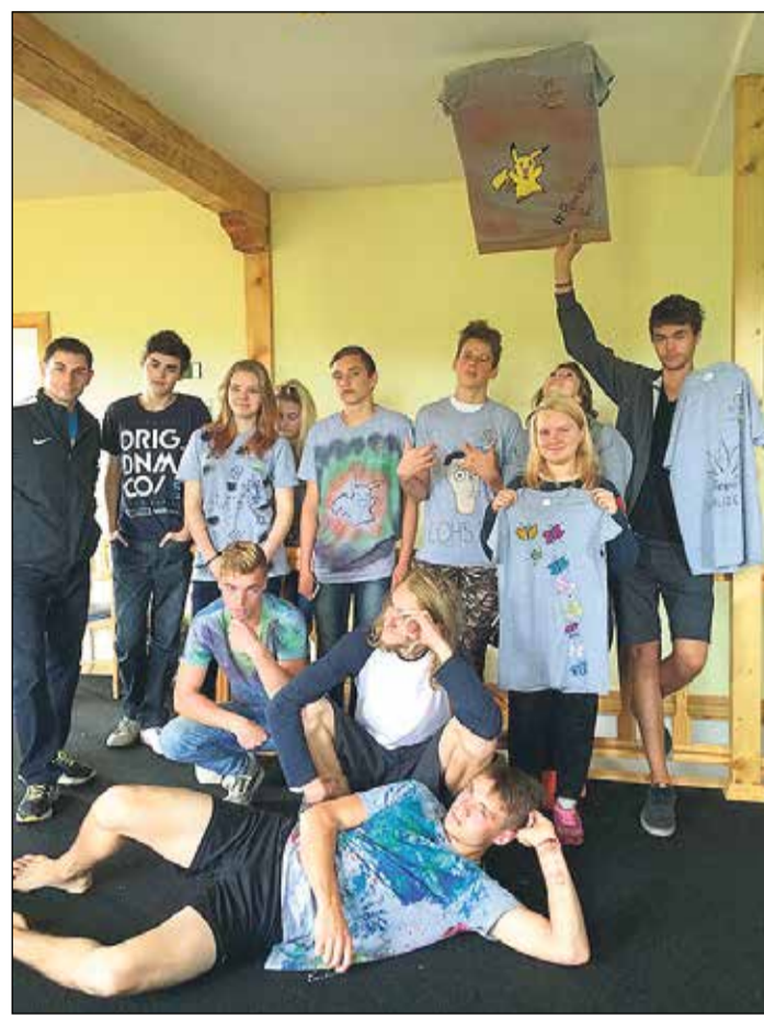
Apmācībās jaunieši radīja katrs savu unikālo T kreklu.