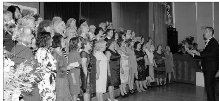
Pirmoreiz uzstājās jaunais skolas skolotāju un darbinieku koris.

Svinību turpinājumā muzicēja grupa „Dzelzs vilks”, bet pusnakti priecēja krāšņs salūts.