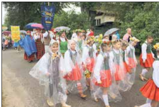
Gājienam kuplināja amatierkolektīvu pārstāvji.