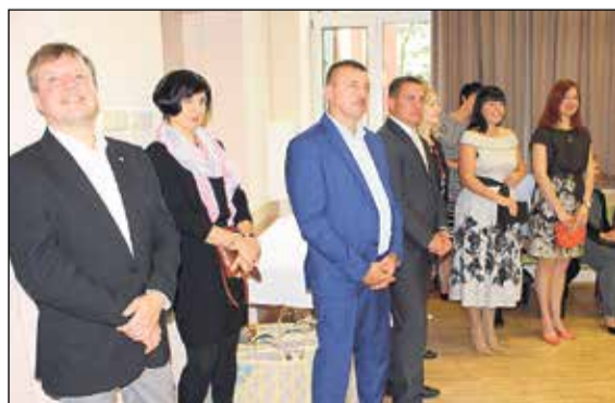
Par godu Ikšķiles novada svētkiem pašvaldībā notika pieņemšana, uz kuru bija aicināti pašvaldības iestāžu un struktūrvienību vadītāji, amatiermākslas kolektīvu vadītāji, kā arī sadarbības partneri.