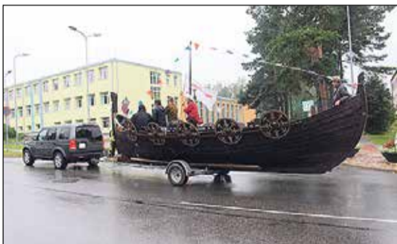
Svētku gājienam iespaidīgi kuplināja novadā sastopamo transportlīdzekļu parāde. To vidū arī vikingu kuģis.