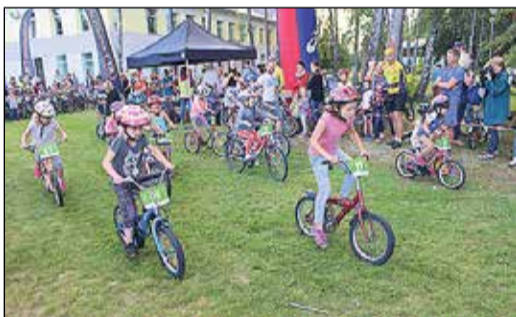
Svētkus atklāja bērnu velosacensības, kurās bija rekordliels dalībnieku skaits – 109 bērni mērojās spēkiem četrās vecuma grupās līdz 11 gadiem. Pēc velosacensībām notika nakts sporta spēles.