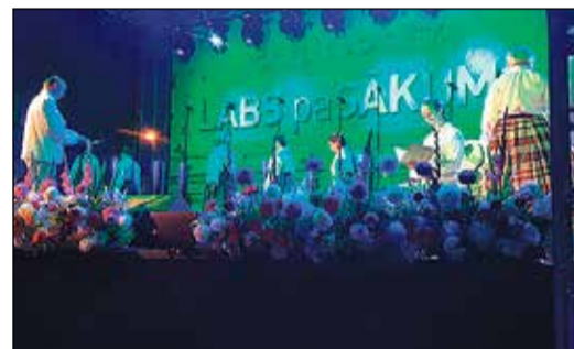
Svētku pirmās dienas pievakarē ikšķīliešus priecēja muzikāls uzvedums „Teiksma par mīlestību”.