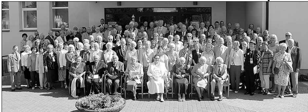
Salidojuma dalībnieki pie Gulbenes kultūras centra.