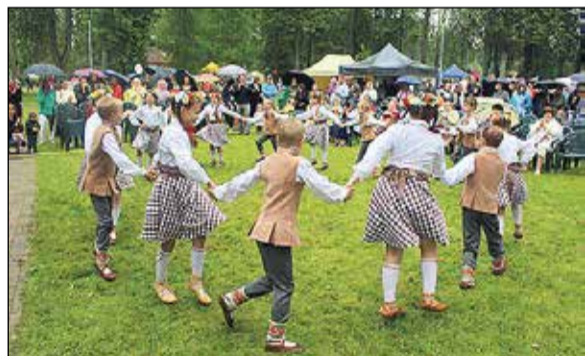
Priekšsēdētāja uzrunai 800. gadu parkā sekoja krāšņs Tīnūžu tautas nama amatiermākslas kolektīvu koncerts.