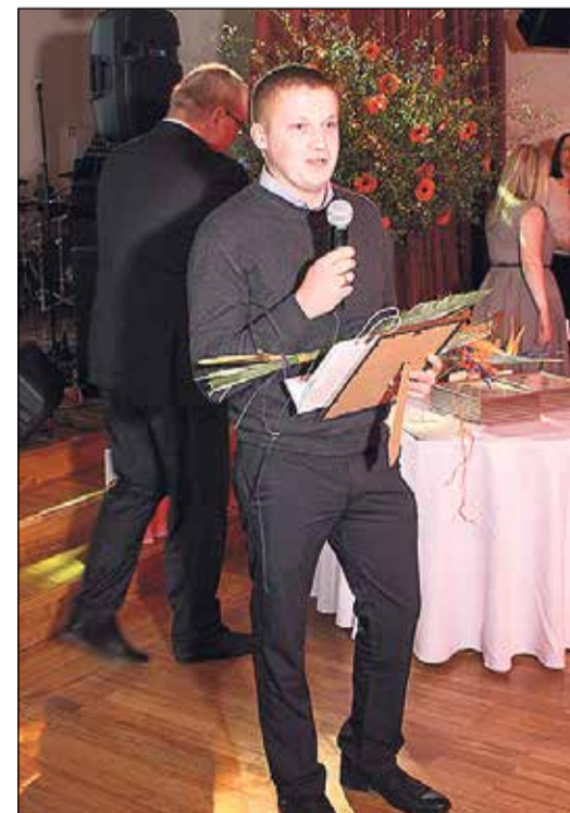
„Lielākais nekustamo īpašuma nodokļa maksātājs 2015. gadā” – SIA „Kemko Plast”.