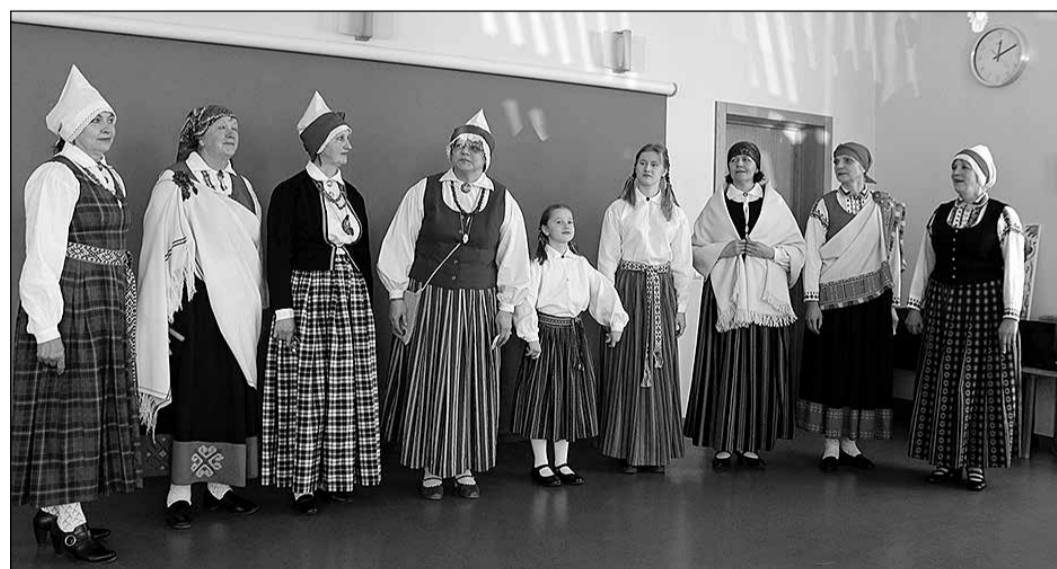
Folkloras draugu kopa „Saulsmeitas”.

Kā jau katru gadu, arī šogad bija sarūpēti skaisti un krāsaini priekšnesumi. Pasākumā Veselības un sociālo lietu pārvaldes ēkā savu