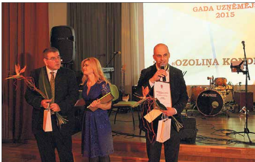
Balvu „Gada uzņēmējs 2015” saņēma SIA „Ozoliņa konditoreja”.

Balvu saņēma SIA „ABC Partners 11”. Pagājušajā gadā tika pabeigta vikingu kuģa „Ūksküll”