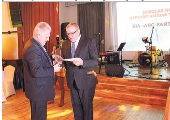
Nominācijā „Ikšķiles novada atpazīstamības veicinātājs” balvu saņēma SIA „ABC Partners 11”.

Par pašvaldības sarūpēto dāvanu saņemšanu laimētājus informēsim personīgi.