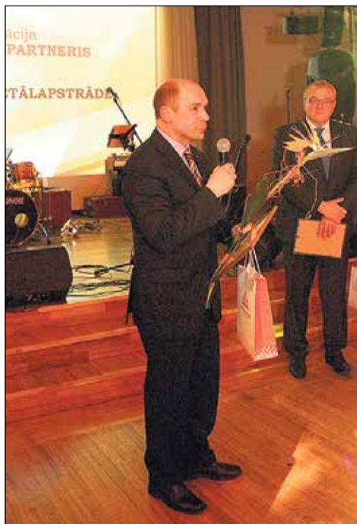
SIA „Peslaks metālapstrāde” – viens no labākajiem pašvaldības sadarbības partneriem.