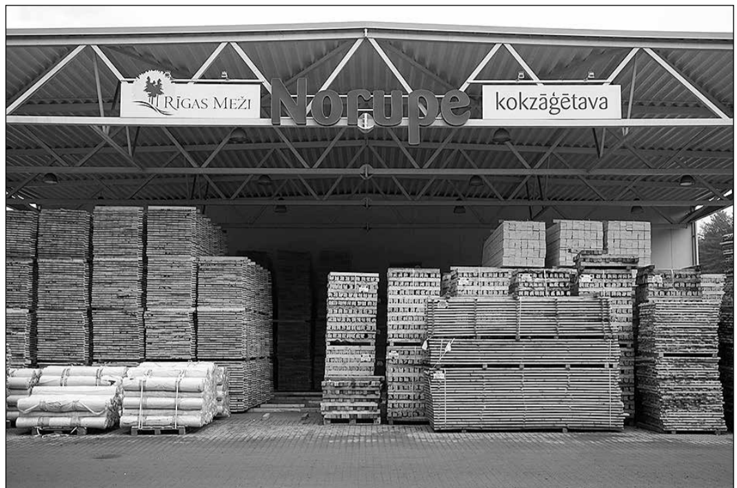
Ikšķiles novada teritorijā atrodas SIA „Rīgas meži” struktūrvienība „Norupe”.

Kokzāģētava atvērta 2013. gada maijā un turpina attīstīties, nodrošinot darbavietas aizvien vairāk cilvēku. Kokzāģētavā nodarbināti 58 darbinieki. Arī šo-