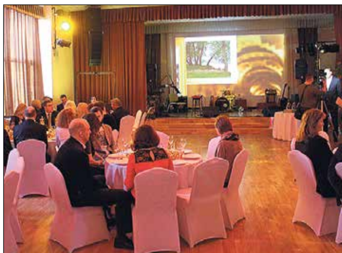
Ikšķiles novada pašvaldības pasākums „Uzņēmēju gada balva” notika jau sesto reizi.