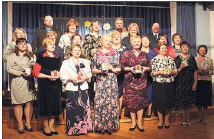
Pasākumā pulcējās vairāk nekā 100 darbinieku plašā „Urdaviņas” saime.

Klātesošos uzrunāja arī Krinkeles kundze: „1. aprīlis – tas ir mūsu „Urdaviņas” datums, tā ir mūsu vis-skaistākā tradīcija. Es nezinu ne-