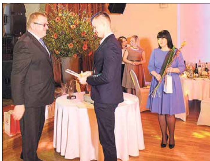
Picērija „2 tomāti” titula „Jaunais uzņēmējs” saņēmēja.