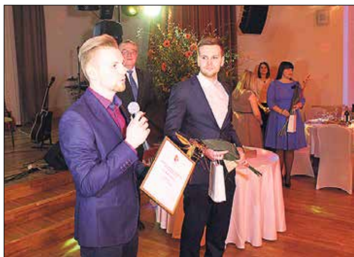
Nominācijas „Jaunais uzņēmējs” balva tika arī SIA „KNK Develop”.