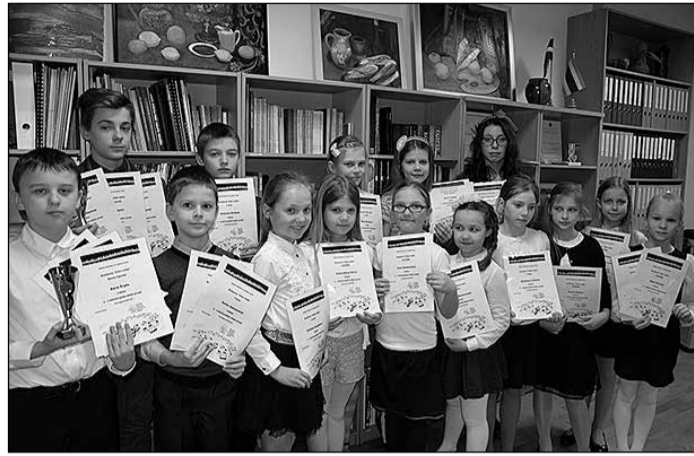
Uz I Ikšķiles jauno pianistu etižu konkursu „pulcējās skolas 2.–7. klašu klavierspēles programmas audzēkņi.

Tad bija klāt svinīgais apbalvošanas brīdis direktores kabinetā! A grupā lieliski rezultāti – četr-