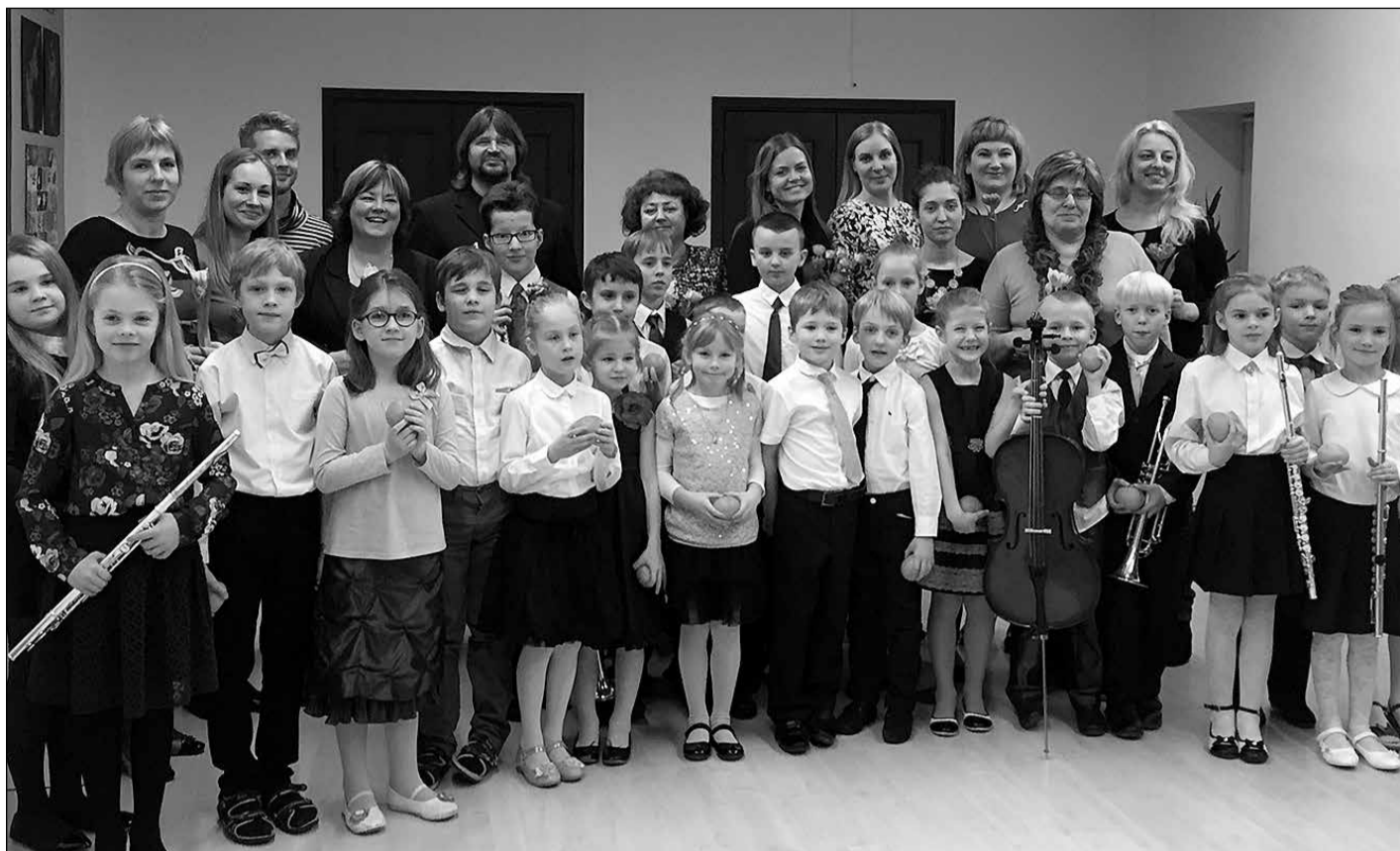
Muzikālais vakars bija kā izaicinājums vecākiem, kuri līdzdarbojās un dalījās ar savām zināšanām par mūzikas instrumentiem.

mūzikas instrumenta spēles un mūzikas skolas nozīmi, kas attīsta bērna abas smadzeņu puslodes (attīstās intelekts un viss fiziskais ķermenis – mugurkauls, elpa, rokas, kājas), ietekmē emocionālo attīstību, loģisko un radošo domāšanu; audzina mūzikas amatierus un profesionāļus, kas darbojas orķestros, koros, ansambļos amatiermākslā un kā profesionāļi valsts un pasaules mūzikas jomā; audzina nāka-