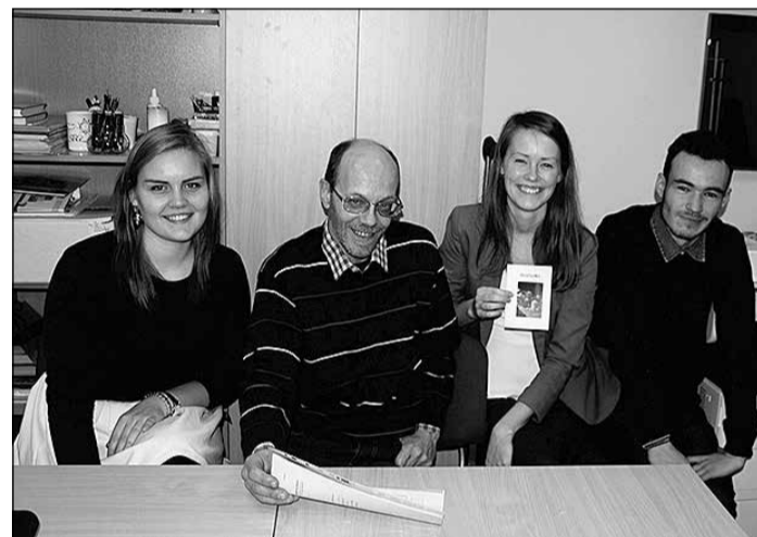
Projekta ietvaros jaunieši radīja rakstu sēriju par aktīviem un iedvesmojošiem Ikšķiles invalīdiem.