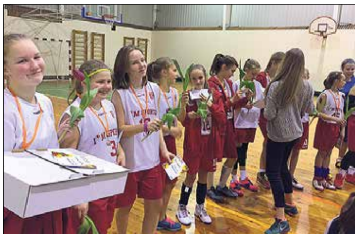
Godalgotās vietas tika apbalvotas ar kausiem, medaļām un balvām.

Godalgotās vietas tika apbalvotas ar kausiem, medaļām un balvām, papildus vēl organizatori par godu 8. martam daiļā dzimuma pārstāvēm bija sagādājuši patīkamu pārsteigumu, uzdāvinot tulpju ziedu kā pateicību par piedalīšanos sacensībās un aplie-