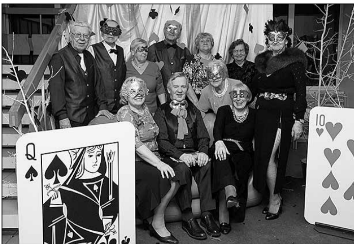
Ikšķiles tautas nama senioru vokālais ansamblis „Saulgrieži”.