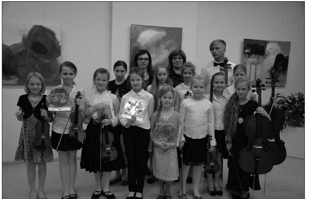
Ziemassvētku gaidīšanas noskaņās IMM jau trešo gadu mūzikas nodaļas pedagogi ar audzēkņiem gatavojas draudzības koncertiem savā skolā.