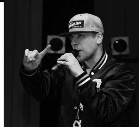
Fancy stila jauniešu balles īpašais viesis bija pašmāju populārākais reperis Ozols.

Bildes no pasākuma un fotostūrīša pieejamas sociālajā tīklā „Facebook” IK jauniešu lapā.