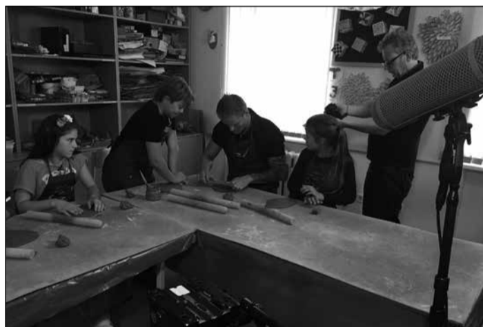
Filmēšanas grafiks bija ļoti saspringts – tas noritēja gan vasarā, gan arī atsākoties mācību gadam.