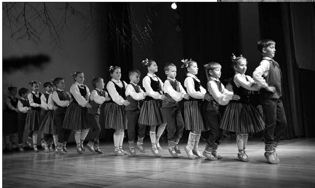
Pasākumā klātesošos ar jauku koncertu priecēja Tinūžu tautas nama jauniešu vokālais ansamblis „Vivo”, kā arī bērnu deju kolektīvs „Upīte”.

gandarīts par veiksmīgo sadarbību: „Prieks, ka esat šeit ieradušies kuplā skaitā, prieks, ka šajā gaišajā laikā nepaliekat mājās, bet nākat kopā, lai svinētu starptautiskos svētkus.