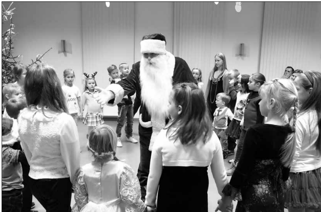
Pasākuma otrajā daļā uzstājās Ikšķiles novada jauniešu deju kolektīvs „Spole”, kas kopā ar Ziemassvētku vecīti vadīja arī atraktīvas rotaļas.

„Ši ir foršākā no visām eglēm, kādas mums ir bijušas,” teica viena no mammām, kura 2015. gada 29. decembrī ar savu kuplo ģimeni piedalījās audžuģimenēm, aizbildņu ģimenēm un Veselības un sociālo lietu pārvaldes uzaicinātajām ģimenēm rīkotajā gadu mijas ballē.