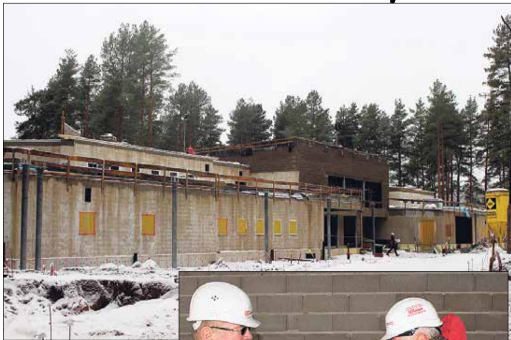
Pirmsskolas izglītības iestāde „Čiekuriņš” durvis apmeklētājiem vērš 2018.gadā.

Jau vairāk nekā simt gadu Latvijā tiek svinēti spāru svētki. Tos atzīmē laikā, kad ēkas celtniecība ir savā augstākajā punktā – pabeigta jumta nesošā konstrukcija un visi smagākie darbi ir pabeigti. Ēkas augstākajā punktā pakārtais vainags simbolizē to, ka meistari