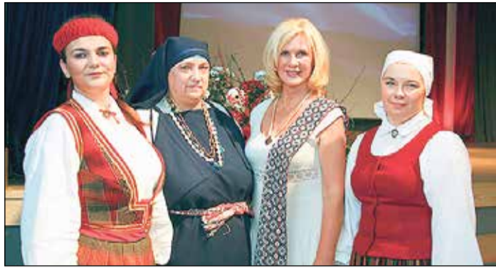
Kultūras dzīves spēks – tās cilvēki!

Pateicoties spēcīgas komandas darbam un sapratnei pat no acu skatiena, gads aizvadīts veiksmīgi. Ziemassvētku gaidīšanas laikā vēlos sirsnīgi pateikties katram darbiniekam Ikšķiles un Tinūžu tautas namā, SIA „Ikšķiles māja”, Reģionālās pašvaldības policijas Ikšķiles nodaļā, Saimniecības nodaļā, it īpaši elektrības vīriem. Paldies par sadarbību, sapratni un atsaucību Ikšķiles novada pašvaldības domes deputātiem, pašvaldības vadībai, kolēģiem Ikšķiles vidusskolā, Mūzikas un mākslas skolā, Izglītības, sporta un jaunatnes lietu pārvaldē, Tūrisma informācijas centrā, kultūras mantoju-