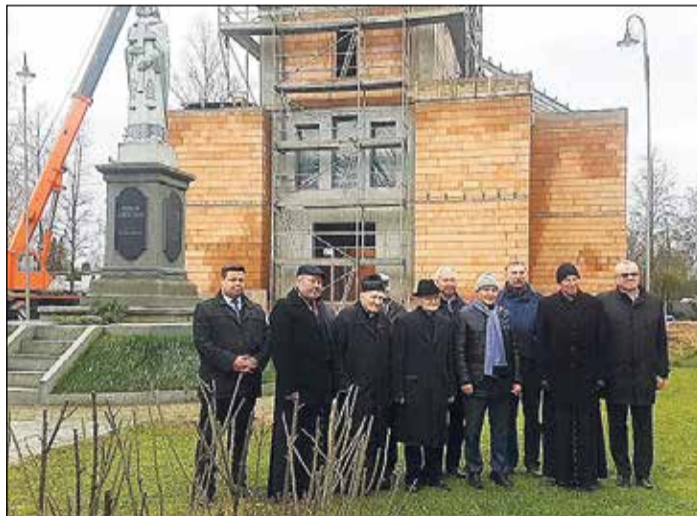
Spāru svētku dalībnieki pie topošās baznīcas.