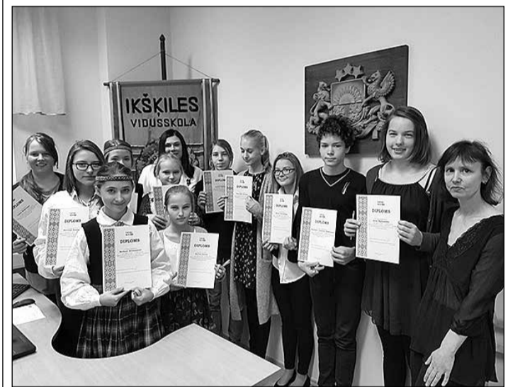
Konkursa „Latvijas karoga stāsts” uzvarētāji.