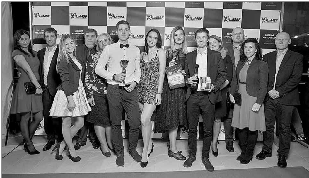
„3Bro” komanda.