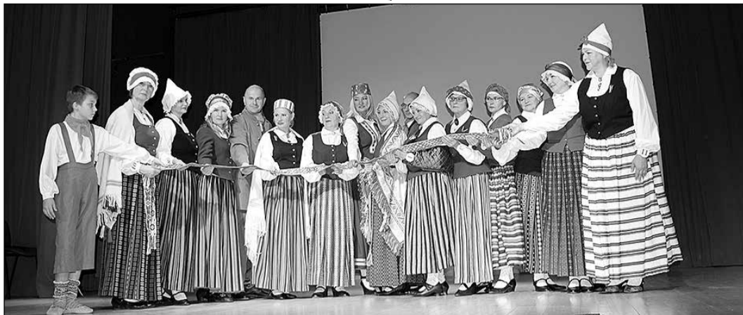
Uz Tinūžu Tautas nama skatuves – konkursa „Latvijas vecmāmiņa 2017” dalībnieces.