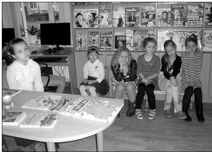
Rīta stunda mazākajiem lasītājiem – Tinūžu pamatskolas 2. klasei.

Šogad Ziemeļvalstu bibliotēku nedēļa notika no 13. līdz 19. novembrim, un tās tēma bija „Ziemeļu salas”. Tinūžu bibliotēka sadarbībā ar Tinūžu pamatskolu izvēlējās Rīta stundu mazākajiem lasītājiem – 2. klasei. Tā kā šā gada 14. novembrī vispopulārākajai Ziemeļvalstu bērnu rakstniecei Astrīdei Lindgrēnei atzi-