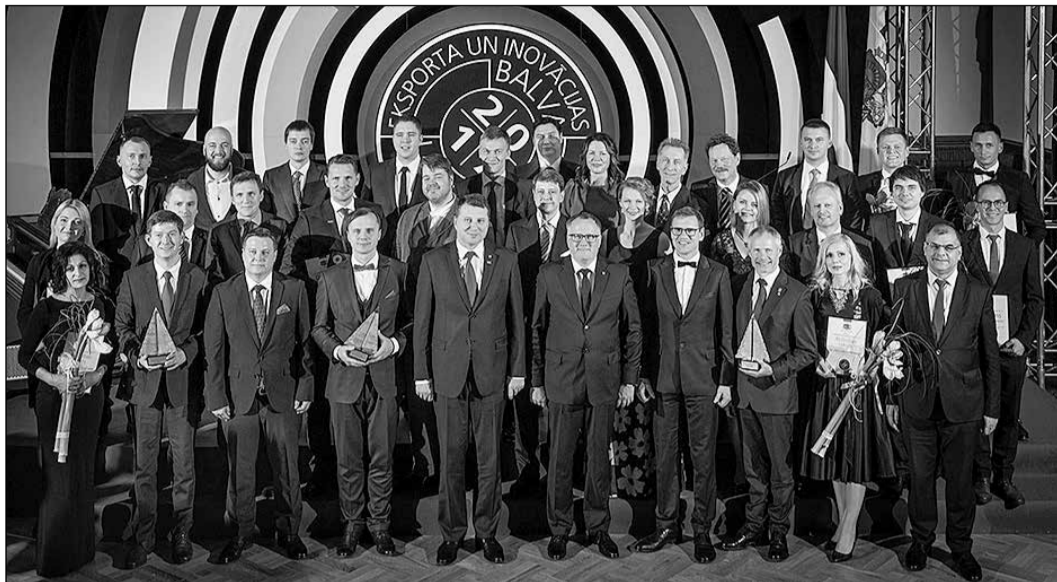
Konkursa „Eksporta un inovāciju balva 2017” laureāti.

Šā gada 7. decembrī svinīgā ceremonijā Rīgas pili tika paziņoti konkursa „Eksporta un inovācijas balva 2017” laureāti.