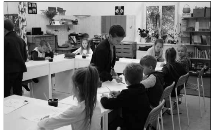
Bērni iejūtas pedagogu lomās.