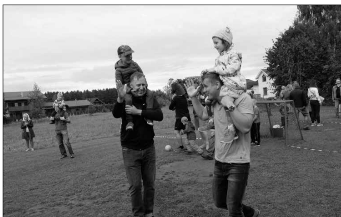
Tētu atsaucība un iesaistīšanās palīdz bērniem augt drošākiem un laimīgākiem.