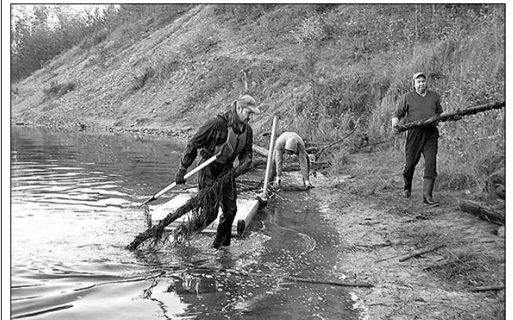
Ūdenskrātuves sakopšanas darbi..

INFORMĀCIJU SAGATAVOJA OGRES UN IKŠKĪLES NOVADA PA „TŪRISMA, SPORTA UN ATPŪTAS KOMPLEKSA „ZILIE KALNI” ATTĪSTĪBAS AĢENTŪRA”