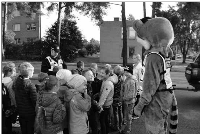
Nu bērni zinās arī to, kā rīkoties, ja uzrunā svešs cilvēks, un kas jādara, ja draud briesmas.

20. septembrī Ikšķiles vidusskolas 1. klašu audzēkņiem bija Drošības diena. To jau tradicionāli ik gadu organizē reģionālās pašvaldības policijas darbinieki.