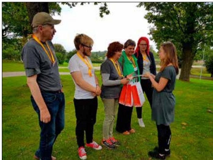
Katrā punktā bija jāveic kāds uzdevums, lai varētu pretendēt uz vērtīgām balvām.

Eiropas kultūras mantojuma dienu ietvaros kultūras mantojuma centrs „Tinūžu muiža” kopā ar Daugavas muzeju 9. septembrī organizēja autoorientēšanās sacensības vēsturisko kauju vietās. Pasākumā piedalījās aptuveni 70 dalībnieku, kuru uzdevums bija atrast 20 punktus, kas bija izvietoti Ikšķiles un Salaspils novadu teritorijās. Katrā punktā bija jāveic kāds uzdevums, lai varētu pretendēt uz vērtīgām balvām. Kopumā katra komanda veica vairāk nekā