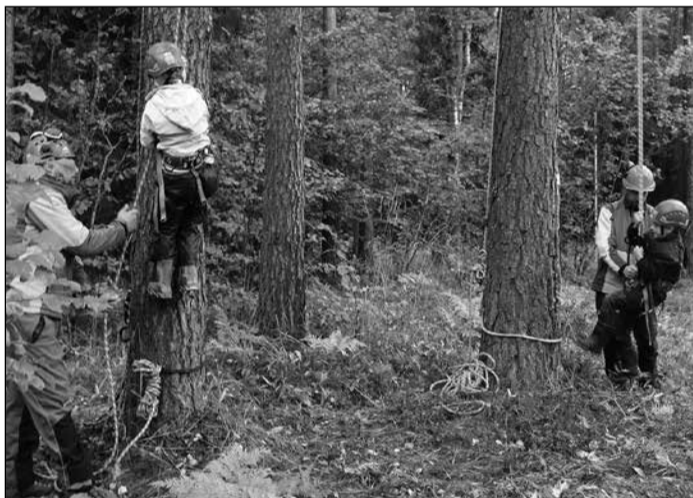
Strādājot mežā, noder arī alpinisma iemaņas.

Vides izglītības pasākuma mērķis bija brīvā dabā iepazīstināt skolēnus ar apkārtnes vidi, dabu,