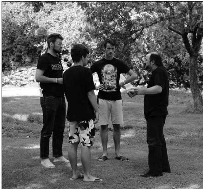
Brīvprātīgie jaunieši no Ukrainas radošā procesā.

Tāpat neviens no viņiem nespēj iedomāties savu dzīvi bez mūzikas, tā ir viņu sirdslieta. Mūzikai, protams, ir neaizstājama loma arī viņu izrādēs, tā palīdz radīt īpašu noskaņu, izprast ak-