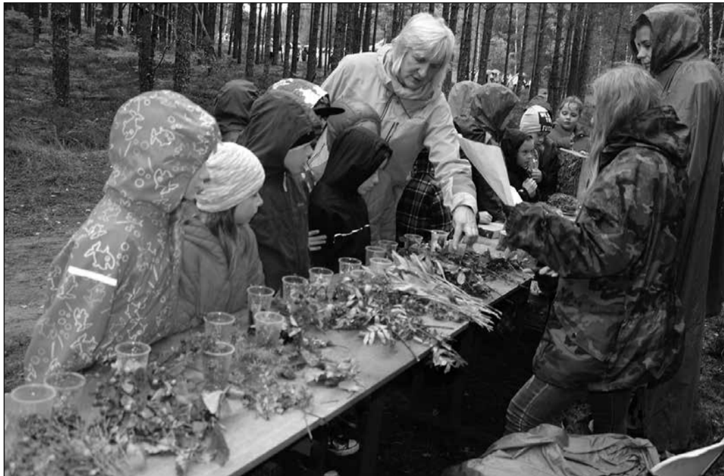
Skolēni iepazīst dabas veltes.

15. septembrī Ogres un Ikšķiles novada pašvaldību aģentūra „Tūrisma, sporta un atpūtas komplekss „Zilie kalni”” sadarbībā ar SIA „Rīgas meži”, Ogres tehnikumu un citiem sadarbības partneriem rīkoja vides izglītības pasākumu „Meža zinības Zilajos kalnos”.