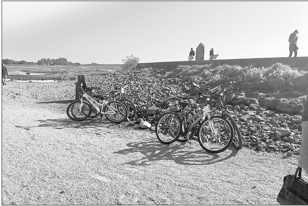
24. septembrī vairāk nekā 30 entuziastu devās pilsētas izpētes braucienā ar velosipēdiem.

Šā gada septembris Ikšķiles novadā tika izsludināts par Veselības mēnesi, un tā devīze bija „Esi vesels – dzīvo gari”. Šajā laikā notika vairāki sportiski pasākumi dažādām mērķa grupām, kā arī pārgājiens un velobrauciens gidu pavadībā, dodot iespēju novada iedzīvotājiem iepazīt savu novadu, kā arī tuvējos Zilos kalnus.