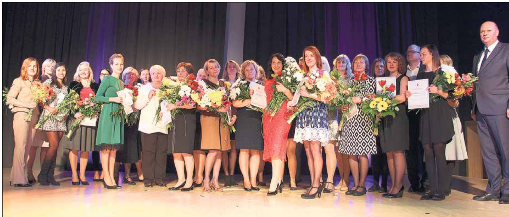
Balvu saņēmēji izraudzīti no apmēram 320 pedagogu vidus.

Jau astoto gadu Skolotāju diena Ikšķiles novadā tika atzīmēta īpaši – 6. oktobrī pašvaldība apbalvoja labākos un talantīgākos pedagogus, piešķirot titulus „Gada pedagogs” un „Goda pedagogs”.