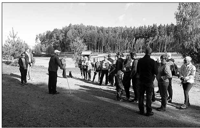
16. septembrī norisinājās pārgājiens pa Zilajiem kalniem.

Savukārt 24. septembrī vairāk nekā 30 entuziastu devās pilsētas izpētes braucienā ar velosipēdiem, tādējādi noslēdzot Eiropas Mobilitātes nedēļas pasākumus novadā. Brauciena laikā tika iz-