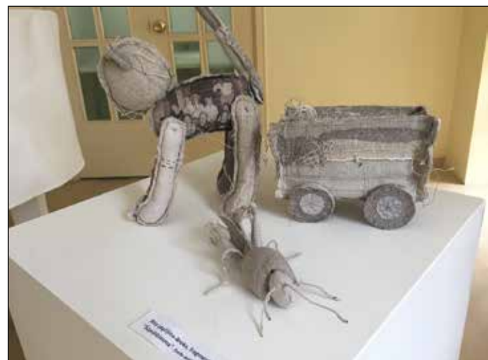
Ritas Ļeģčīļinas-Brokas „Veltījums Latvijas izvestajiem bērniem”.