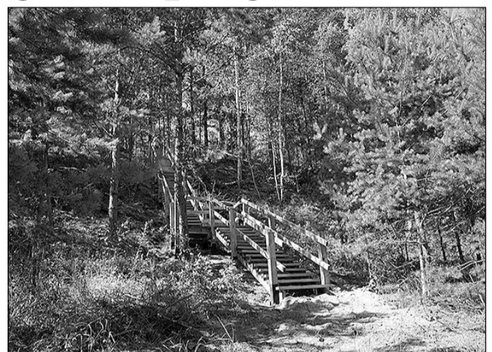
2017. gadā pie Dubkalnu ūdenskrātuves izbūvētas piecas kāpnes.

2017. gadā izbūvētas piecas kāpnes pie Dubkalnu ūdenskrātuves, kā arī uzstādīti 60 m aizsargbarjeru. Kopējās kāpņu un aizsargbarjeru izbūves izmaksas ir 17898,45 eiro. Kāpnes un aizsargbarjeras ir veidotas atbilstoši Dabas aizsardzības pārvaldes Dabas aizsardzības plānam, ievērojot īpaši aizsargājamo dabas teritoriju vienoto stilu. Ar šiem