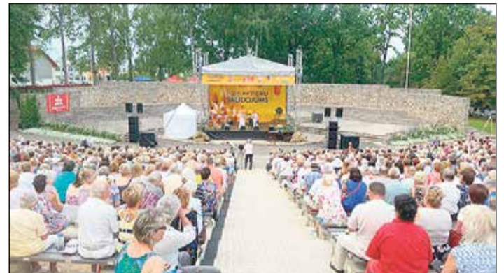
Ikšķiles estrāde bija skatītāju piepildīta.

Pasākuma laikā bija pieejama „Dziedošo aktieru salidojuma koncertprogramma” – dziesmu grāmata. Tā ļāva klausītājiem ne tikai dziedāt līdzī, bet arī iegūt savā rīcībā īpašu piemiņas izdevumu. Katrā dziesmu grāmatas lapā ievietota dziedājo aktiera bilde, dziesmas vārds un autogrāfa vieta, lai ikviens apmeklētājs pēc vēlēšanās pēc koncerta varētu pieiet pie sava iemīļotā aktiera un palūgt autogrāfu. Turklāt, tā kā pasākums notika Ikšķilē, vesels atvērums dziesmu grāmatā bija atvēlēts tieši informācijai par Ikšķili, pilsētas ievērojamākajām vietām un vēsturi.