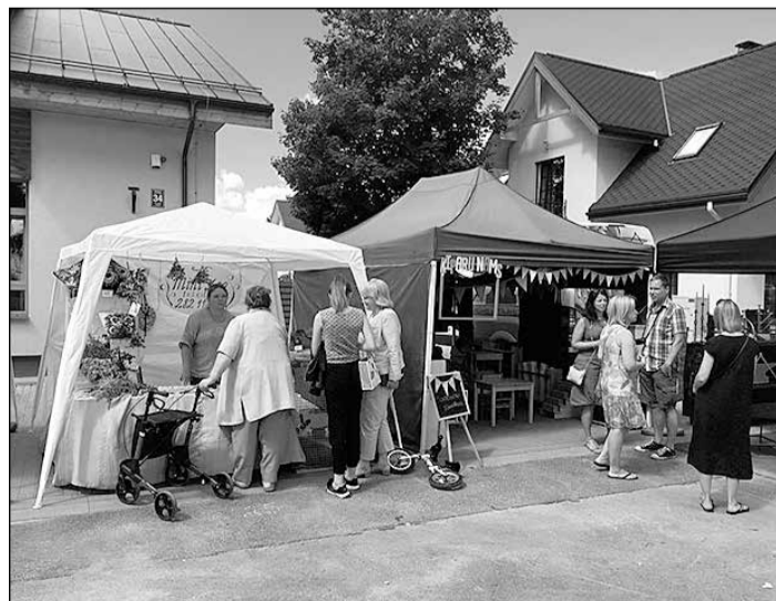
Daugavas prospekta gadatirgū piedalījās liels skaits Ikšķiles novada uzņēmēju.

Svētku idejas autors – SIA „Eg-liss”, kas 2016. gada nogalē Ikšķilē, Daugavas prospektā, atvēra vietējo mājražotāju veikaliņu „Labumu bode”. Lai daļēji segtu pasākuma izmaksas, Ikšķiles novada pašvaldība piešķīra līdzfinansējumu 330 eiro apmērā.