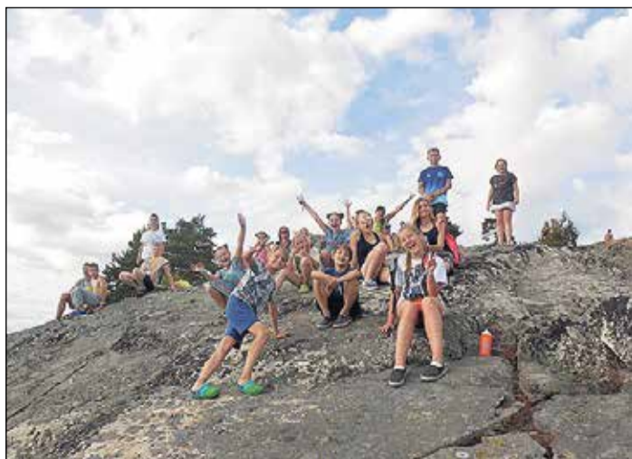
„Upīte” atpūtas brīdī.