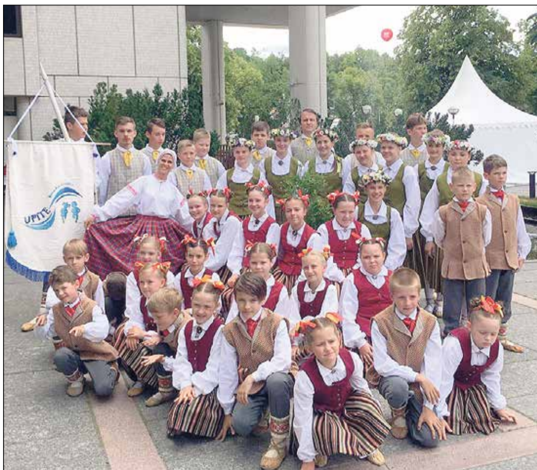
BDK „Upīte” pirms koncerta Turku ielās.

26. jūlija rītā, kad vēl nebija uzlēkusi saule, autobuss, pilns lielu un mazu dejotāju, pameta Ikšķiles novadu un Latviju, lai dotos uz Somijas pilsētu Turku, kas šogad uzņēma Eiropas tautu dziedātājus, dejotājus un muzikantus festivālā „Eiropiāde '54”.