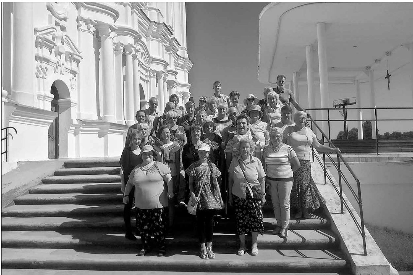
Latvijas nozīmīgākajā svētvietā – Aglonā.

Iegādājušies cienastus mājās palicējiem, tālāk devāmies uz pašu Aglonas sirdi, kur cēla un nesatricināma stāv Aglonas bazilika.