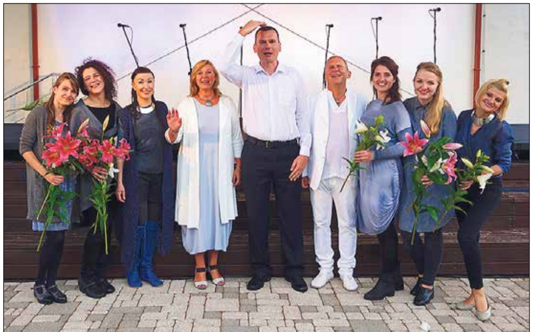
Visas trīs dienas noritēja draudzīgā un radošā savstarpējā ideju un pieredzes apmaiņas atmosfērā.