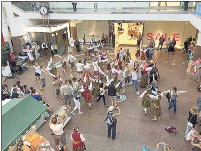
„Upīte” un „Upe” koncerts Turku tirdzniecības centrā.