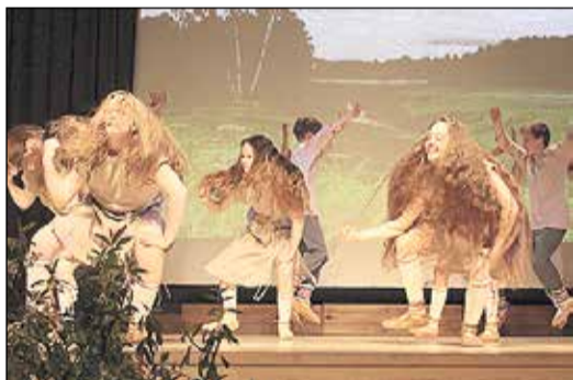
Skatītāju ovācijās saņēma arī deju kolektīva „Upīte” bērni.

Pēc koncerta kolektīvu sveica daudzi draugi un atbalstītāji.