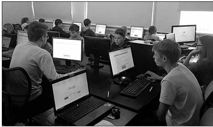
Skolēni izmēģina savas angļu valodas prasmes tiešsaistes starptautiskajā olimpiādē „Best in English”.