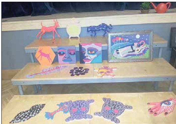
Tinūžu tautas namā atklāta izstāde un kopīgi aizvadīta meistarklase.