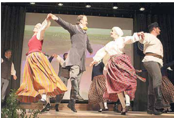
„Upe” izdejoja savas mīlākās un nozīmīgākās dejas.

Kā uzsvera kolektīva repetitore Dace Circene, „Upe” nojauc robežas starp divām frontēm – skatuves deju un tradicionālo deju, to apliecinot ar priekšnesumu, ko