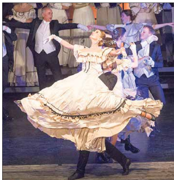
Festivāla kulminācijā notiks galā koncerts atjaunotajā Ikšķiles estrādē.

LATVIJAS OPERETES FONDA SABIEDRISKO ATTIECĪBU VADĪTĀJA