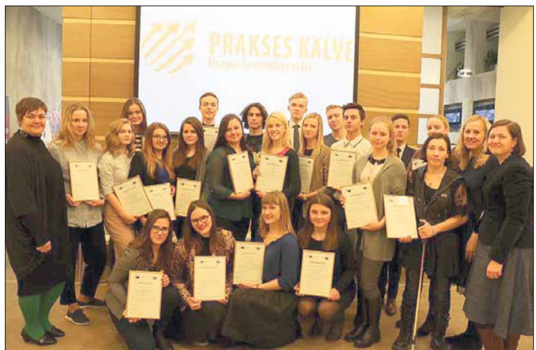
Izaugsmes nodarbību cikla „Prakses kalve” noslēgums.