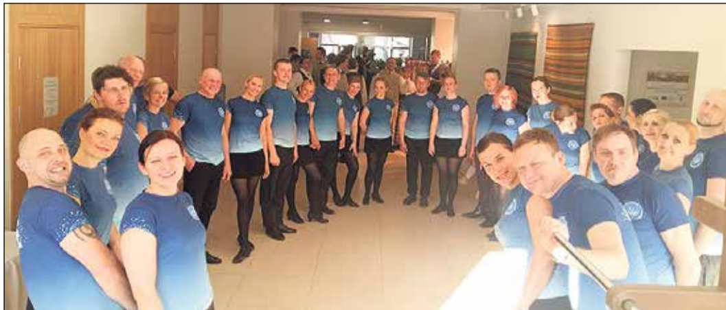
Deju kolektīvā „Upe” šosezon dejo aptuveni 30 dejotāju.

Ar sirsniņu koncertu 13. maija vakarā Tinūžu tautas namā piecu gadu jubileju svinēja vidējās paaudzes deju kolektīvs „Upe”.