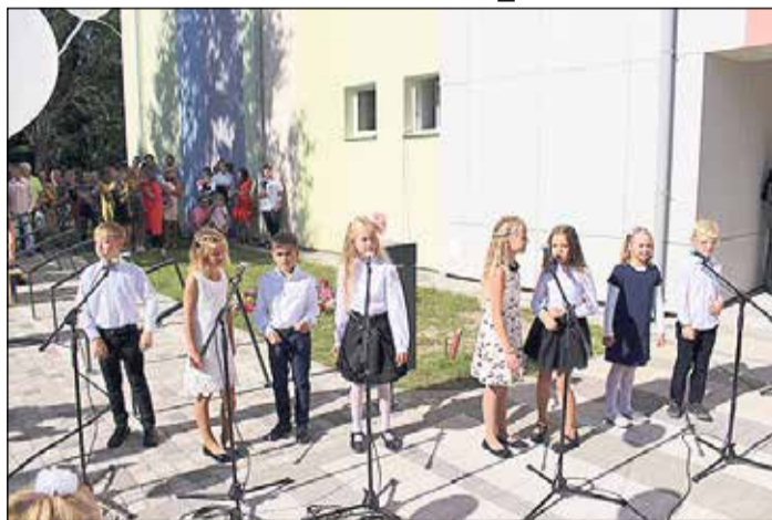
Jaunā piebūve kļuvusi par otrajām mājām mazajiem ikšķiliešiem.

Svētku dienā izglītības un zinātnes ministrs Kārlis Šadurskis sacīja: „Atklājot skolas jauno korpusu, domāju, ka ikšķilieši ir pelnījuši kārtīgu un labu piebūvi savai Gaismas pilij, šeit, skolā. Ir svarīgi – moderna, skaista, mūsdienīga mācību vide, mūsdienīgs un moderns mācību saturs, kas ienāks mūsu izglītības sistēmā jau no nākamā gada. Visam jākal-