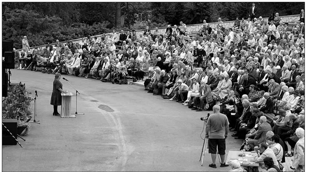
Ikšķiles estrādē piepildīja vairāki tūkstoši politiski represēto personu.

Emocionāli spēcīgi klātesošos uzrunāja Latvijas Republikas aizsardzības ministrs Raimonds Bergmanis: „Katras valsts un katras tautas vēsturē ir datumi, kas jāzina, jāpiemin un kurus nedrīkst aizmirst! Tie datumi, kas atgādina un brīdina, kas liek aizdomāties un rīkoties, lai nekas tāds nekad vairs neatkārtotos. Okupācija bija traģēdija, kas sabradāja Latviju un šeit dzīvojošos neatkarīgi no vecuma, dzimuma, tautības un ticības. Gandrīz katrā ģimenē Latvijā zina un izjūt rētas, ko iecirtis šis režīms.” Uzrunas nobeigumā viņš uzsvēra, ka šis ir laiks, kad valsts drošība un aizsardzība ir kļuvusi par vienu no valsts augstākajām prioritātēm. Šis ir mirk-