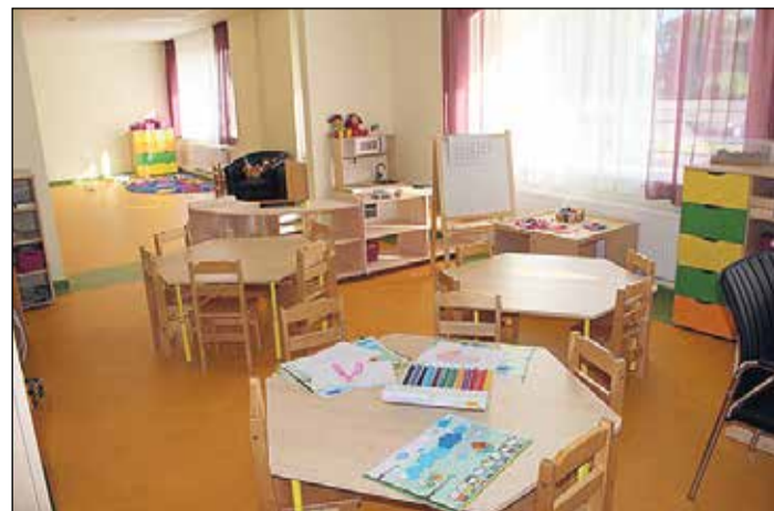
Reorganizācijas rezultātā skolā iekārtotas telpas pirmsskolas vajadzībām.

divas jaunas pirmsskolas izglītības grupas, labiekārtota un pirmsskolas vecuma bērnu vajadzībām pielāgota teritorija. Teritorija drošības nolūkos ir norobežota, bet pagalmā ierīkots bērnu spēļu laukums. Labiekārtošanas