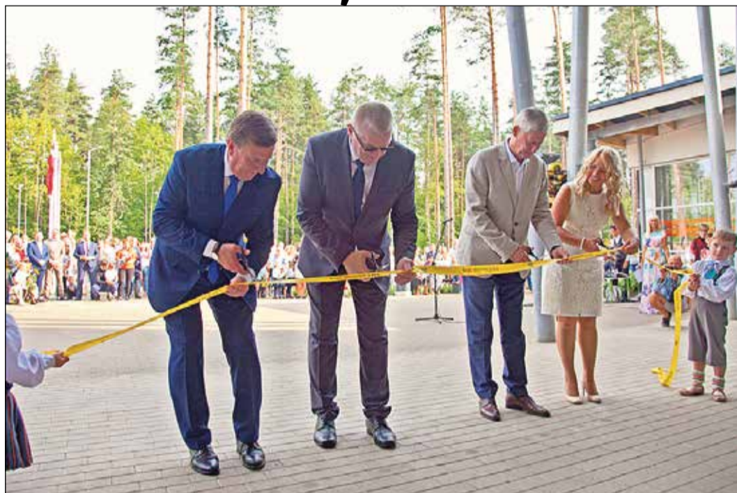
Svinīgais jaunā bērnudārza atklāšanas brīdis.

Klātesošos uzrunāja Ministru prezidents Māris Kučinskis: