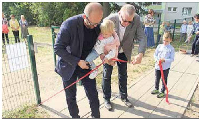
Svinīgais parka atklāšanas brīdis.