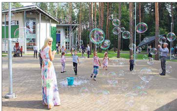
Atklāšanas dalībniekiem bija sarūpēti jautri dārza svētki.