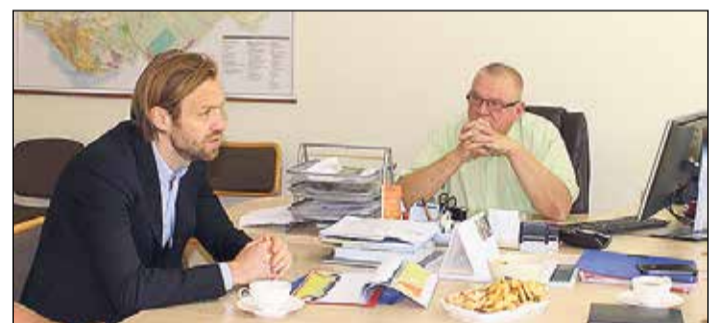
Pārrunājot Ikšķilē plānoto sporta halles un baseina būvniecību.