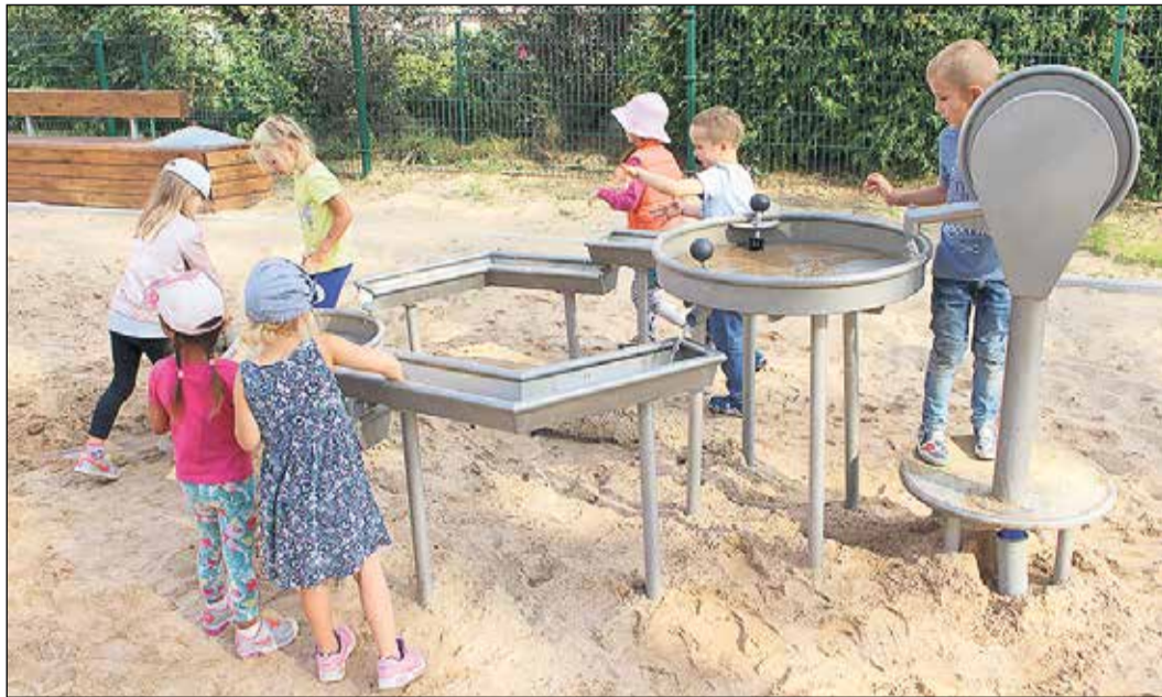
Parkā bērniem sarūpētas ūdens atrakcijas.

11. septembrī Ikšķilē, starp daudzdzīvokļu mājām Pārbrauktuves ielā 9A, Melioratoru ielā 12 un Melioratoru ielā 12A, pašvaldība atklāja labiekārtotu atpūtas parku – „Minku parks”.