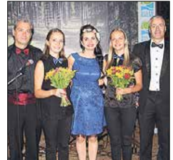
Skatītājus priecē Pārdaugavas kameramūziķi no Rīgas.

Pasākumu organizēja Ogres un Ikšķiles novada pašvaldību aģentūra „Tūrisma, sporta un atpūtas kompleksa „Zilie kalni” attīstības aģentūra”.