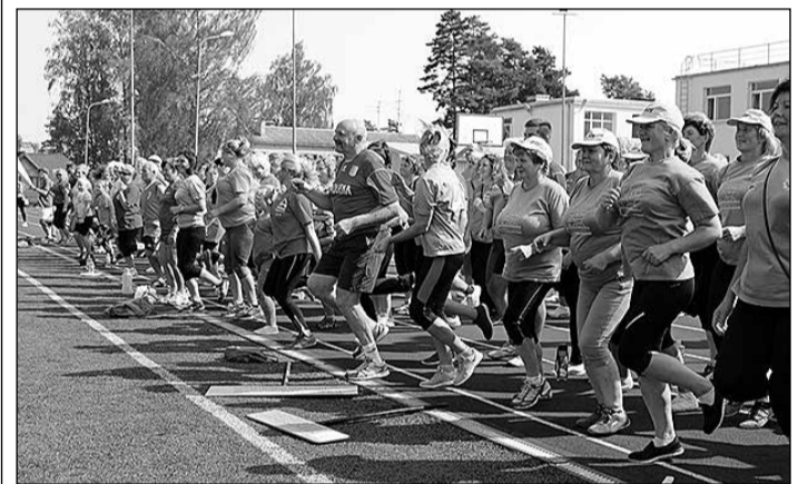
Sporta spēlēs piedalījās vairāk nekā 300 pedagogu.

Piektdien, 24. augustā, Ikšķiles vidusskolas stadionu piepildīja skolotāji – sportisti, kuri piedalījās nu jau par tradīciju kļuvsās Starpnovadu skolotāju sporta spēlēs.