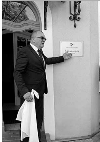
Plāksnes ar uzrakstu „Tinužu sākumskola „Muižiņa” atklāšana.