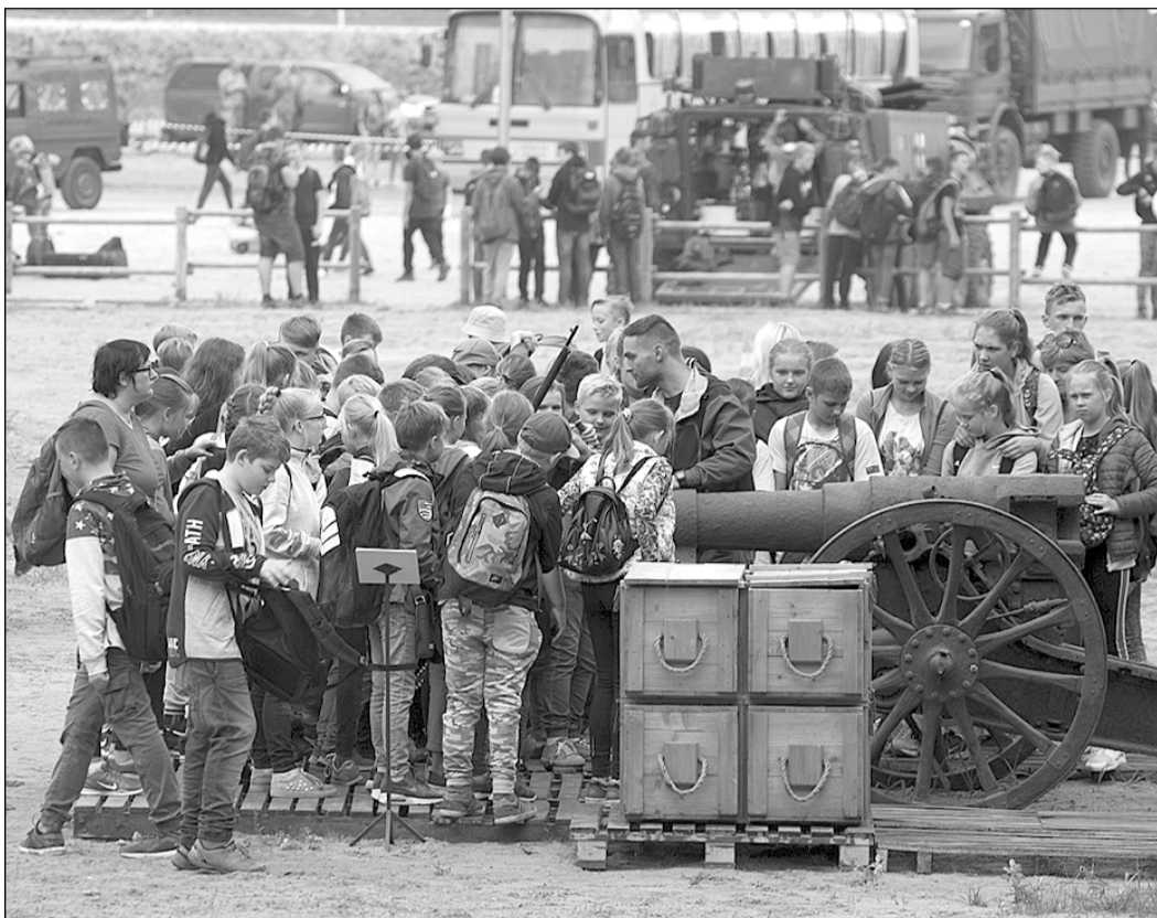
Skolēni pulcējas pie Ikšķiles novada kultūras mantojuma centra „Tinūžu muiža” eksponātiem.

Pēc tam skolēni piedalījās informatīvi izziņošās aktivitātēs. Nacionālo bruņoto spēku Militārās policijas, Sauszemes spēku Mehanizētās kājnieku brigādes un NATO paplašinātās klātbūtnes Latvijā kaujas grupas karavīri demonstrēja militāro tehniku un ekipējumu, Gaisa spēku helikopters „Mi-17” veica meklēšanas un glābšanas operācijas paraugdemonstrējumus. Savukārt Zemesardzes 54. Inženiertehniskais bataljons sniedza iespēju skolē-