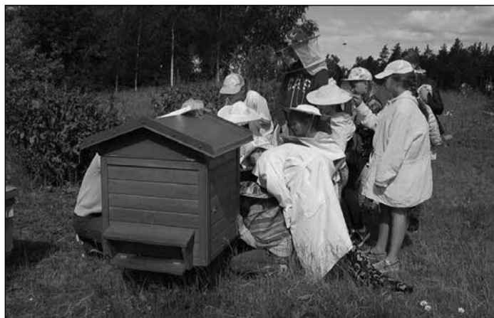
Bērni izzina bišu dzīves noslēpumus.