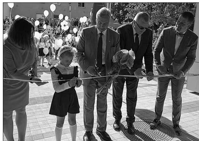
Lenti griež arī izglītības un zinātnes ministrs Kārlis Šadurskis (vidū).

Projekta Nr. 8.1.2.0/17/1/007 „Ikšķiles vidusskolas pārbūve” īstenošanai pašvaldība radusi iespēju piesaistīt Eiropas Reģio-