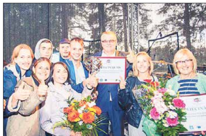
Jaunieši un pašvaldības pārstāvji priecājas par sasniegto.

„Latvijas Jauniešu galvaspilsēta 2019” – Ikšķiles un Olaines novadu apvienība