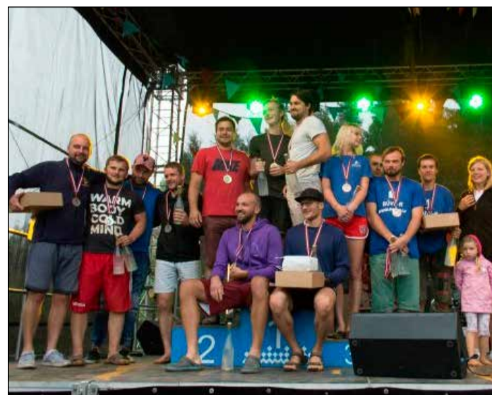
Pludmales futbolā godalgotās vietas izcīnīja komandas „Ortoze” (1. vieta), FK „Nora” (2. vieta) un „Būve R” (3. vieta).