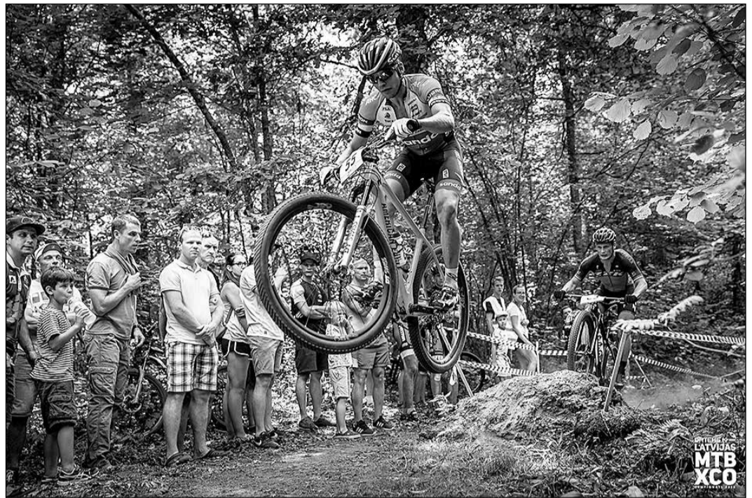
Pirmo reizi Latvijas čempionāts MTB XCO krosā norisinājās Ogres Zilajos kalnos.