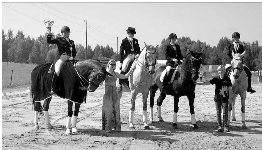
Iejāde ir graciozākā jāšanas sporta disciplīna, kas prasa lielu darbu, pacietību un mērķtiecību.

22. jūlijā, kā jau katru gadu, Ikšķiles novada Tinūžu pagasta „Birzītēs” norisinājās interešu kluba „Green horse” kauss iejādē, uz kuru bija ieradušies 48 dalībnieki gan no Ikšķiles novada, gan kaimiņu novadiem, lai parādītu savas un zirgu spējas dažādās grūtības pakāpes shēmās. Interesu kluba „Green horse” godu aizstāvēja deviņi sportisti, to skaitā trīs bērni.