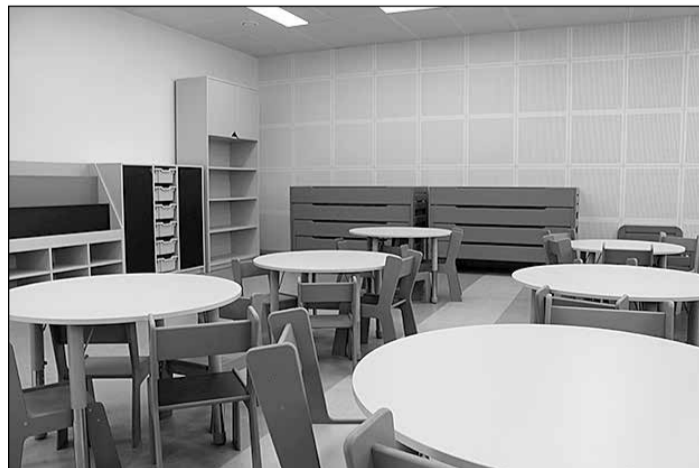
Nodarbību telpas aprīkotas ar jaunām un ērtām mēbelēm.