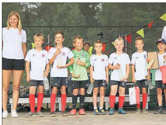
BSSC „Ikšķile” jaunie futbolisti (2009. gadā dzimušie).