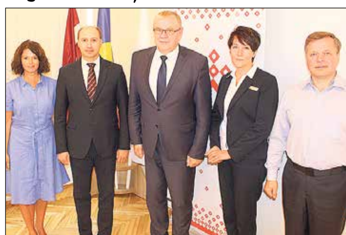
Moldovas vēstnieks (otrais no kreisās) viesojas Ikšķiles novada pašvaldībā.