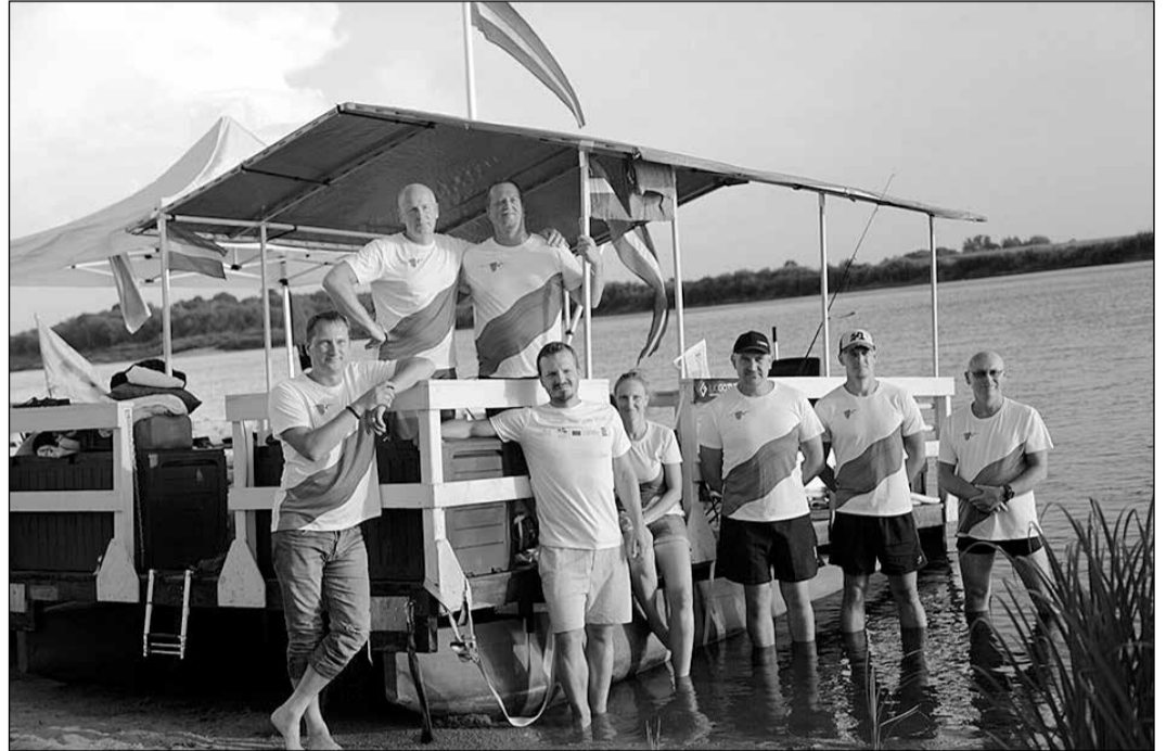
Ekspedīcijas dalībnieki Ikšķiles krastā.

Pēc braucienā pieredzētā vides eksperti secina, ka Daugava ir droši laivojama, gleznainie dabas skati šim maršrutam piešķir īpašu vērtību, taču upes ūdenstūrisma potenciāls nav izmantots pilnībā, un būtiski jāuzlabo vides pieejamība. Blīvāk apdzīvotās vietās Daugavas krasti ir izkoptāki un ērtāk pieejami laivotājiem, taču upes lielākajā daļā pietāt un izkāpt ir ļoti sarežģīti vai pat praktiski neiespējami. Tāpat abos krastos atrodas daudz interesantu apskates un atpūtas vietu, taču nav nedz informatīvu no-