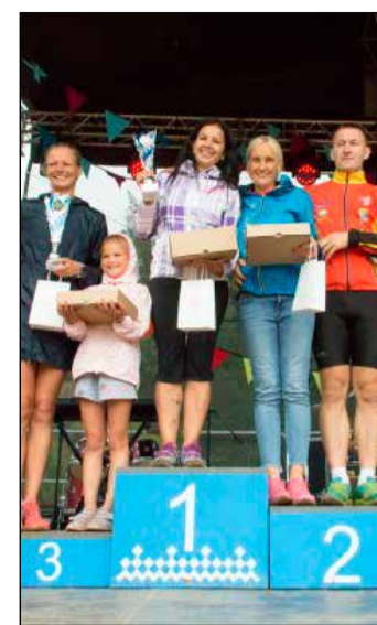
Ģimeņu orientēšanās sacensībās 1. vietā ierindojās „Čiekuriņš”, 2. vietā – „Opalie”, 3. vietā – „Pauriņi”.