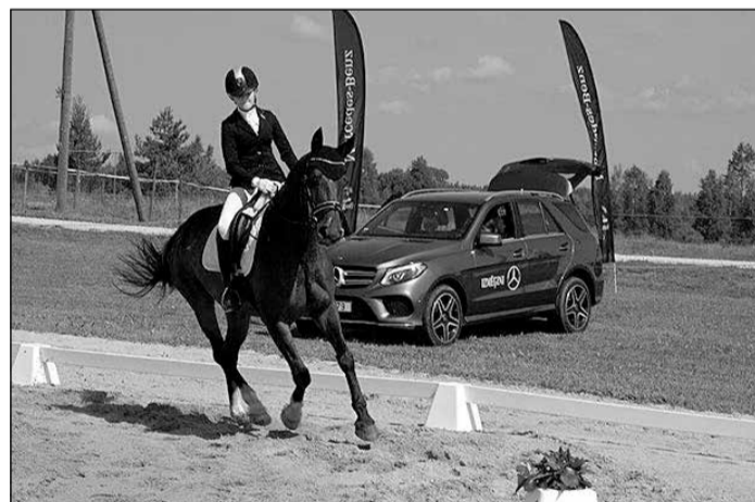
Jārodas iespaidam, ka zirgs visu dara pats.

Sacensības noslēdza jaunākie dalībnieki, izpildot shēmu Nr. 0, par to saņemot tiesnešu vērtējumus, medaļas, rozetes un piemiņas balvas no atbalstītājiem. Šajā