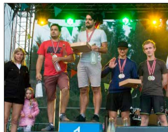
Spaikbolā uzvarēja komanda „Luidži un Mario”, otro vietu izcīnīja „Bunduli”, bet trešo – komanda „Jā”.