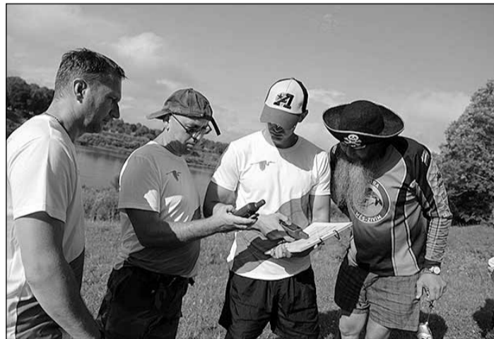
Ikdienu ievieš savas korekcijas ekspedīcijas plānā.

Projektu atbalsta Zemkopības ministrija un Lauku atbalsta dienests, finansē – Eiropas Lauksaimniecības Fonds lauku attīstībai.