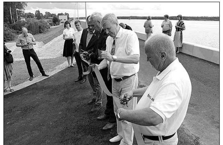
Svinīgais atklāšanas brīdis.