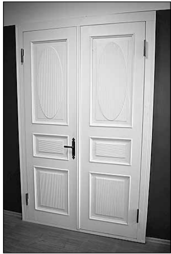
Atjaunotās Tinūžu muižas durvju vērtnes. Kultūras mantojuma centrs „Tinūžu muiža”. 2018. gads.

2017. gadā Ikšķiles novadā tika uzsākta vēstures talka, kuras uzdevums ir aicināt iedzīvotājus palīdzēt apzināt pagātnes vērtības, lai tās saglabātu un padarītu pieejamas sabiedrībai. 2018. gadā kultūras mantojuma centram „Tinūžu muiža” ir paredzēti vairāki projekti, lai pievērstu sabiedrības uzmanību Latvijas kultūras mantojuma stāvoklim un veicinātu tā saglabāšanu. Katru mēnesi laikrakstā „Ikšķiles Vēstis” tiek publicēts raksts par kādu senu lietu, kas apzināta no 2012. gada un kas ļauj iepazīt Ikšķiles novadu un tā cilvēkus.