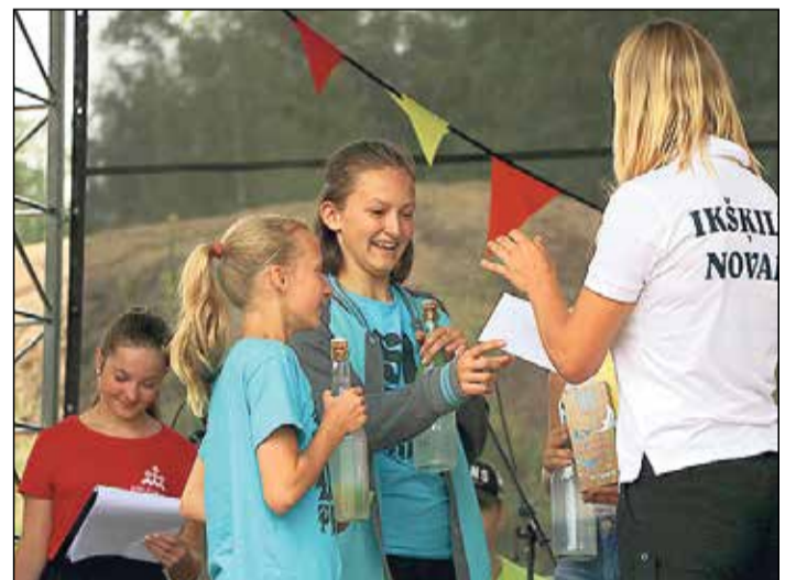
Komandas „Slidotprieks” pārstāves.