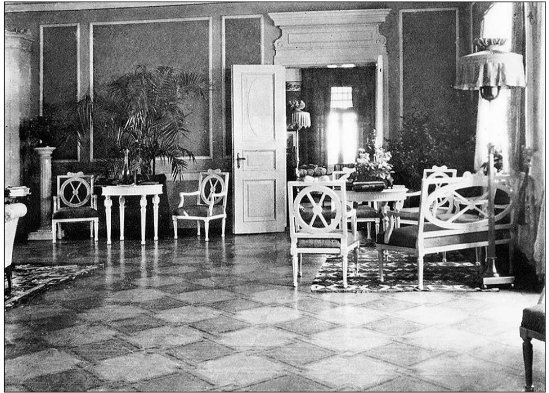
Tinūžu muižas kungu mājas interjers. Tinūži. 19. gadsimta beigas, 20. gadsimta sākums.

daļēji zudušām eņģēm, liecināja, ka to izcelsme ir saistīta ar pavisam citu ēku. Nebija šaubu, ka durvis varēja atrasties plašā telpā ar augstiem griestiem un izsmalcinātu interjeru. Tās funkcionāli nevarēja būt izmantotas lauku saimniecībā. Tātad durvju vērtnes atvestas no citas ēkas un izmantotas praktiskiem nolūkiem. Pirmā doma, protams, tika saistīta ar apkārtnes muižu apbūvi. Latvijas vēsturē daudzas pils un muižas ir tikušas nojauktas, izlaupītas, izsaimniekotas arī ar mērķi iegūt būvmateriālus jaunu ēku celtniecībai. Mūsdienās nereti tiek atrasts muižu vai baznīcu inventārs apkārtnes mājās. Latvijā cilvēki ir praktiski, un bieži tas ir bijis galvenais priekšnoteikums, lai vērtības tiktu ne tikai