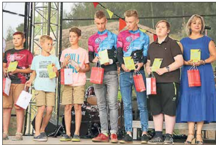
Atzinības balvas saņēmēji zēnu konkurencē.