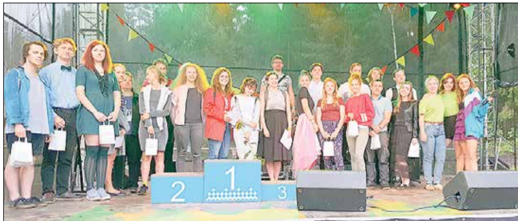
Konkursa „Gaisa trīce” dalībnieki.

„Katra konkursa būtiskākais ieguvums ir jauna pieredze profesionālajā jomā. Protams, esmu ļoti priecīga par uzvaru un galveno balvu. Īpaša nozīme ir tam, ka esmu uzvarējusi konkursā pašu mājās,” pēc apbalvošanas