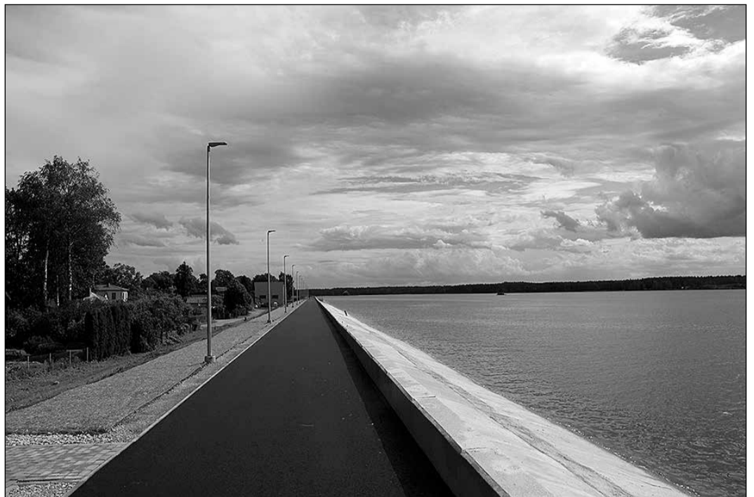
Ikšķīlieši ieguvuši skaistu pastaigu vietu.

Aizsargdambja atjaunošanas būvdarbu laikā no 2017. gada maija līdz 2018. gada augustam ir veikta dzelzsbetona plātņu atjaunošana, veicot betonēšanu uz aizsargdambja slāpās nogāzes 30 000 m 2 platībā, veikts parapešu remonts un deformācijas šuvju atjaunošana, atjaunots apgaismojums uz aizsargdambja, atjaunots gājēju un velobraucēju celiņš uz dambja virsas. Lai nodrošinātu vides pieejamību, izbūvēti trīs serpentinu un kāpnes katras ielas galā, kas savienojas ar aizsargdambi, veikta dambja virsas apzaļumošana un labiekārtošana.