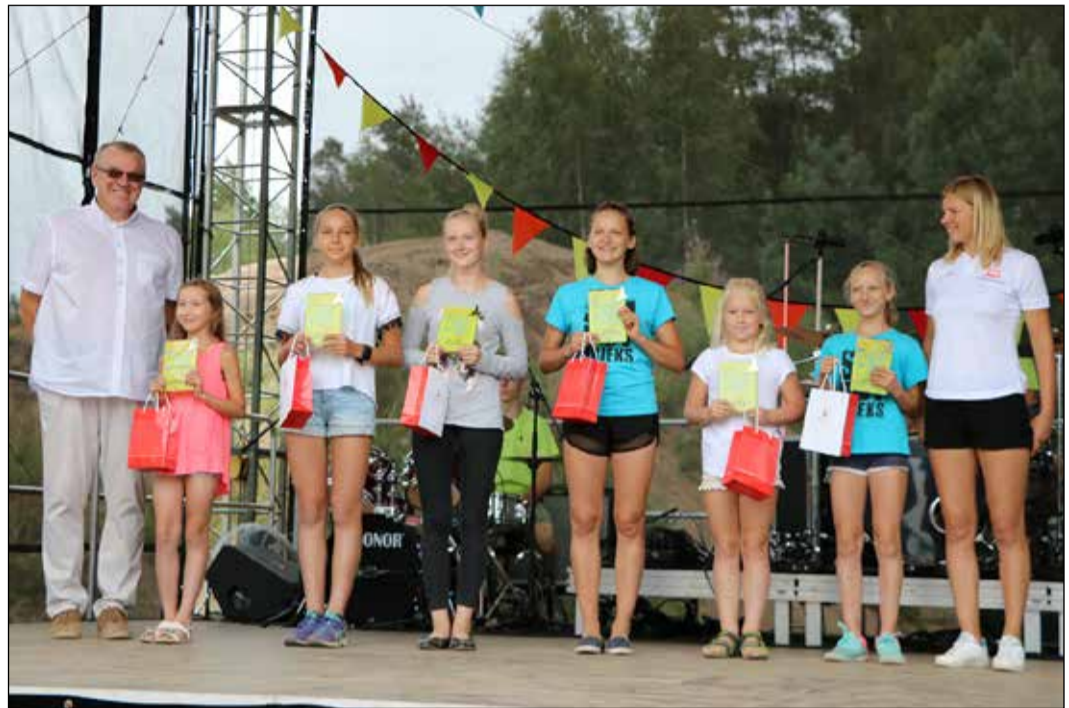
Atzinības balvas saņēmējas.

Nominācijā „Bērnu un jauniešu sporta komanda” tika pieteikta komanda, kurai ir ne tikai sportiskie sasniegumi, bet tā sniegusi arī savu palīdzību un atbalstu Ikšķiles novada pašvaldībai vairākos pasākumos. Piemēram, komandas audzēkņi ir piedalījušies Sniega dienas pasākumā, Ikšķiles novada svētkos, kuru ietvaros organizēja sporta aktivitātes, iesaistījās labdarības koncertā „Skatuve ikvienam”, sarūpējot pasākuma dalībniekiem piemiņas veltes. Balvu saņēma daiļslidošanas kluba „Slidotprieks” audzēknes.