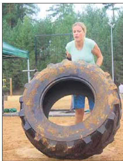
Dalībnieki mēroja spēkiem arī netradicionālās disciplīnās.