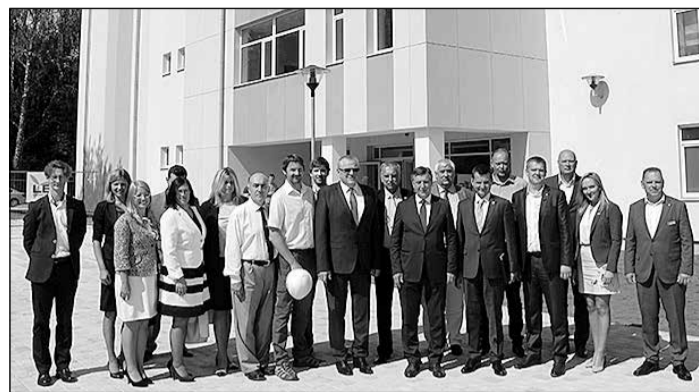
Ministru prezidents un pašvaldības pārstāvji apmeklējot Ikšķīles vidusskolas jauno piebūvi.

Vizītes akcents bija tieši izglītības sfēras reorganizācijas darbi. Tāpēc klātienē tika apmeklēta Ikšķīles vidusskola, kur noslēgumam tuvojas sākumskolas korpusa būvniecība. Skola iegūs jaunas telpas ar 16 mācību kabinetiem, konferenču un treniņu zāli, kuras visas tiks aprīkotas ar jaunāko tehnoloģiju risinājumiem, lai mācību process būtu viegls, ērts un patīkams.