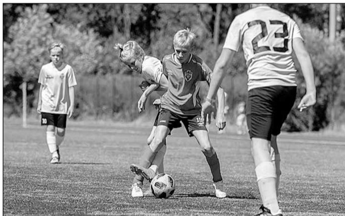
Jau pirmajā spēlē mūsu puīši parādīja, ka nebūs ar pliku roku ņemami.

Paldies Jums par šīm spēlēm, par uzvarām un emocijām!