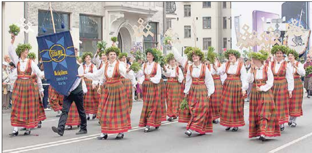
Mūsu kolektīvi dodas Dziesmu svētku dalībnieku gājienā.

› 1. lpp. celes, lai beigās pa Piena Ceļu atgrieztos mājās. Katrā no koncerta lokiem bija ietvertas laika griežu liktenīgās dziesmas – latviešu