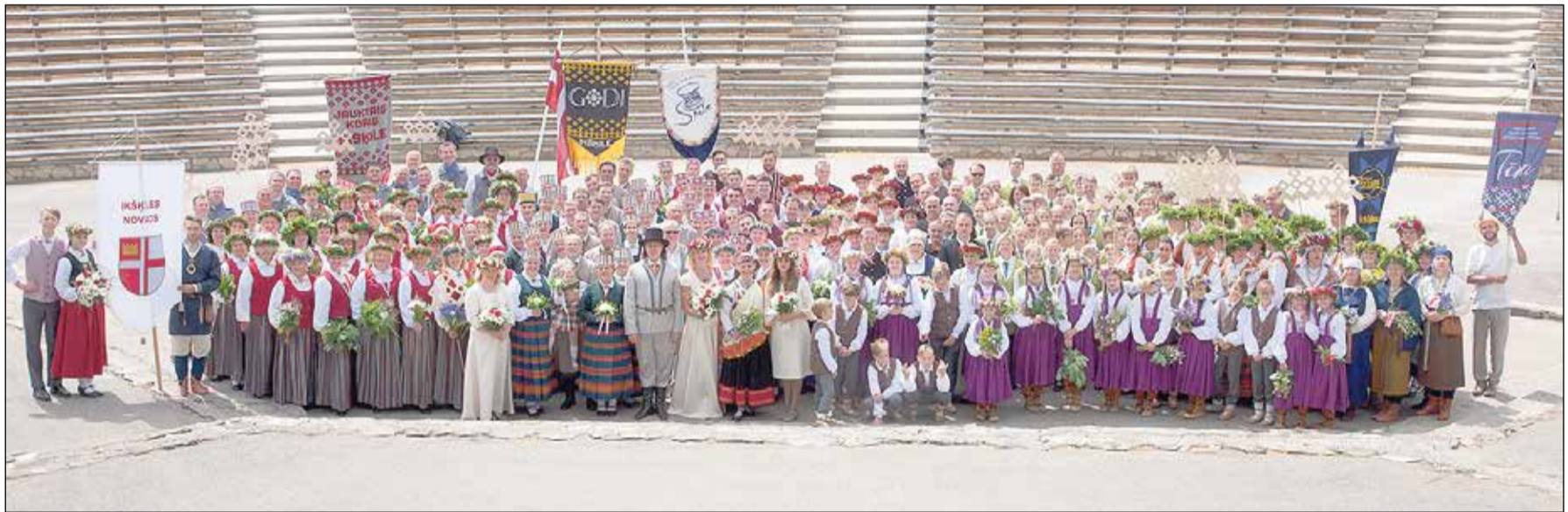
Ikšķiles estrādē pirms došanās uz Dziesmu un deju svētkiem.

Ar svētku kulminācijas pasākumiem – deju lieluzvedumu „Māras zeme” un noslēguma koncertu „Zvaigžņu ceļā” noslēdzās XXVI Vispārējo latviešu Dziesmu un XVI Deju svētki.