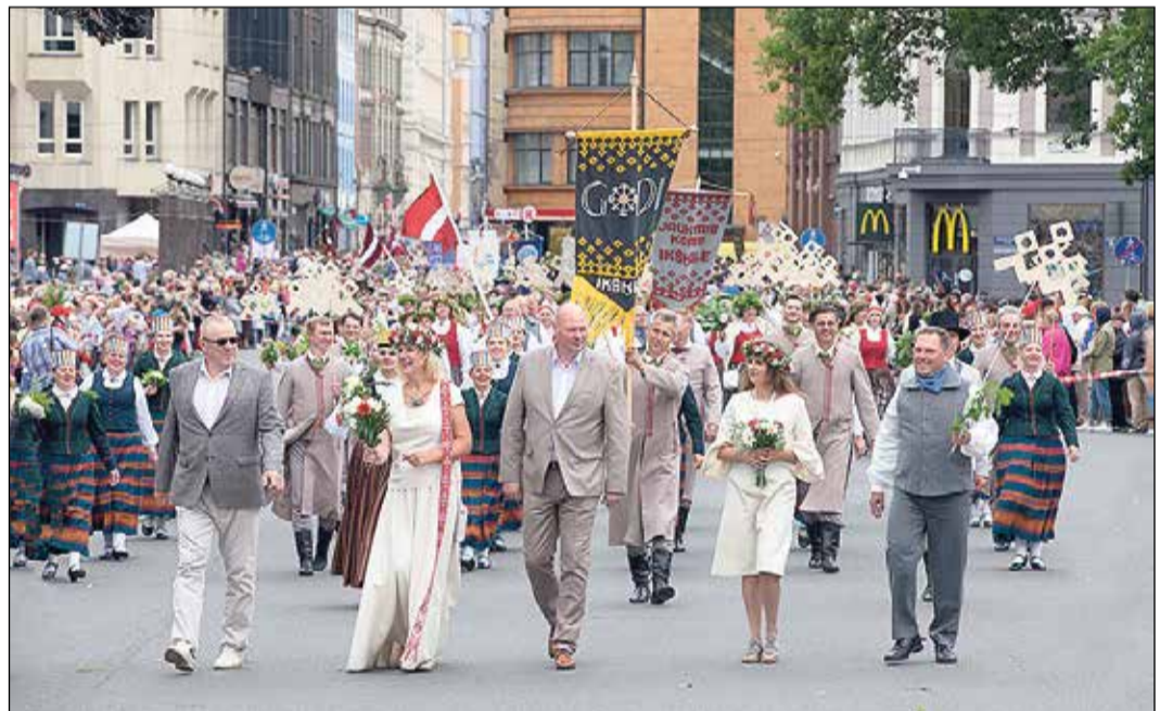
Ikšķiles novada pašvaldības vadība svētku gājienā.