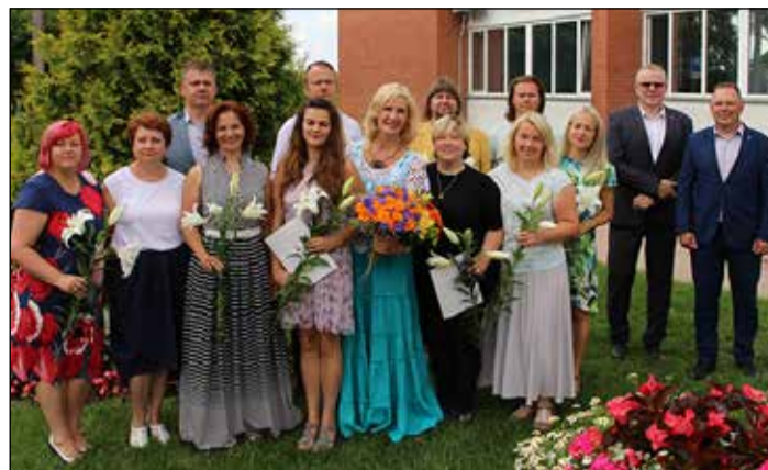
Pašvaldība pateicas amatiermākslas kolektīvu vadītājiem un kultūras iestāžu dalībniekiem.