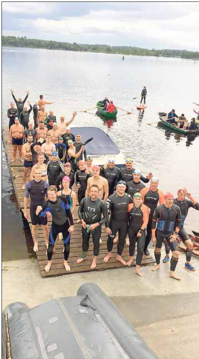
Peldējumā pāri Daugavai šoreiz vairāk nekā 40 dalībnieku.