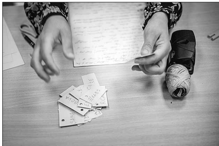
Radošajās darbnīcās tapa ikdienā noderīgas lietas.

radošiem pasākumiem un aicinājumu atgriezties Ikšķilē ar interesantām domām, idejām un pasākumiem.