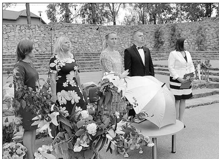
Skolas un pašvaldības vadība.