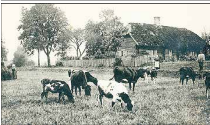
Viena no „Akermanu albumu” fotogrāfijām, kur redzama kāda no Ikšķiles apkārtnes saimniecībām. 20. gs. sākums.

jos apkopotas fotogrāfijas, kur redzami apkārtnes skati un cilvēku sadzīve. Diemžēl albumi nav pilnīgi un ir liels fotogrāfiju trūkums, par kuru atrašanās vietu ziņu nav. Albumu vērtību veido nevis atsevišķas fotogrāfijas, bet gan vairāku albumu kopums, kur dzimtas locekļi ir dokumentējuši vidi ap viņiem laika posmā no 20. gs. paša sākuma līdz pat 20. gs. 50. gadiem.