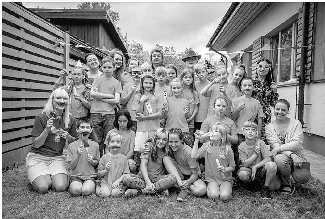
Nometne aizvadīta jautrā un radošā noskaņojumā.

Nometnes organizēšana ir vesela gada darbs, kurā līdzās