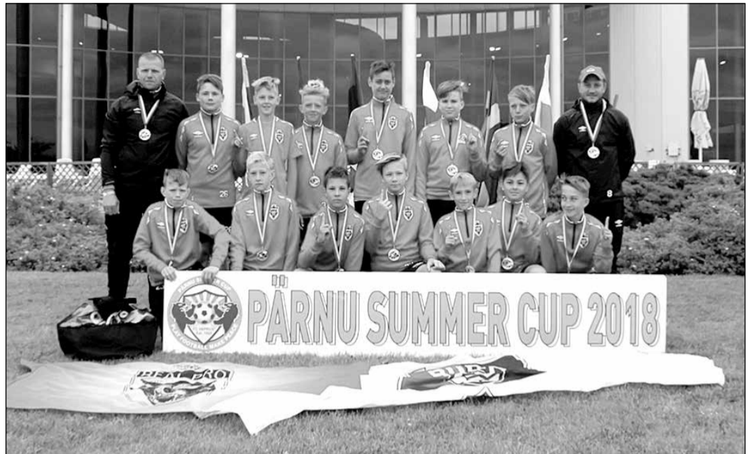
Mājās pārvestas zelta un sudraba godalgas.

Pretī stājās kārtējā Igaunijas komanda no Tallinas – „Nõmme