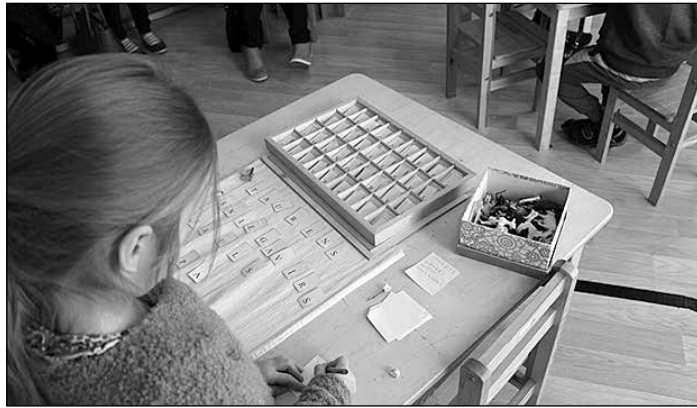
Montesori metode ir vērsta uz katra bērna individuālajām vajadzībām.

PII „Urdaviņa” dalījās pieredzē par tēmu „Kompetenču pieeja mācību saturā”, kas saistīta ar valsti īstenoto Valsts izglītības satura centra izglītības satura reformas projektu, kurā kā pilotskola piedalās arī PII „Urdaviņa”. Semināra ietvaros bērnodarza darbinieki dalījās savā pieredzē, kā mācību procesa organizēšanā aktivizēt caurviju prasmi – sadarbība un līdzdalība. Tās ieviešanas mērķis ir vērsts uz bērnu prasmi mācīties, savstarpēji sadarbojoties un darbojoties kā atbildīgiem sabiedrības locekļiem. Pedagogiem tika piedāvāta iespēja vērot atklātās