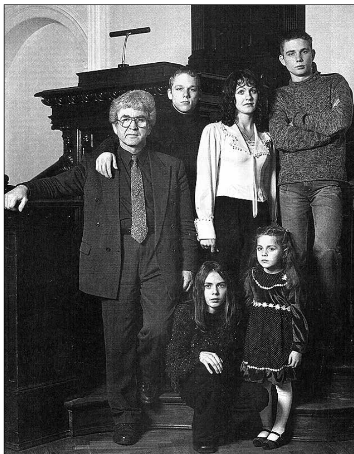
Ar bērniem un mazbērniem. 1999. gads.