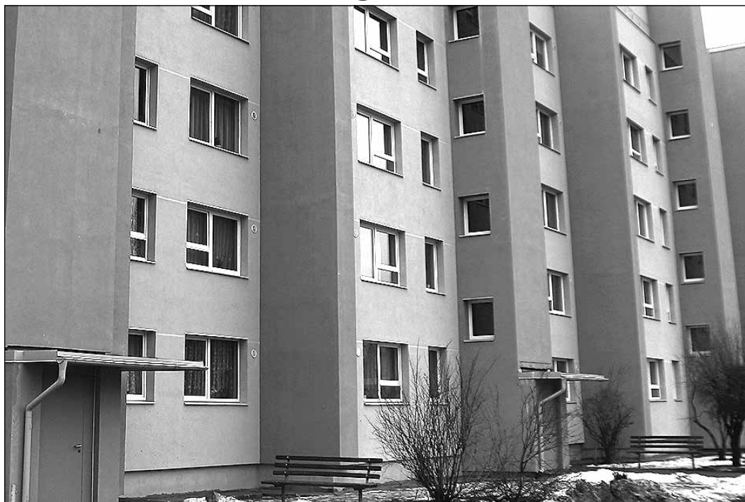
Veikti energoefektivitātes paaugstināšanas pasākumi daudzdzīvokļu dzīvojamās mājās Ikšķilē, Skolas ielā 7 un Skolas ielā 13.

Ikšķiles novada pašvaldība, pamatojoties uz 2017. gada 26. jūlijā pieņemto pašvaldības domes lēmumu par līdzfinansējuma nodrošināšanu projektam „Ikšķiles ūdenssaimniecības attīstības II kārtā”, paredz ņemt aizņēmumu Valsts kasē ar atmaksas periodu 20 gadi. Projekta līdzfinansējumu pašvaldība ieguldīs SIA „Ikšķiles māja” pamatkapitālā, tādējādi nodrošinot uzņēmumam nepieciešamos finanšu līdzekļus projekta maksājumu veikšanai.