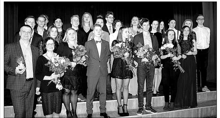
Žetonu vakara dalībnieki.