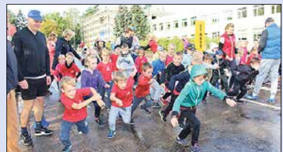
Ikšķilē notika „Olimpiskā diena 2017”.