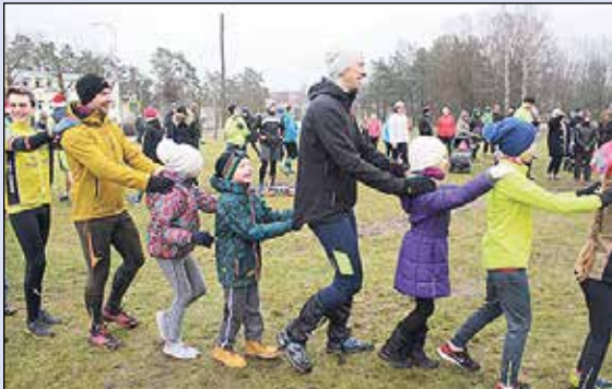
Gadu sākām ar sportiski aktīvu pasākumu „Jauns gads, jauna apņemšanās”.