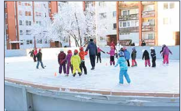
Ikšķilē sāka darboties publiskā slidotava. Te notiek arī Ikšķiles skolēnu sporta stundas.