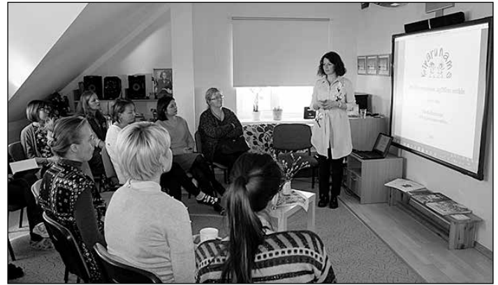
Bērnodarza darbinieki dalījās savā pieredzē, kā mācību procesa organizēšanā aktivizēt caurviju prasmi.

ču pieeju tiek strādāts jau deviņus gadus: „Lasot jauno kompetenču pieejas programmu izglītībā, pārliecināsim, ka mēs ikdienā jau to īstenojam. Montesori metode ir vērsta uz katra bērna individuālajām vajadzībām, cieņpilnu attieksmi pret bērnu. Šajā procesā pedagogs ir tikai kā palīgs, nevis tas, kurš nosaka, kas jā dara.” Pateicoties šai metodikai, bērns var pats izvēlēties materiālus un nodarbes atbilstoši savam interesēm un sensitīvajam periodam, kuram viņš ir gatavs. Pēc atklātajām nodarbībām Reikmanes