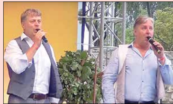
Latvijas dziedājošo aktieru salidojums.