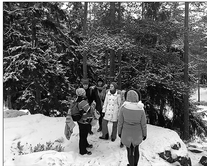
Skolēni apgūstamo tēmu nostiprināja, ejot dabā.

„Somijas brauciens paliks prātā, pirmkārt, ar mieru. Lai gan apkārt aktīvi notiek dzīve, pieaugušie un bērni ir iekšēji ļoti mierīgi. Neviens netiek steidzināts apgūstamajā tēmā, ir dots laiks to izprast un izpētīt. Bērnu veiksmīgā-