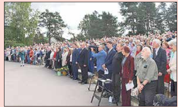
Latvijas politiski represēto salidojumā viesojas Valsts prezidents.