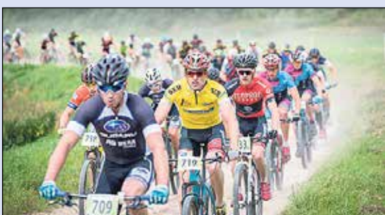
SEB MTB maratona Ikšķiles posmā aizraujošas trases un spriedze kopvērtējumā.