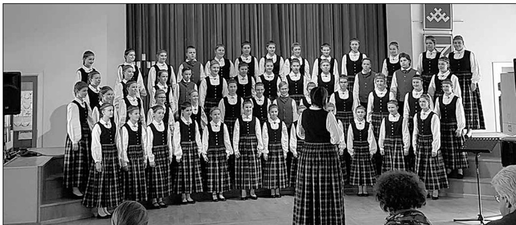
Ikšķiles vidusskolas 2.–4. klašu koris iegūst I pakāpi.

6. martā Ķekavā notika starpnovadu kora skate. Tajā piedalījās arī skolu kori no Ikšķiles vidusskolas.