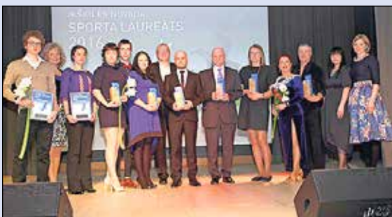
Pasniegtas „Sporta laureāts 2016” balvas.