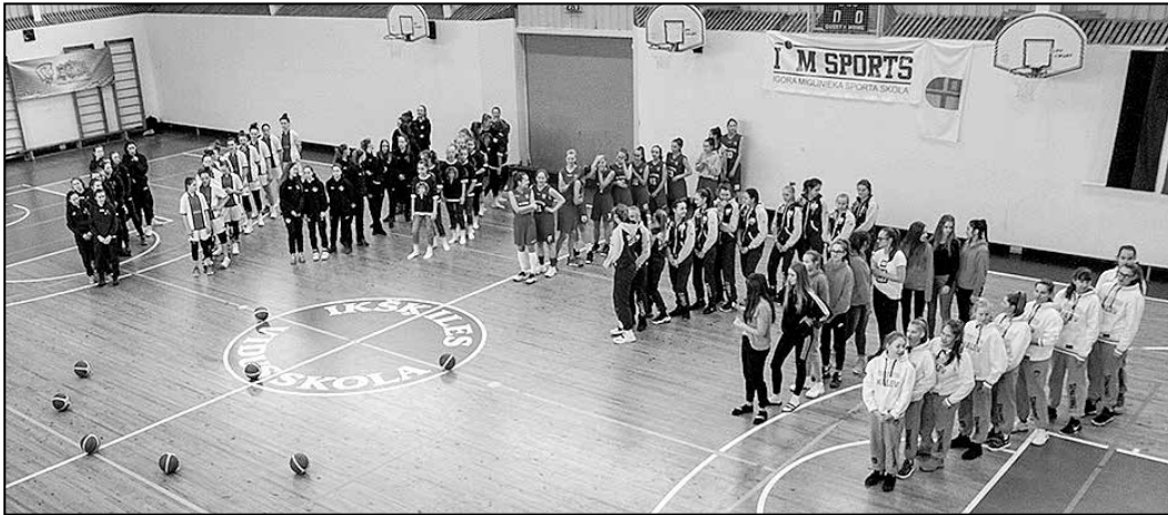
Šosezon Igora Miglinieka sporta skolas komanda startēja Eiropas līgas U-15 vecuma grupā.

No 2. līdz 4. martam Igora Miglinieka sporta skolas meiteņu komanda ieguva augsto 5. vietu Eiropas meiteņu basketbola līgā, kuras trešais posms norisinājās Ikšķilē.