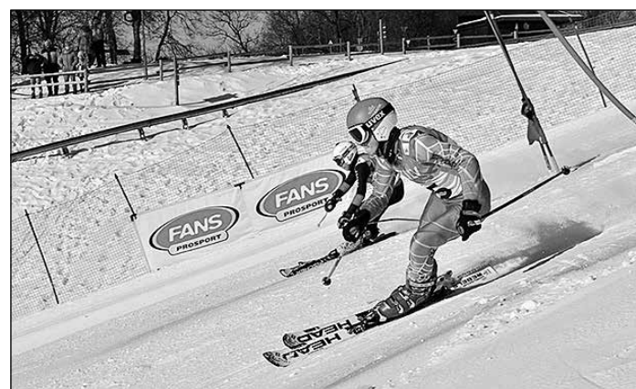
Spraiga ciņa par sekundes simtdaļām.