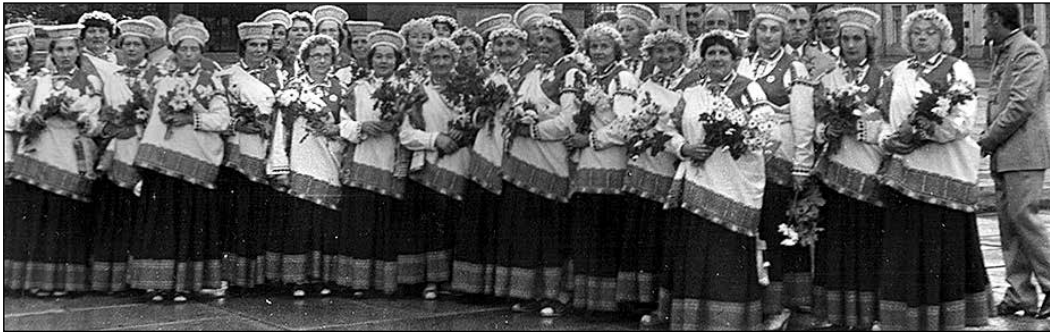
Kolhoza „Juglas zieds” jauktais koris. 1981. gads.