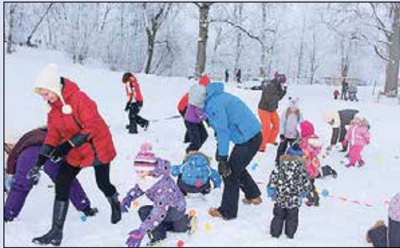
Ikšķiles novadā aizvadīta Sniega diena.