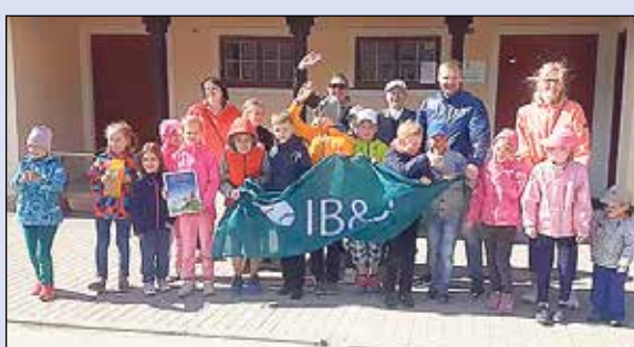
Pirmoreiz godinām novada bērnu un jauniešu sporta laureātus.