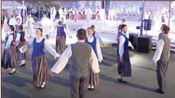
Ikšķiles estrādē un Ozoliņa parkā nosvinēti Daugavas svētki „Vārdi Daugavai un manam laikam”.