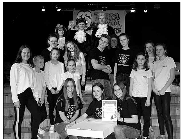
Reģionālā Daugavkrastu teātra sporta turnīra dalībnieki.