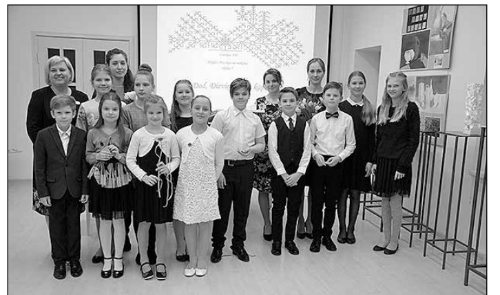
Audzēkņi un pedagogi pēc koncerta.