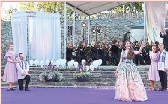
Notika otrais Starptautiskais Operetes festivāls.

Ar bagātīgu programmu nosvinēti Ikšķiles novada svētki.