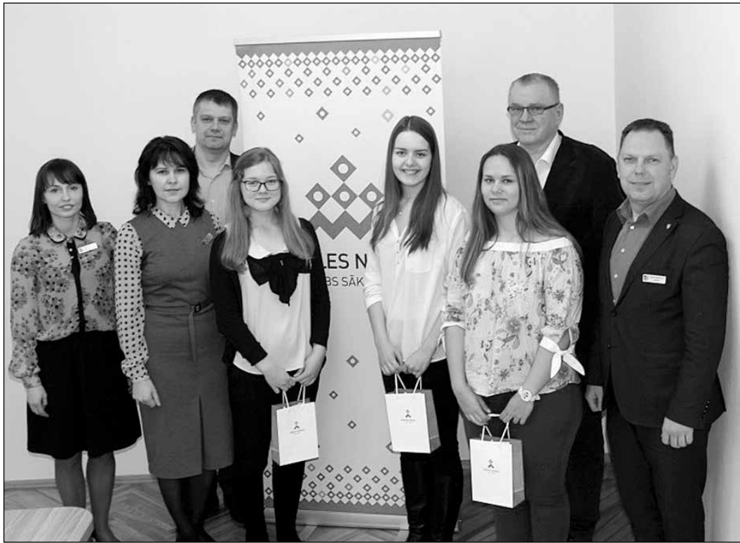
Ikšķiles novada pašvaldībā viesojās trīs Ikšķiles vidusskolas audzēknes.

14. februārī Ikšķiles novada pašvaldība jau septīto gadu piedalījās Ēnu dienā. Tās ietvaros pašvaldībā viesojās trīs skolnieces, izmantojot iespēju aktīvi sekot līdzī speciālistu darbam.