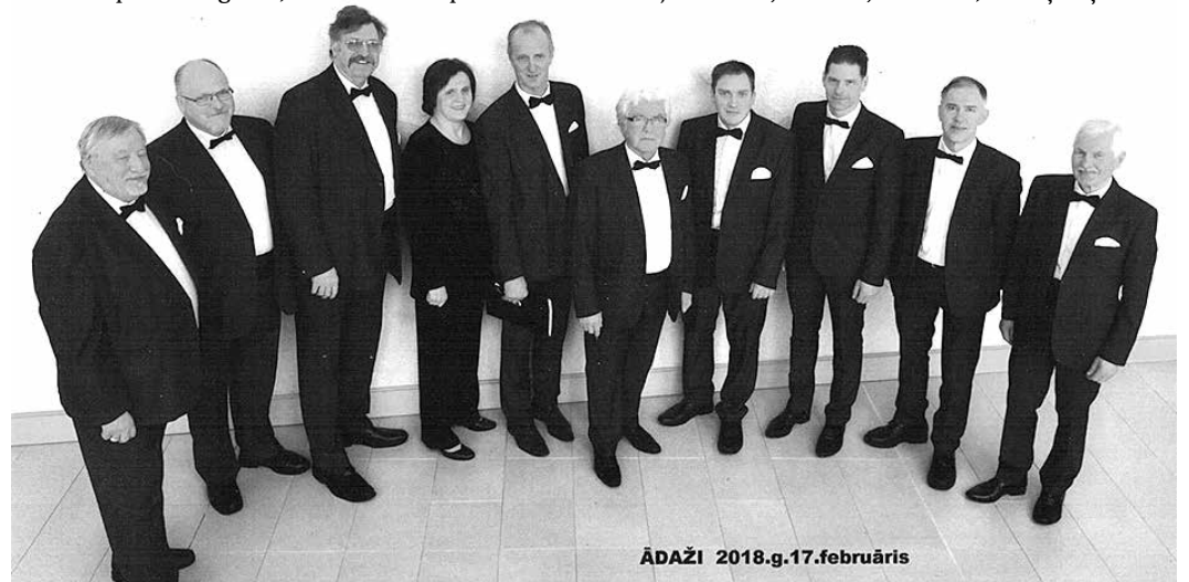
Viru vokālais ansamblis „Tikai tā”.