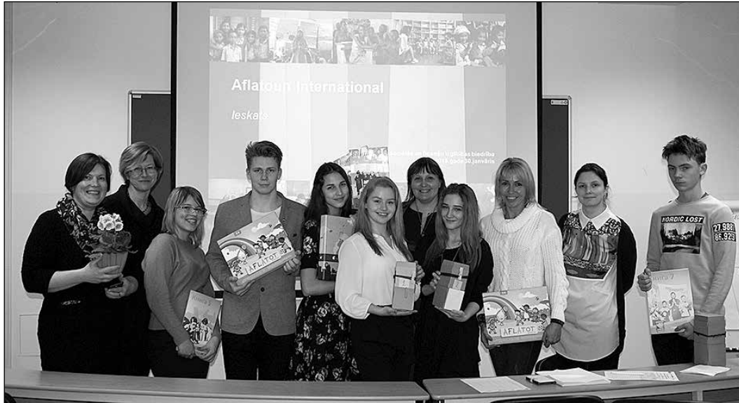
Ikšķiles vidusskolas kreatīvās domāšanas grupa.

Šā gada 15. februārī 9.–12. klašu skolēniem tika prezentēts pētījums „Vērtīga mācīšanās”. To organizēja Ikšķiles vidusskolas kreatīvās domāšanas pulciņa dalībnieki, kuri šobrīd jau ar gandarījumu sevi dēvē par kreatīvās domāšanas grupu „LI7”.