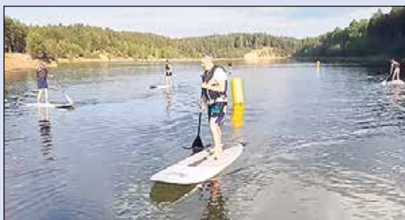
Novada svētkos daudz sportisku aktivitāšu.