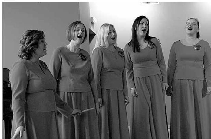
Vokālie ansambļi konkursā izpildīja trīs dziesmas.

Paldies ansambļu dalībniekiem un vadītājiem par ieguldīto darbu!