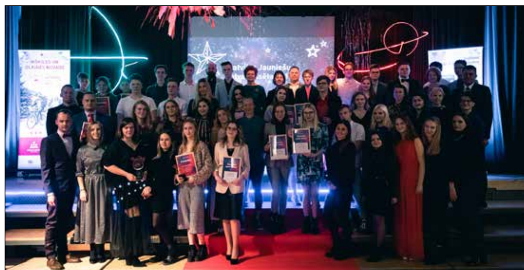
Olaines novada aktīvākie jaunieši un pašvaldību pārstāvji.