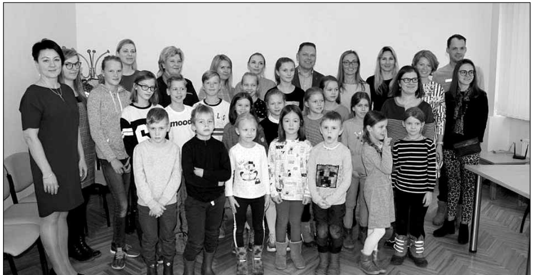
Ekoskolu audzēkņi viesojas pašvaldībā.