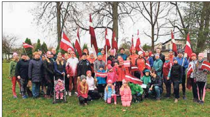
Skrējiena dalībnieki gatavi startam.

Pēc kopīgi nodziedātās Latvijas valsts himnas visi devās skrējienā pa Ikšķili.