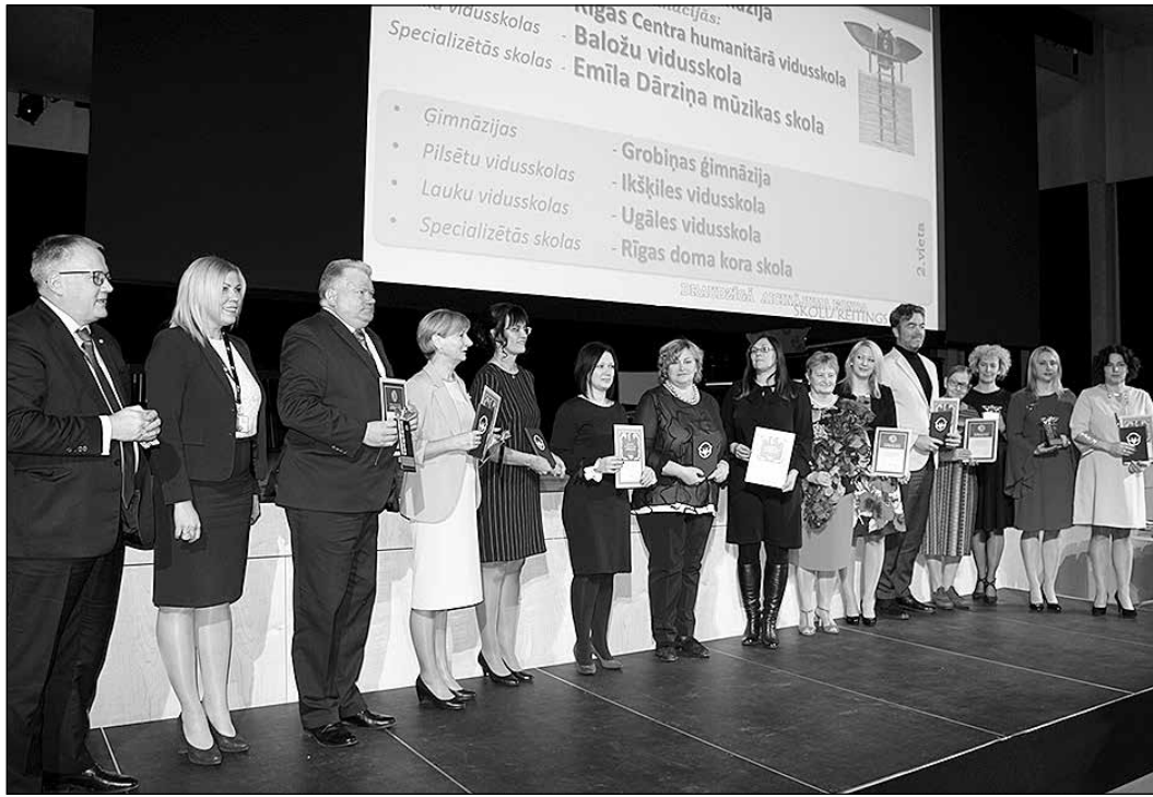
Draudzīgā aicinājuma fonda pārstāvji un Skolu reitinga diplomu saņēmēji.

25. novembrī Latvijas Nacionālās bibliotēkas Ziedoņa zālē norisinājās Draudzīgā aicinājuma (DA) fonda Skolu reitinga apbalvošanas pasākums, kurā jau devīto reizi tika suminātas labākās mācību iestādes.