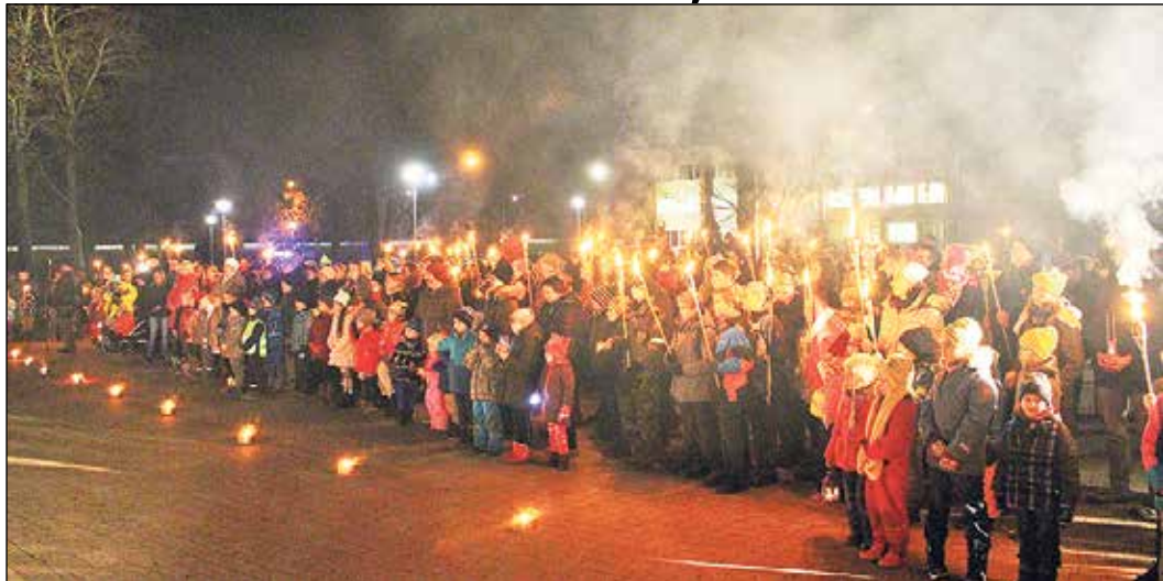
Ozoliņa parku izgaismo novadnieku atnestās lāpas.

11. novembrī visā Ikšķiles novadā plaši tika atzīmēta Lāčplēša diena, kad tika pieminēti ne vien Lāčplēša kara ordeņa kavalieri, bet visi Latvijas brīvības cīnītāji.