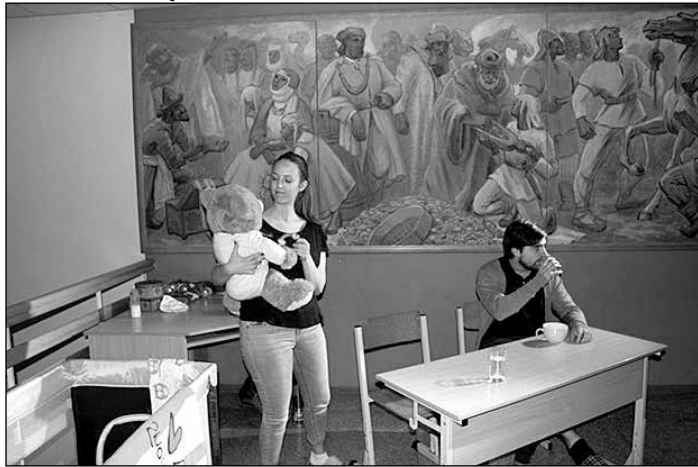
Aktieri dodas ceļojumā pa cilvēka iekšējo pasauli.

7. decembrī Ikšķiles Tautas nama amatiereteātris „Banda” skatītāju un žūrijas vērtējumam piedāvāja izrādi – dokumentālu pastaigu „Ikšķiles cilvēkdārzs”.