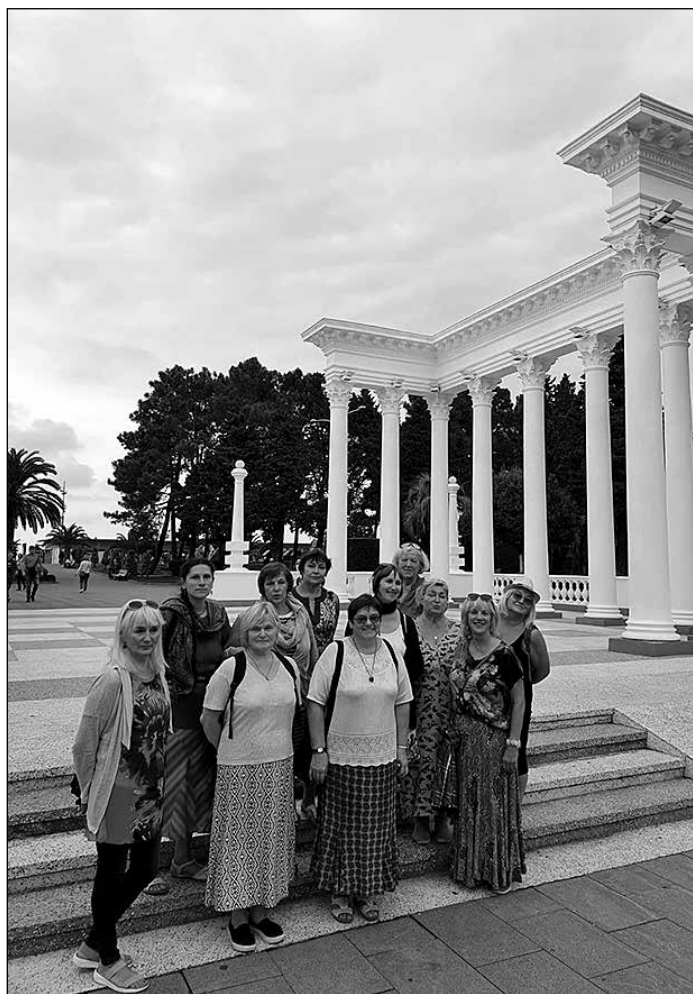
„Saulesmeitas” iepazīst Gruziju.

Kā krāsains kokteilis pagāja nedēļa šajā Austrumu un Rietumu kultūru sadures vietā.