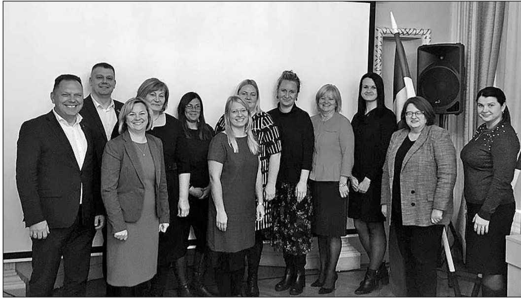
Tikšanās dalībnieki pēc apspriedes par skolu tīkla attīstību.

30. oktobrī Ikšķiles novada pašvaldības pārstāvji un izglītības iestāžu vadītāji Izglītības un zinātnes ministrijā (IZM) apsprieda izglītības iestāžu tīkla attīstību.