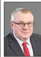
INDULIS TRAPIŅŠ, IKŠKĪLES NOVADA DOMES PRIEKŠSĒDĒTĀJS

Ja mēs gribam, lai mūsu valsts ir stipra, tad mums pašiem arī jābūt stipriem, jābūt spēka pilniem. /K. Ulmanis/