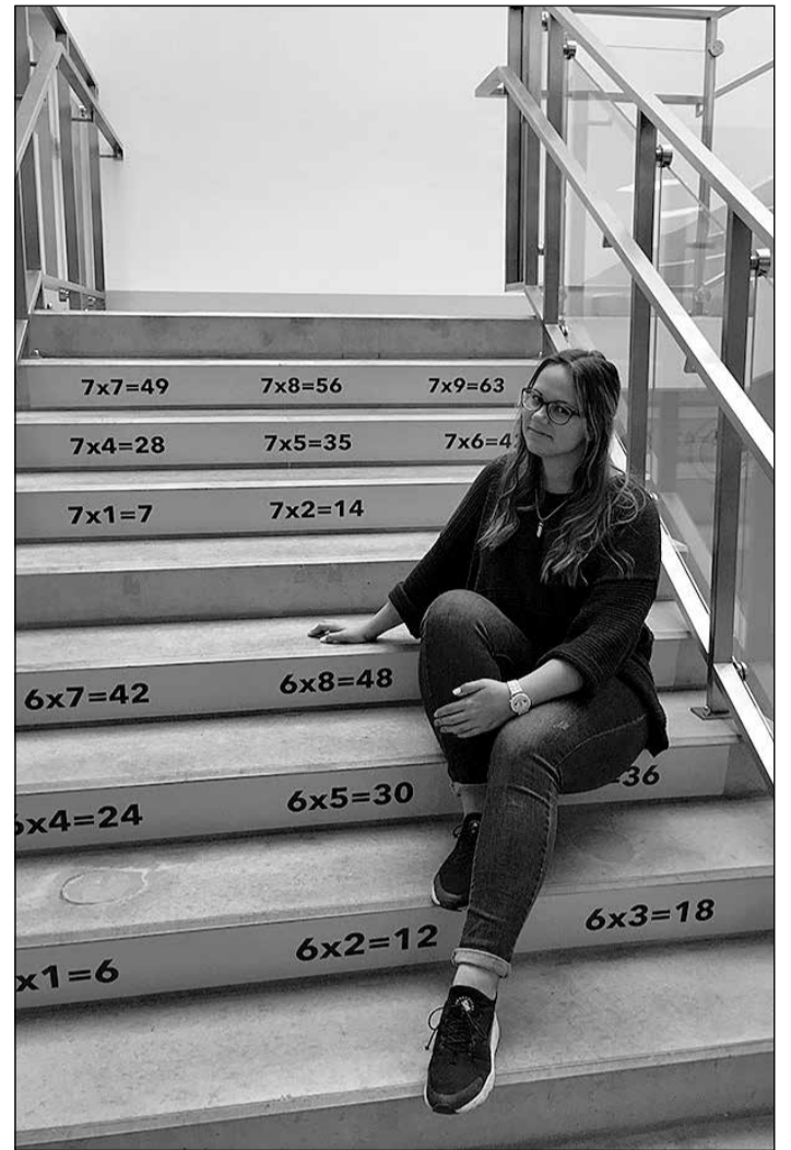
Pie veiksmīgi īstenotā projekta „Bonuss tev” rezultāta.

Es domāju, ka tieši šī emocionālā un iedvesmojošā puse ir ļāvusi daudziem jauniešiem iesaistīties un darboties ne tikai skolas vidē, bet arī novadā. Vēl IK jauniešu projekta ietvaros esmu īstenojusi divus projektus, ko finansējusi Ikšķiles novada pašvaldība. Tas ir mūsu skolas atpūtas stūrītis jauniešiem, kur starpbrīžos un pēc stundām labi pavadīt laiku, un sākumskolā šogad realizēju projektu – reizrēķina atgādnes uz kāpnēm, pakāpieniem, lai mazākie klašu audzēkņi varētu to labāk apgūt. Protams, esam rīkojuši dažādus pasākumus, esam turpinājuši iepriekš iesāktās tradīcijas. Īpaši jauki ir dziedāšanas rīti, jo tiem var pievienoties arī visi tie, kuri nedzied korī vai ansambli. Dažādi, dažādi pasākumi. Man šķiet, ka tieši šis