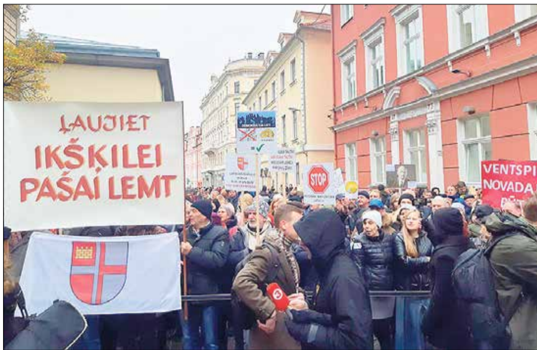
Pie Saeimas pulcējas vairāki tūkstoši protestētāju.

Teritoriālās reformas pretinieki skandēja saukļus „Pūcem nē!”,