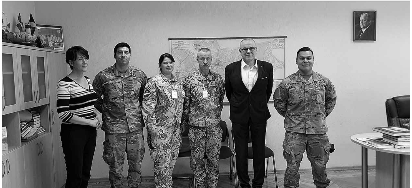
Militāro mācību dalībnieki tiek ar Ikšķiles novada pašvaldības vadību.