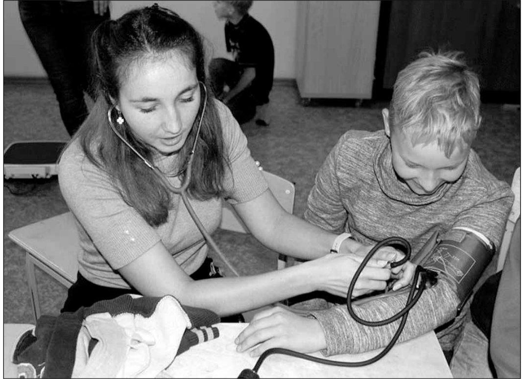
Skolēni mācās mērit asinsspiedienu.

Pasākumu organizēja Latvijas Nieru un multiorgānu aizstājterapijas asociācija.