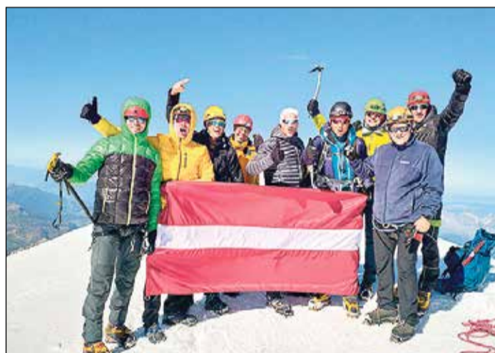
Gandarījums pēc pieveiktā kāpiena – neapraķstāms!

Virsotnē lēnām tuvojas, taču, vērojot to no attāluma, izskatās, ka katrs pacēlums, kas jāveic, ir bistams gājiens pa pašu kori. Taču, esot uz tām, ir skaidrs, ka ir pietiekami vietas, kur spert soļus un pat samainīties ar pretī nākošajiem, un, tā kā esam virvju sasaistē grupās pa trim, vienmēr pietiek laika, lai drošinātu komandas biedru pie nejaušas tuvošanās slīpajām nogāzēm. Vēl pirms pašas virsotnes sasniegšanas skatam paveras visbrīnišķīgākais, ko kalni spēj piedāvāt: saules apspīdētās, mirguļojoši lēzenās nogāzes pāriet stāvākās, un vietām tās pazūd bezdibeni. Un tad tas notiek, soļi, kas mūs uznesuši pašā virsotnē, ir kļuvuši lēnāki un smagāki, un mēs izbaudām katru metru, saaugot ar vareno kalnu, kas tagad plešas augstu pāri citiem tuvākajiem brāļiem. Esam Monblāna pašā virsotnē 4810 metru virs jūras līmeņa. Sajūsmā apskaujam cits citu, sveicinām citus virsotni sasniegušos, staigājam šurpu turpu, it kā pārliecinoties, ka augstāk vairs nav kurp. Šeit vietā ir teiciens, ka skaistāki par kalniem ir tikai citi kalni. Fotografējamies, arī ar līdzpaņemto Ikšķiles novada karogu, to esam uznesuši līdzī kā simbolu tam, ka novada iedzīvotāji tiecas uz visaugstākajām virsotnēm. Ilgi neaizkavējamies, jo no eiforijas esam nonākuši atpakaļ realitātē, kur uzkāpšana virsotnē ir tikai puse no paveiktā. Sākas ilgš un nogurdinošs kāpiens lejup. Pie zābakiem piestiprinātie dzelzskņi droši notur pie kalna un neļauj kājām izslīdēt stāvajos pos-