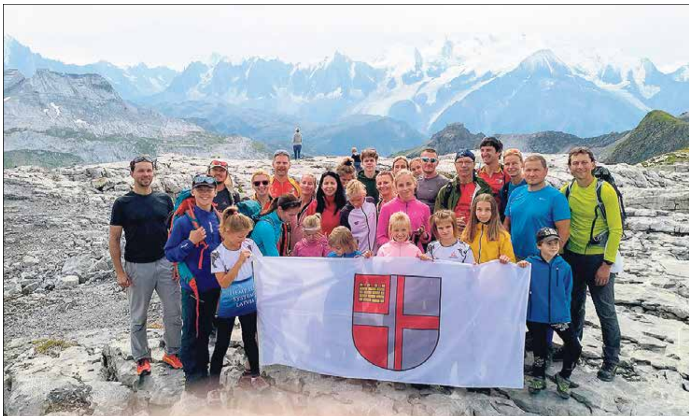
Ekspedīcijas dalībnieki pirms kāpiena Monblāna virsotnē.

Turpmāko stundu laikā virzīšanās pretī mērķim sagādā arī dažādas grūtības – elpas trūkumu retināta gaisa apstākļos, sliktu dūšu, galvassāpes un pēc skābekļa „kliezdzošus” kāju muskuļus, jo vietām kāpšanas slīpums pieaug un soļi jāliek, kā kāpjot pa trīs pakāpieniem uzreiz. Ir domas arī griezties atpakaļ, jo esam pārtērējuši kāpie-