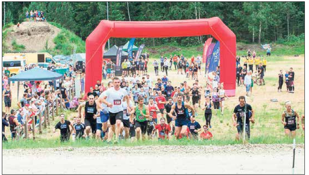
„Drosmes skrējiena” dalībnieki sāk ceļu uz šķēršļiem.

Lai novērtētu ikviena dalībnieka drosmi, spēku, veiklību un ātrumu, drosmes skrējiena rīkotāji sacensību distancē Ikšķiles dabas parkā, taku dabiskos šķēršļus – grāvjus, dubļu bedres un citus dabas veidojumus – bija papildinājuši ar dažāda lieluma un formas mākslīgi konstruētiem šķēršļiem. Trasi interesantāku padarīja arī dažādi citi uzdevumi distancē – smilšu maisu un koka blūku nešana, akmeņu vilšana un atmiņu testi, ar vairākiem ūdens šķēršļiem sakarsušos dalībniekus veldzēja arī Dubkalnu karjers. Pavisam 7 kilometru trasē bija jāpārvar 29 šķēršļi, 14 kilometros skrējējiem – divreiz vairāk, jo 7 kilometru aplī bija jāveic divkārt.