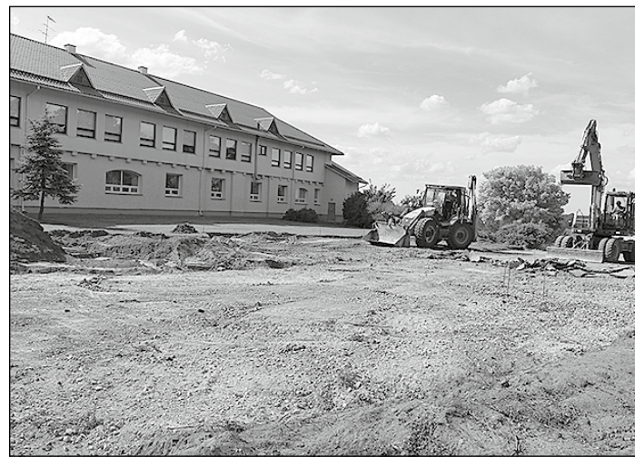
Top jaunais auto stāvlaukums.

Trešajā etapā notiks pašreizējās brauktuves pārbūve un jauno ietvju izbūve pie „Kraujām”, un komunikāciju tīklu pārbūve. Kopējais trešā etapa būvdarbu ilgums būs aptuveni 2 mēneši.