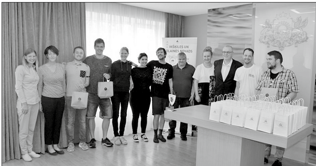
Jaunieši no Vācijas tiekas ar pašvaldības darbiniekiem.

2. jūlijā Ikšķiles novada pašvaldībā viesojas jaunieši no sadarbības pilsētas Visbādenes Vācijas, kuri projektā „Erasmus+” no 29. jūnija līdz 7. jūlijam apmeklēja Latviju.