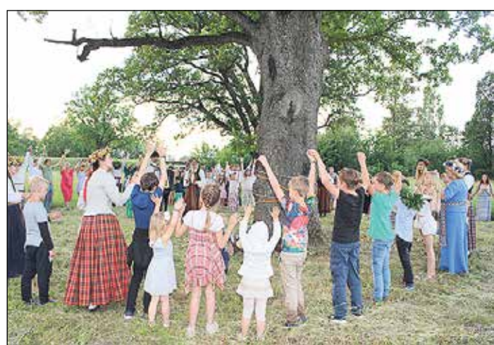
Svētku viesi ļaujās Ozola rituālam.