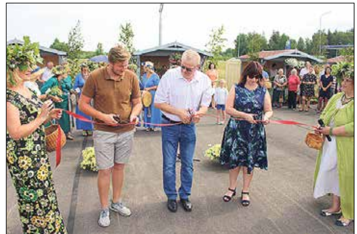
Svinīgais tirgus laukuma atklāšanas brīdis.

Tirdzniecības atļauju ir iespējams saņemt klientu apkalpošanas centros „Kraujas”, Tinūžos, Tinūžu pagastā (tautas nams), Daugavas prospektā 34, Ikšķilē vai Peldu ielā 22, Ikšķilē, aizpildot tirdzniecības atļaujas pieprasījumu. Tirdzniecības atļaujas pieprasījumu ir iespēja aizpildīt arī elektroniski pašvaldības mājaslapā www.ikskile.lv , sadaļā „Pakalpojumi”. Neskaidrību gadījumā lūdzam sazināties pa tālruni 65030202.