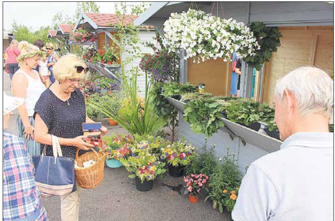
Gatavojoties vasaras saulgriežiem, iedzīvotāji pērk jāņuzāles.

Ar 22. jūniju tirdzniecība Tinūžu tirgū tiek organizēta saskaņā ar Ikšķiles novada pašvaldības 2015. gada 30. septembra saistošajiem noteikumiem Nr. 19/2015 „Ielu tirdzniecības organizēšana