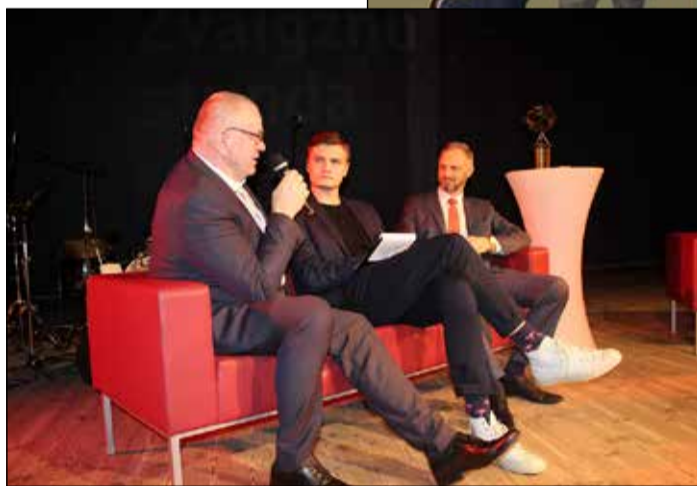
Abu novadu pašvaldību vadības pārstāvji dalās ar jauniešiem pieredzē.