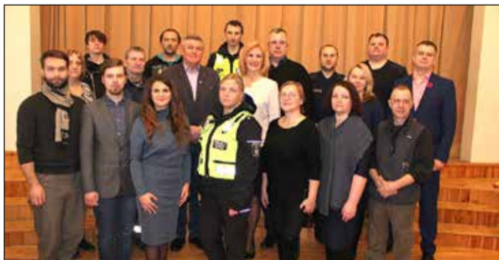
Kultūras pasākumu organizēšanā iesaistīti visdažādāko jomu pārstāvji.

Pašvaldība laipni aicina uz daudzkrāsainiem pasākumiem gan Ikšķiles un Tinūžu Tautas namā, gan brīvdabas estrādē, gan Daugavas pludmalē un Zilajos kalnos.