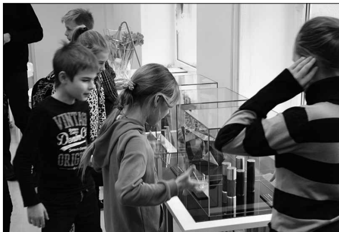
Ikšķiles Mūzikas un mākslas skolas audzēkņi iepazīst metāla mākslu.