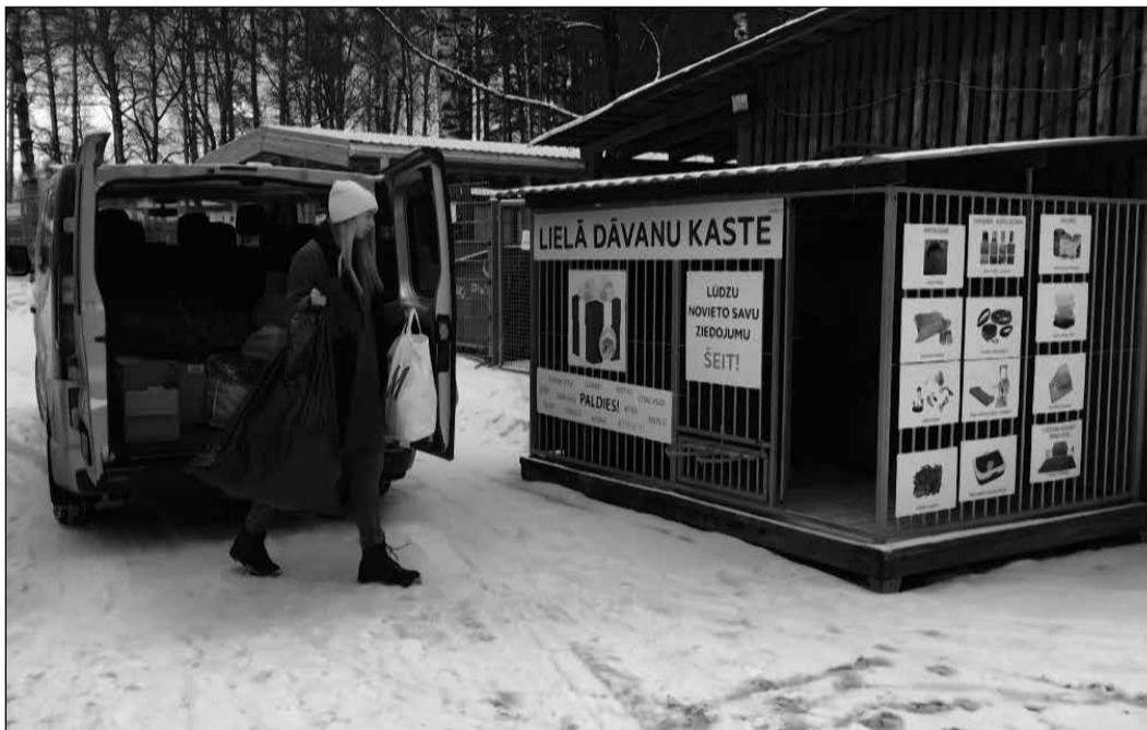
Audzēkņu saziņotās lietas nonāk patversmē.

Žurnālistikas pulciņa meitene izmantoja visas iespējas, lai veicinātu akcijas norisi. Informācija tika ievietota skolas mājaslapā, sociālajās vietnēs, nosūtīta vecākiem ar e-klases pasta starpniecību. Meitene pat individuāli gāja pie pedagogiem ar lūgumu pārskatīt makulatūras krājumus klasēs. Rezultāts bija iepriecinošs – 1. martā no skolas tika organizēts transports, lai nogādātu saziņotās lietas patversmē. Prieku un gandarījumu par paveikto meiteņu acīs papildināja apziņa par to, ka viņas var. Var paveikt kaut ko patiesi nozīmīgu un lietderīgu, no idejas līdz pilnīgai realizācijai.