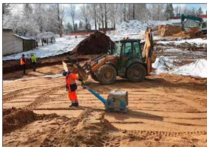
Šobrīd laukumā notiek rakšanas darbi komunikāciju izvietojšanai.

Sakarā ar to, ka zeme vēl ir sasaluši un lai pasargātu apkārtnes komunikācijas no bojājumiem, tuvāko divu nedēļu laikā netiks uzsākti rakšanas darbi Birzes ielā. Lūdzam sekot līdzi satiksmes organizācijas izmaiņām vietnē www.ikskile.lv . Vēršam uzmanību, ka satiksmes organizācijas shēmas tiks atjaunotas regulāri.