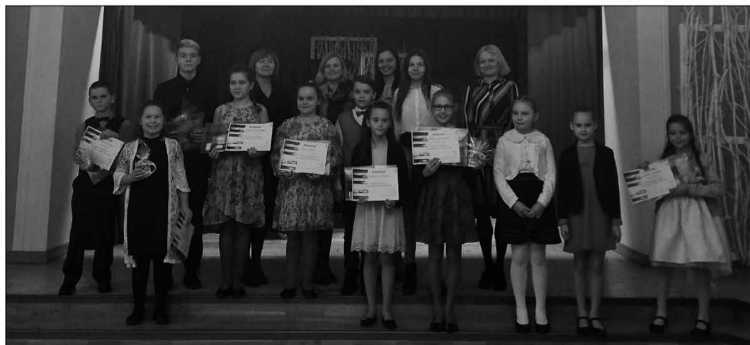
Audzēkņi un pedagogi pēc apbalvošanas Pārdaugavas Mūzikas un mākslas skolā.