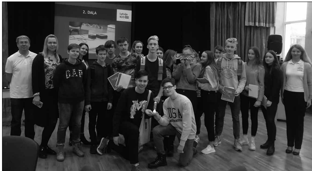
Ikšķiles vidusskolas audzēkņi un biedrības „Kultūras artefakts” pārstāvji.

Projekta „Skolas soma” ietvaros 17. janvārī Ikšķiles vidusskolu ar prāta spēli „Trāpi simtniekā” apmeklēja atraktīvi, enerģiski un aizraujoši biedrības „Kultūras artefakts” pārstāvji no Daugavpils Universitātes.