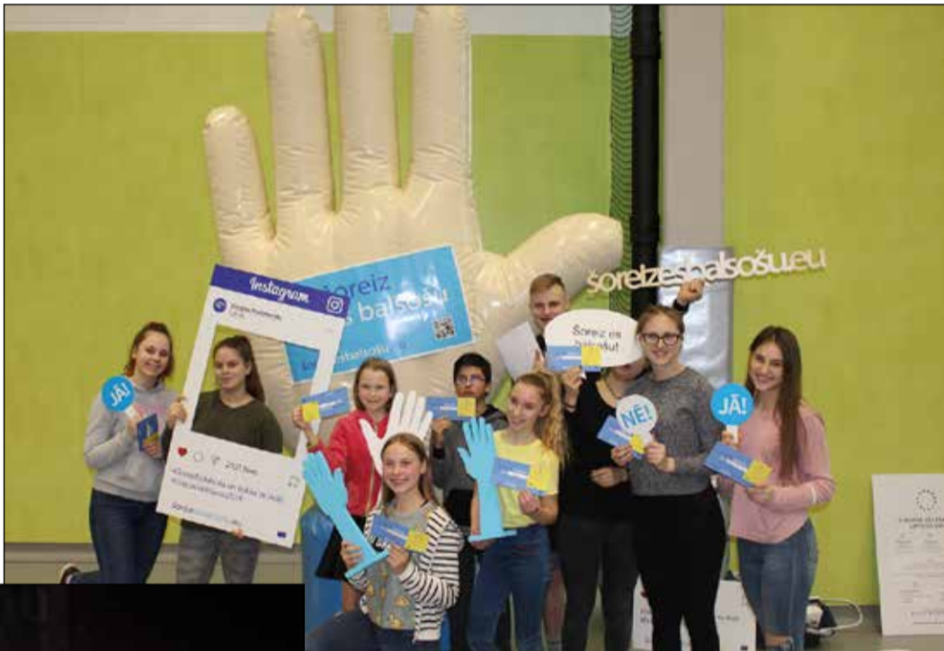
Ikšķīles un Olaines novadu jaunieši apvieno spēkus.