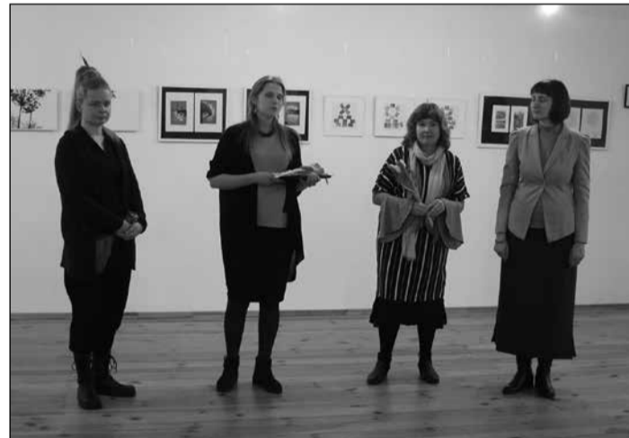
Ceļojošās izstādes atklāšanas brīdī.