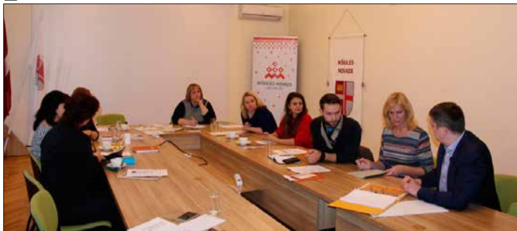
Pašvaldības speciālisti un iestāžu vadītāji vērtē kultūras jomas attīstības iespējas.

19. februārī notika kārtējā Ikšķiles novada pašvaldības Kultūras pārvaldes sanāksme, kurā speciālisti pārrunāja aktuālos jautājumus.