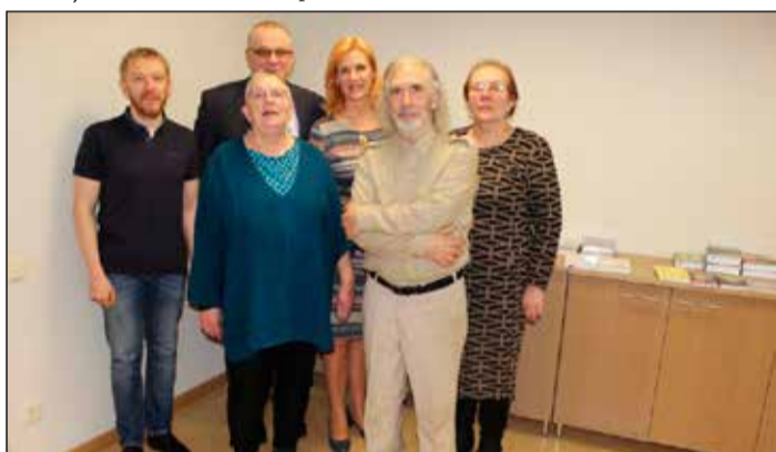
Žūrija tikšanās laikā pašvaldības telpās.

Jau septīto gadu Ikšķiles novada pašvaldība aicināja Latvijas grāmatu apgādus pieteikt autorus rakstnieka un tulkotāja Dzintara Soduma balvai par novatorismu literatūrā dzejas, prozas, dramaturģijas un tulkojumu žanrā. Dzintara Soduma balvas fonds ir 4270 eiro. Žūrijai ir tiesības pasniegt vienu vai vairākas balvas. Balvas pasniegšana īpašā sarīkojumā notiks 17. maijā Ikšķiles Tautas namā.