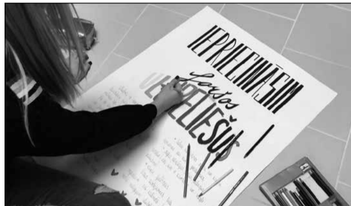
Top plakāts – aicinājums Ikšķiles jauniešiem.

Citāti no Andra Jaunberga bērnības atmiņām par izsūtījuma laiku Sibīrijā (1949.–1956.)