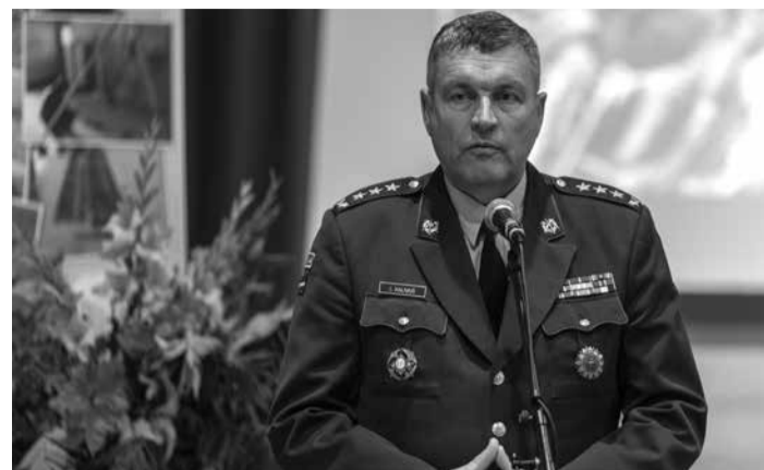
Kā gada viesis grāmatas atvēršanas svētkos piedalījās Nacionālo bruņoto spēku komandieris ģenerālleitnants Leonids Kalniņš.