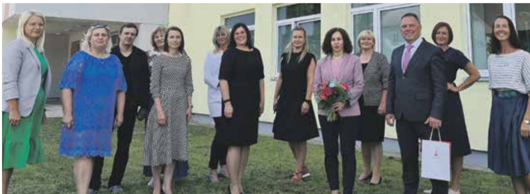
Izglītības un zinātnes ministre (ceturtā no labās) ar novada pašvaldības un izglītības iestāžu pārstāvjiem.