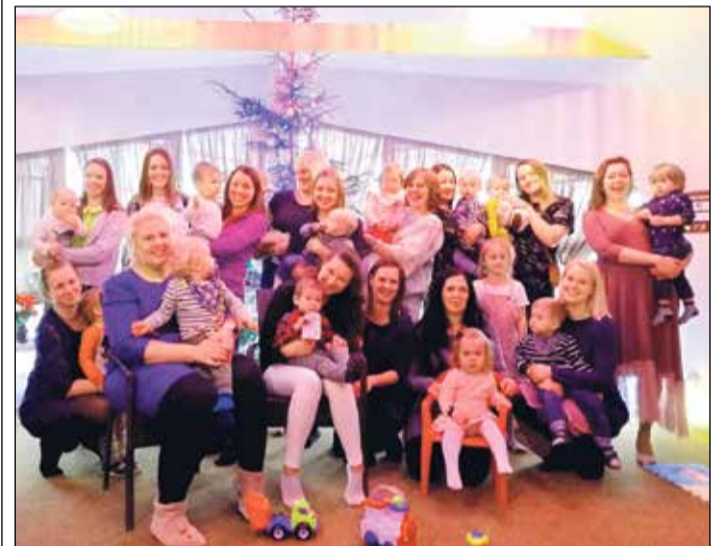
Ikšķiles Māmiņu kluba dalībnieces ar saviem mazuļiem.

Aicinām visas pašreizējās un topošās māmiņas pievienoties „Facebook” grupai „Ikšķiles Māmiņu klubs” un sekot līdzi turpmākajiem pasākumiem.