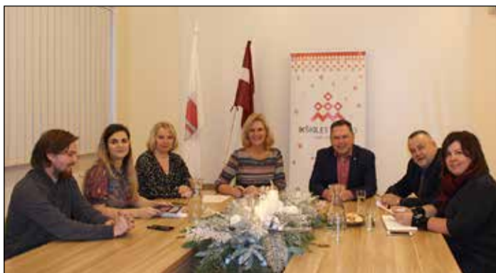
Ikšķiles novada pašvaldības un LLKC pārstāvji pārrunā sadarbību 2020. gadā.

jau ceturto gadu, tā mērķis ir iepazīstināt Latvijas iedzīvotājus ar labākajiem vietējiem pārtikas ražojumiem un ēdienu gatavotājiem. Katra šī reģionālā pasākuma meistarklases notiek tikšanās ar kādu izcilu sava reģiona šefpavāru, kurš piedāvā savu „novada garšu”, gatavojot ēdienu no vietējiem produktiem, pēc tam piedāvājot to nodedūstēt, meistarklases ar sava reģiona profesionāļiem pārtikas ražošanā, gatavošanā un izplatīšanā. „Novada garša” ir mūsdienīgs pasākums ar mērķi parādīt, ka „novada garša”