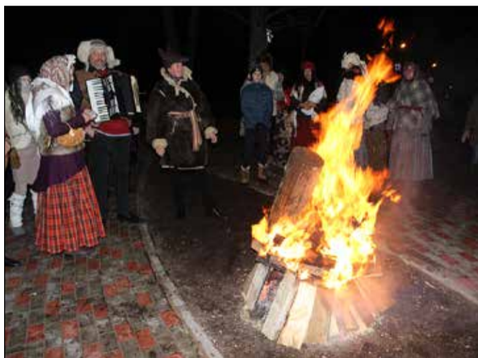
Tinūžnieki liksmo bluķa vakarā.

Pirms budēļošānās Tinūžu Tautas namā notika baltmaizišu cepšanas pasākums, kurā katrs varēja mācīties pīt lāču pogas un sešmaizītes. Taču līdz ar tumsas iestāšanos pilns pagalmis saradās ar lustīgiem budēļiem, kas dziedot un dejojot aicināja uz tradicionālo bluķa vilkšanas un dedzināšanas rituālu. Ziemassvētki neizpalika ar jautrām, bet simboliskām rotaļām, kas atēlo gaismas cīņu ar tumsu ziemas