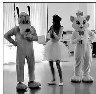
Pluto un Sniedzīte iepriecina novada bērnus.

2019. gada 30. decembrī Ikšķiles novada Veselības veicināšanas centrs, Sociālais dienests, bāriņtiesa un Izglītības, sporta un jaunatnes lietu pārvalde organizēja gada nogales pasākumu bērniem ar invaliditāti un audžuģimeņu bērniem, kas pulcēja gan lielus, gan mazus, kuri ar prieku baudīja dziesmas, dejas un rotaļas Sniegavīra, kaķītes Sniedzītes un suņa Pluto vadībā.