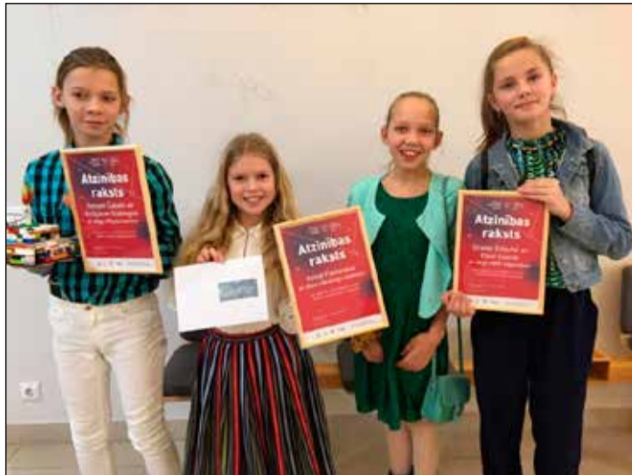
Ikšķiles Brīvās skolas audzēkņi ar iegūtajiem atzinības rakstiem.

Biznesa ideju radīšana ir apliecinājums, ka kompetenču pieeja dod labus rezultātus, palīdz mācīties un dod gandarījumu par rezultātu pašiem skolēniem. Lai gan sākotnēji skolēni bija pārliecināti, ka dalība konkursā nozīmē ne mācībām brīvu nedēļu, laika gaitā secināja, ka biznesa idejas pieteikuma izveidošanā nepieciešams izmantot latviešu valodā, informātikā, matemātikā, sociālajās zinībās apgūto. Skolēniem bija iespēja pielietot jau esošās zināšanas un prasmes, pētīt informācijas telpā pieejamos datus, kā arī pilnveidot gan tehnoloģiju lietošanas, gan publikās runas, gan prezentēšanas, gan sadarbības, gan informācijas