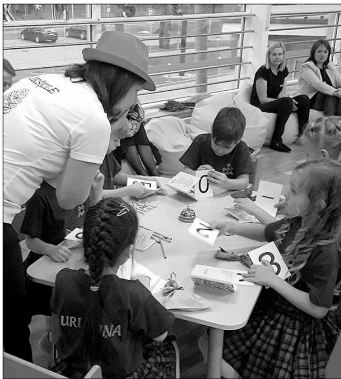
Pirmsskolas izglītības iestāžu audzēkņi meklē pareizās atbildes.

Dalības maksa: 20 eiro; Brīvās skolas ģimenēm, darbiniekiem – 15 eiro. Dalība tikai ar iepriekšēju pieteikšanos, rakstot uz e-pasta adresi sanita@brivaskola.lv .