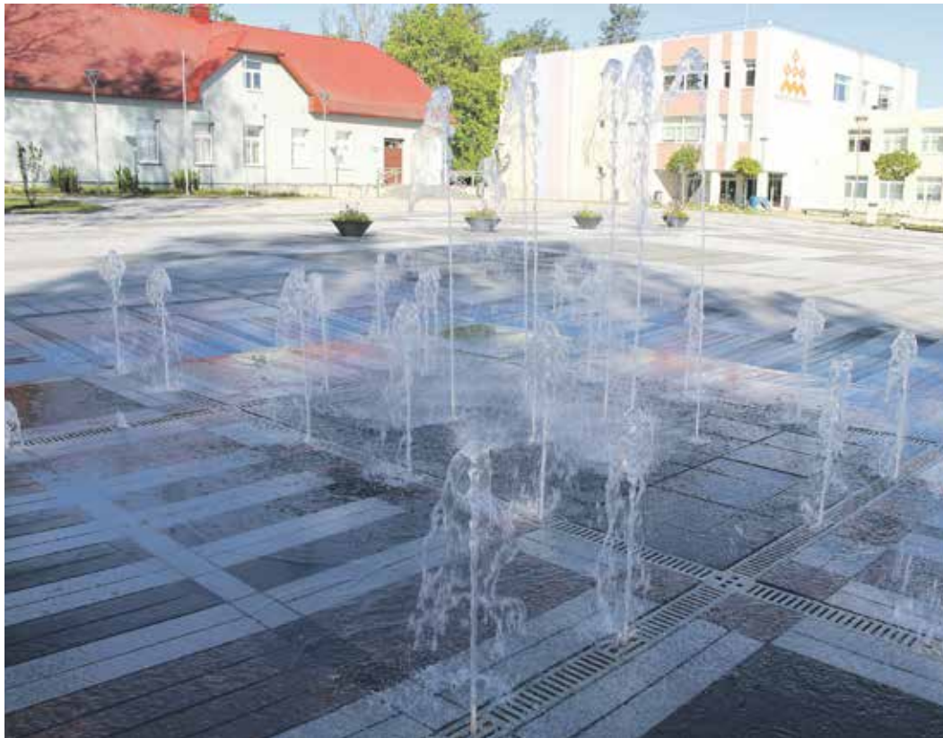
Nominācijā „Inženierbūve” izvirzīts Ikšķiles pilsētas centrālais laukums un satiksmes organizācija pilsētas centrālajā daļā (2. kārtā). Pasūtītājs: Ikšķiles novada pašvaldība. Galvenais būvuzņēmējs: ceļu būves firma SIA „Binders”.

BIM objektu kategorijā vērtēs deviņus projektus Rīgā, Ādažu, Mārupes, Babītes un Stopiņu novadā. Četrus BIM nominācijas objektus vērtēs arī citās kategorijās. Lai arī konkursā Ikšķiles Centra laukums neieguva žūrijas augstāko novērtējumu, pašvaldība ir gandarīta par realizēto projektu.