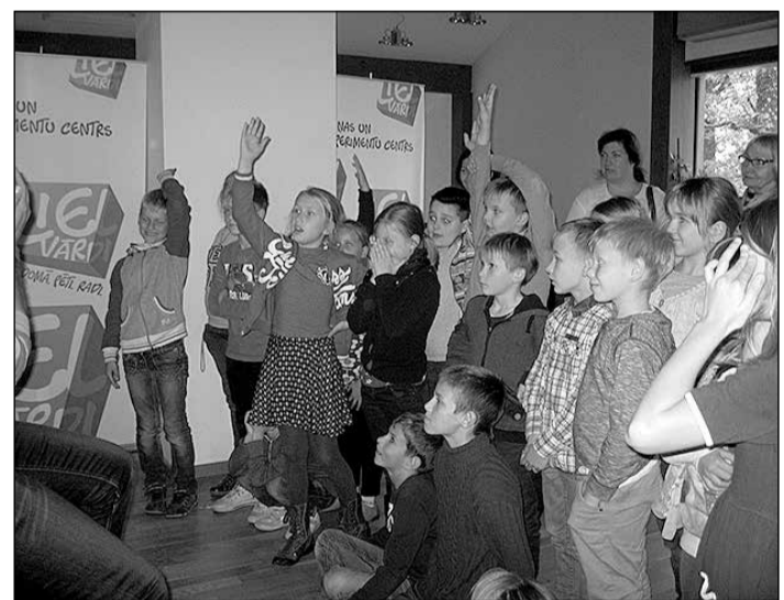
Bērni uzziņāja, kā rodas skaņa, kāpēc skaņas ir dažādas un kā izgatavot mūzikas instrumentus.

precīgi smaidi sejās un 8. oktobra rītā dodamies ceļā! Brauciens izvērtās gan izklaidējošs, gan izglītojošs. Tā kā braucām uz Lielvārdi ar vilcienu, tad varējām gana izstaigāties, izskrieties un pa-