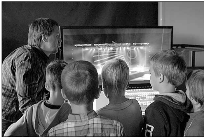
Bērniem bija iespēja pašiem uz brīdi iejusties skatuves gaismotāju lomā.