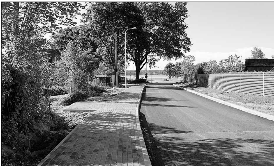
Ozolu iela pēc vērienīgiem projektēšanas un pārbūves darbiem.

valdībā, atceras laiku, kad šis projekts tika aizsākts. Tas bija tālajā 2010. gadā. Mums bija dots uzdevums sagatavot tehnisko projektu. Tas bija ļoti sarežģīts darbs. Apzinot reālo situāciju, viens no pirmajiem secinājumiem, pie kā nonācām, – uzstādītās prasības nav iespējams reāli izpildīt. Ja kāds atceras, tad mantojumā saņēmām diezgan nopietnu problēmsituāciju – Ozolu iela bija kā robeža pilsētas un lauku teritorijai. Līdz ar to ielas vienā pusē bija noteiktas sarkanās līnijas, bet otrā – ne. Pat vēl trakāk – atsevišķu īpašumu robežas atradās uz asfalta malas. Ozolu ielas īpatnība ir tās šaurums. Vizuali to ir grūti pamanīt, bet juridiskās īpašumu robežas to apliecina. Jautājums: kur lai izvietot iedomāto trotuāru, kanalizāciju, ūdensvadu, apgaismes u.c. kabeļus? Kā lai izveido satiksmes noteikumiem atbilstošu brauktuves platumu, ja ņem vērā, ka noteiktos posmos nepietiek vietas? Tika veikta pamatīga robežjoslu izpēte, iedzīvotājus aicinājām pārcelt sētas tālāk no ielas teritorijas, vietās, kur tās bija uzliktas ārpus īpašumu robežām. Lai rastu iespēju izvietot trotuāru, neiztikām arī bez īpašumu atpiršanas procedūras. Vislielākā pateicība jāsaka tiem iedzīvotājiem, kuri sabiedrības labā bija gatavi šķirties no daļas sava īpašuma. Bez šādas pretimnākšanas trotuāra nebūtu. Nav jēgas būvēt kādu noteiktu posmu, tad atstāt tukšumu, jo nav vietas, un tad turpināt to tur, kur vietas at-