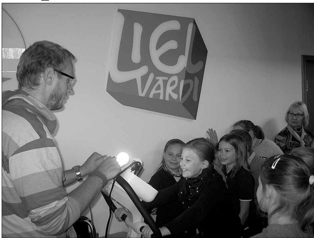
Skolēniem bija iespēja izmēģināt, kā darbojas dažādi mehānismi.

Ir iestājies rudens, kokiem birst lapas, gan lieliem, gan maziem vēl gribas paspēt izbaudīt pēdējos siltos saules starus un zelta rudeni. Tāpēc mēs, Ikšķiles vidusskolas 3.d klase, nolēmām