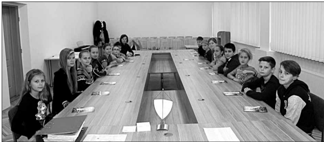
Skolēni iejutās deputātu lomā, ieņemot vietas pie lielā galda domes sēžu zālē.

Jau tradicionāli Ikšķiles vidusskolas skolēni mācību stundu ietvaros dodas uz Ikšķiles novada pašvaldību, lai tiktos ar tās darbiniekiem un uzzinātu par pašvaldības darbu. Šajā mācību gadā pašvaldībā jau ciemojušās četras klases.