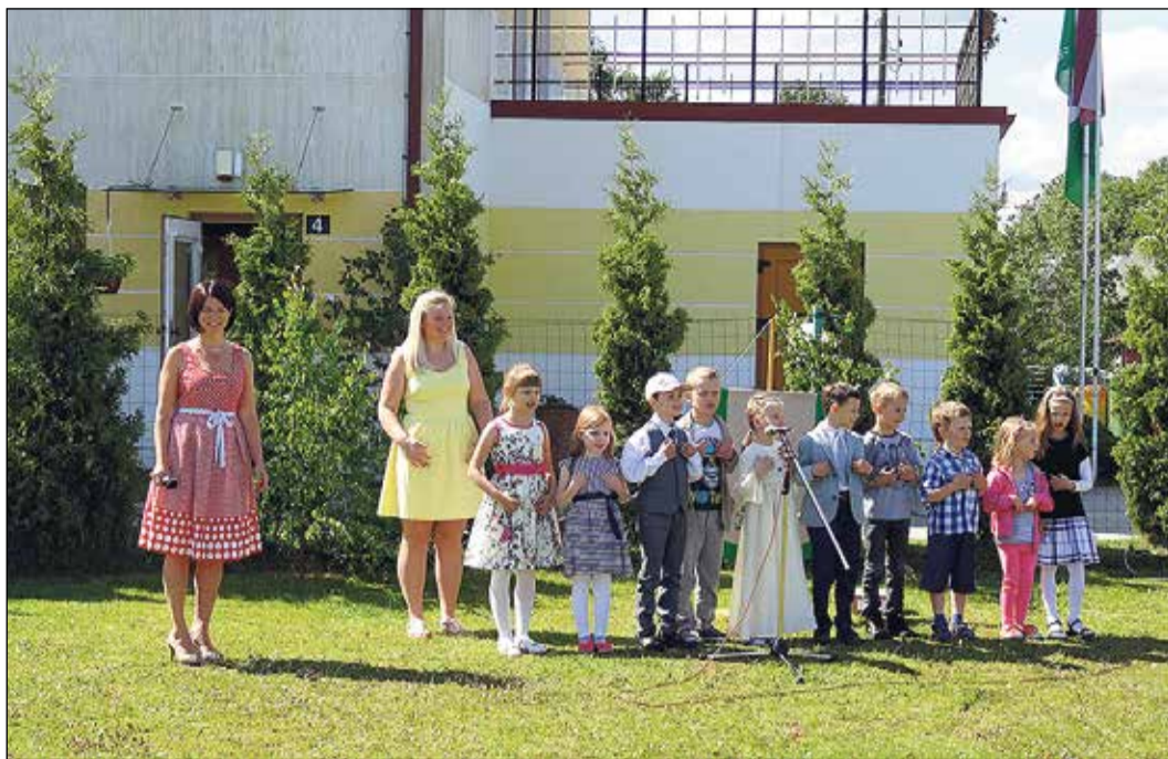
PPI „Kiparu nams” 5 gadu jubileja.

cep kotletes. Un jūs vienu vakaru pateiksiet, ka kotletes nav garšīgas. Otru vakaru teiksiet atkal, ka nav garšīgas. Kā jums liekas, vai trešajā vakarā mājās būs kotletes, vai sieva vispār kaut ko gatavos ēst? Domāju, ka ne. Tieši tāpat ir ar bērnu. Un tad nav ko brīnīties, ja bērns nevēlas ģērbties. Nu ja es nemāku uzvilkt, velc pats!