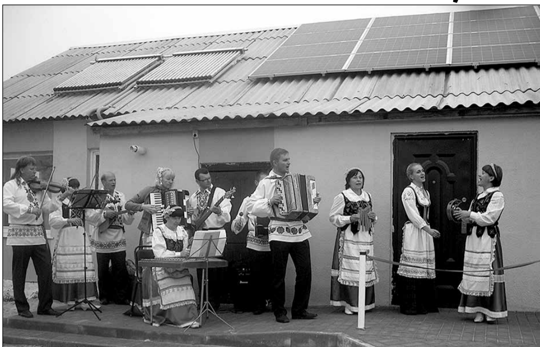
Stoļinā dienas centra pārstāvju teatralizēts koncerts, kura laikā pasaku varoņi meklēja pazaudēto atslēdziņu no „Informāciju un apmācību centra cilvēkiem ar īpašām vajadzībām”.

Interesanta bija tikšanās ar speciālistiem no Lauku attīstības un atbalsta centra. Centrs nodarbojas ar starptautisku projektu rakstīšanu un Eiropas finansēju-