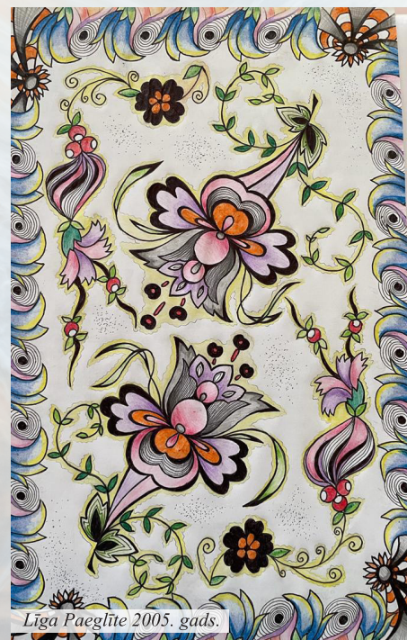
Liga Paeglīte 2005. gads.