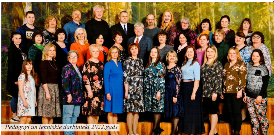
Pedagogi un tehniskie darbinieki 2022.gads.

Skola nav iedomājama bez skolotājiem, taču svarīgi ir arī tehniskie darbinieki, kas rūpējas par kārtību, tīrību, veic remontus, sakopj apkārtni, gatavo ēst. Tikpat nozīmīgs ir lietveža un sekretāra darbs. Madlienas vidusskolā ir darbinieki, kas daudzus gadus apzinīgi veic savus pienākumus un šo skolu ir iemīļojuši. Ielūkosimies dažu tehnisko darbinieku atmiņu stāstos un vēlējamos skolai dzimšanas dienā!