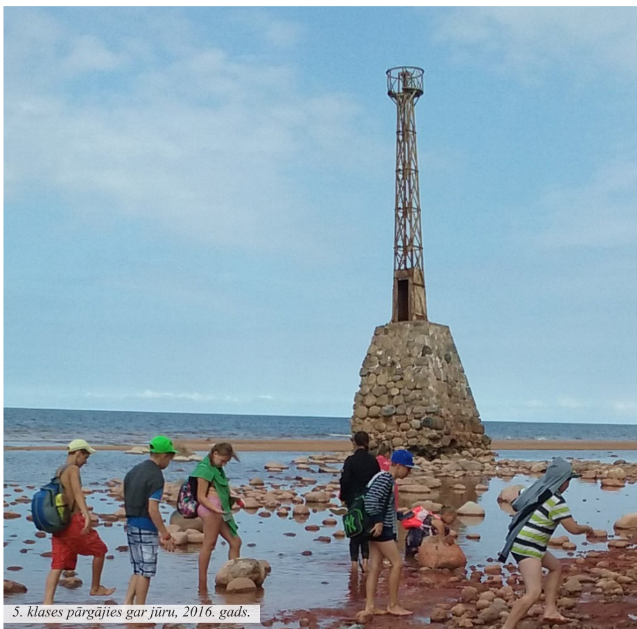
5. klases pārgājies gar jūru, 2016. gads.

Svarīga ir arī vecāku savstarpējā sapratne, cieņa un vēlme sadarboties. Kaut ko darot komandā, rezultāts ir daudz vieglāk sasniedzams nekā tad, kad klasē ir viens vecāks, kurš visu izdara. Šajā klasē bija brīnišķīga vecāku komanda.