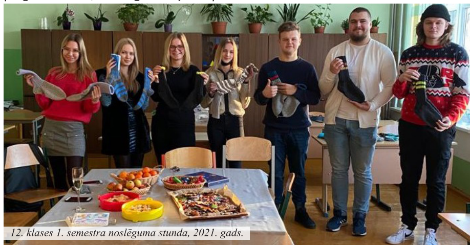
12. klases 1. semestra noslēguma stunda, 2021. gads.