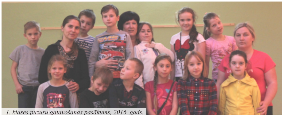
1. klases puzuru gatavošanas pasākums, 2016. gads.