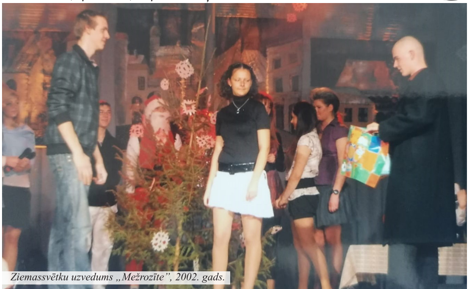
Ziemassvētku uzvedums „Mežrozīte”, 2002. gads.