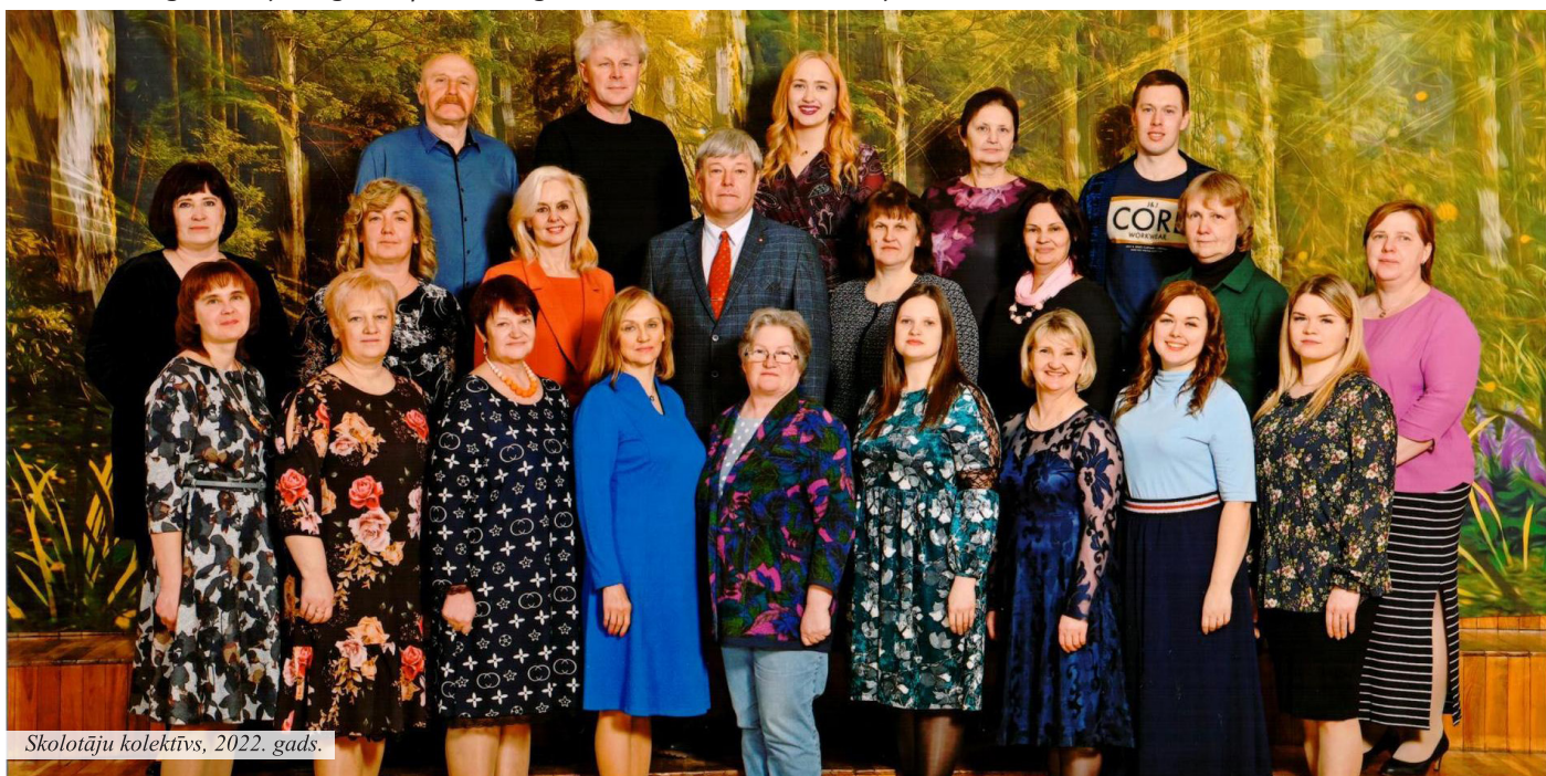
Skolotāju kolektīvs, 2022. gads.