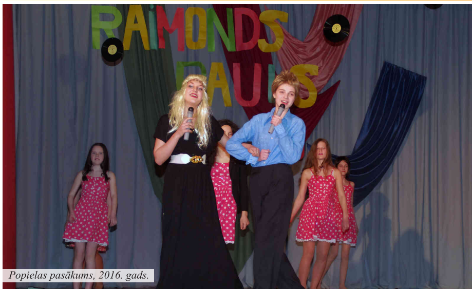
Popielas pasākums, 2016. gads.

grābšanu, dežūrēšanu pie skolas zvana, ēdamzālē un skolas telpās. Skaisti pasākumi bija 9. un 12. klases izlaidumi. Īpaši Žetonu vakars, kas satuvināja klasi, jo sapratām, ka drīz mūsu ceļi šķirsies, tāpēc atcerējāties daudzus kopīgos pasākumus un tos atveidojām uzvedumā. 2003. gadā ieguva titulu „Gada skolēns”, tas bija brīnišķīgi! Biju lepna un sajutu atbalstu un prieku no klasesbiedriem, skolotājiem, ģimenes, draugiem.