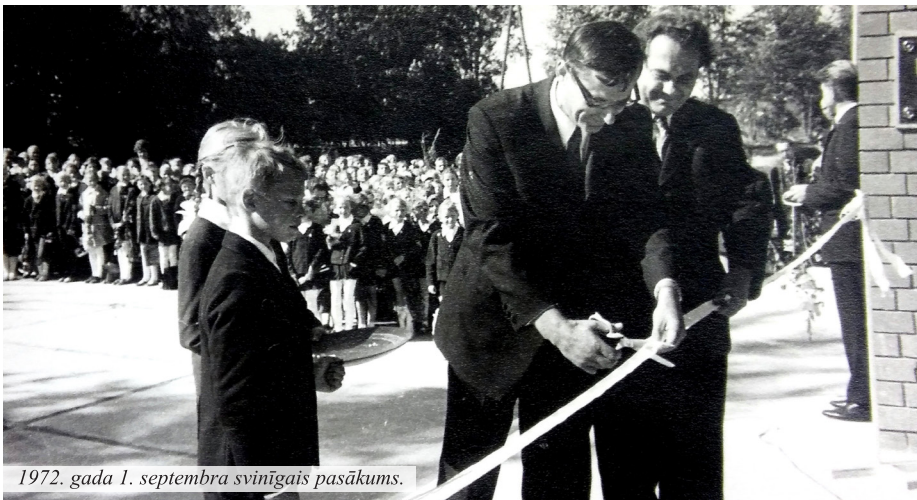
1972. gada 1. septembra svinīgais pasākums.

Madlienas vidusskola aug, veidojas un mainās. Piecdesmit gadu laikā tajā ir mācījušies tik daudzi skolēni, un katram atmiņas krāsojas savās krāsās, atceroties skaisto un jauko, arī bēdu brīžus un palaidnības. Skola – tas ir gan nopietns mācību darbs, gan aktīva un jautra ārpusstundu dzīve. Mūsu atmiņas veido Madlienas vidusskolas vēsturi. Tā ir laikmeta liecība – ar savu krāsojumu un arī subjektivitāti. Atmiņu stāstos izmantots materiāls no 2017. gadā veidotās grāmatas „Mana Madlienas vidusskola” un pēdējo piecu gadu absolventu domas.