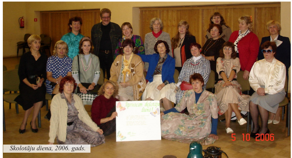
Skolotāju diena, 2006. gads.

18 mani pedagoģiskā darba gadi tika aizvadīti Madlienas vidusskolā. Tas bija ļoti radošs un interesants laiks. Esmu gandarīta to saukt par savas pedagoģiskās darba pieredzes piesātinātāko laiku ar īpašiem notikumiem. Tā