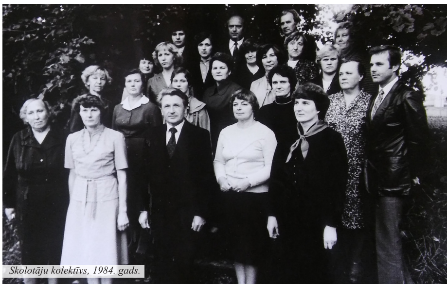
Skolotāju kolektīvs, 1984. gads.

Skolotāji ir skolas dvēsele, labie garīni un gaismas devēji. Stipra tā skola, kurā ir labs skolotāju kolektīvs – erudīts, zinošs, darbīgs un profesionāls. Arī skolotāju atmiņas veido Madlienas vidusskolas vēsturi, dažkārt šie pavedieni savijušies mūža garumā, ja skolotājs ir mācījies savā skolā, te izglītību guvuši viņa bērni un mūža darba gadi pavadīti Madlienas vidusskolā. Dažādi stāsti, raibas atmiņas, kuras vieno sava darba mīlestība un cieņpilna attieksme pret paveikto.