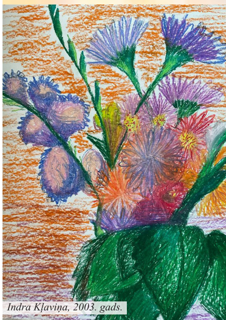
Indra Kļaviņa, 2003. gads.