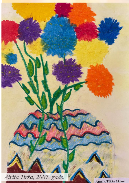
Airīta Tirša, 2007. gads.