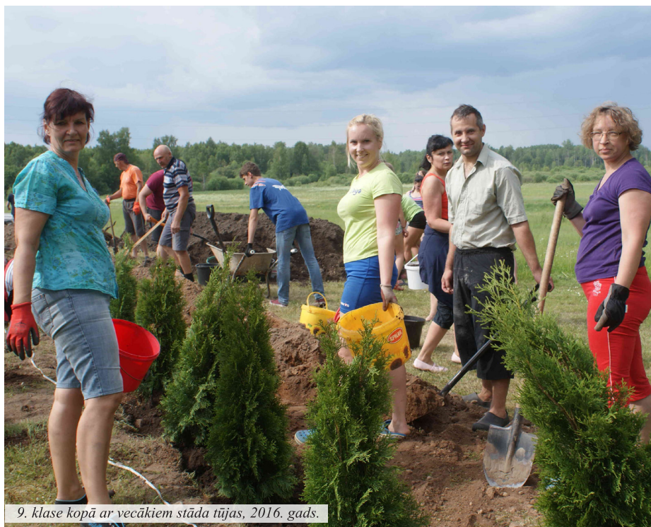
9. klase kopā ar vecākiem stāda tūjas, 2016. gads.