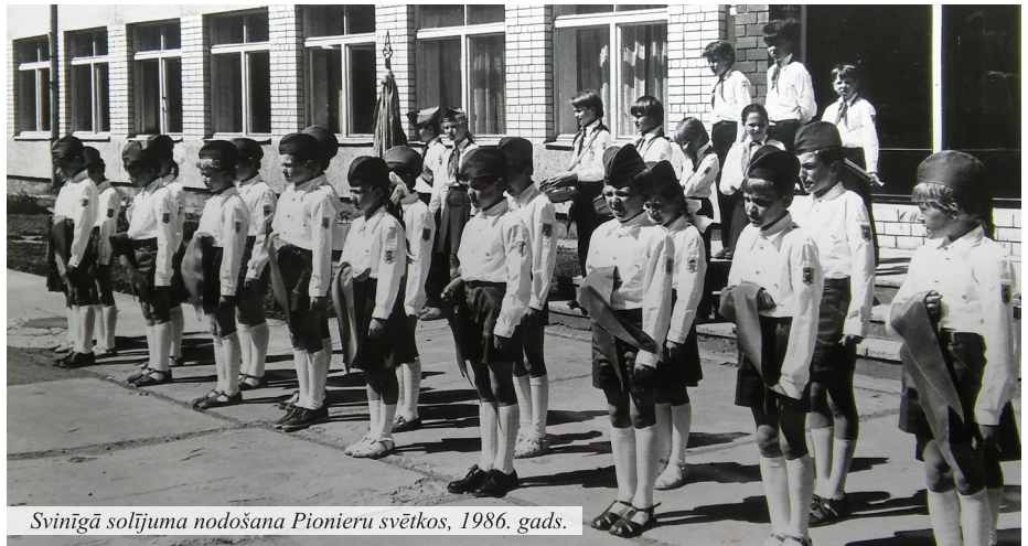
Svinīgā solījuma nodošana Pionieru svētkos, 1986. gads.

Droši varu apgalvot, ka visi pedagogi, kas mani mācījuši, ir skolotāji ar lielo burtu un katram no viņiem esmu pateicīga gan par mācīto, gan par uzslavām, gan arī par kādu skarbāku vārdu. (..) Pēc pēdējā eksāmena ceļā no skolas uz mājām, nonākdama pie stadiona, nejauši atskatījos atpakaļ. Un tikai tad ieraudzīju, cik skaistā vietā atrodas Madlienas vidusskola un cik skola ir cēla. Sajūta bija tāda, it kā es skatītos uz dārgu gleznu. Visus šos 11