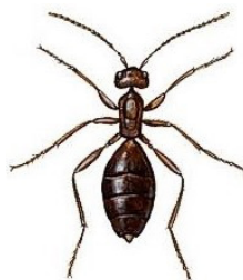
Panglapsene un pangas

Jūlija sākumā aizgāju līdz skolas ozoliem, un, jā, tiešām – pangas jau bija tukšas, panglapsēņu kāpuri devušies dzīvē.