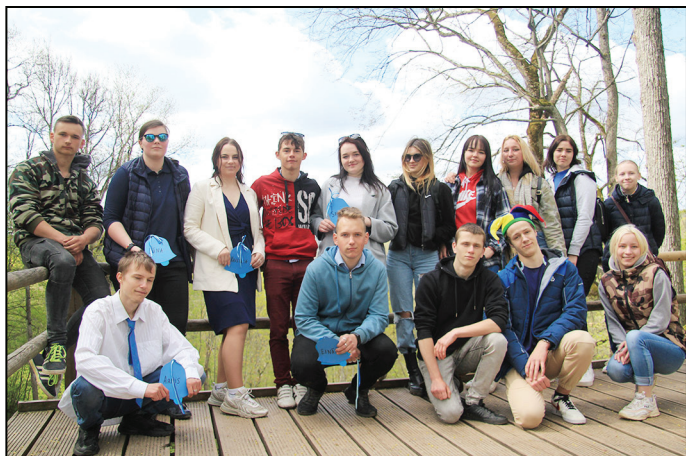
11. un 12. klase Siguldā