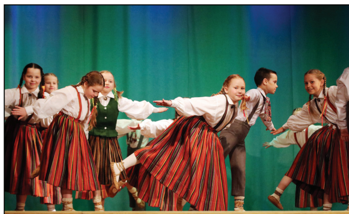
1.-2. klases deļotāji