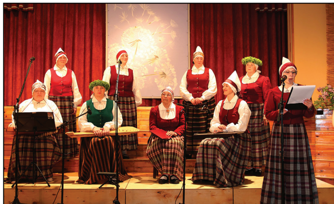
Folkloras kopa "Saule" mūzikas koncertā kultūras namā