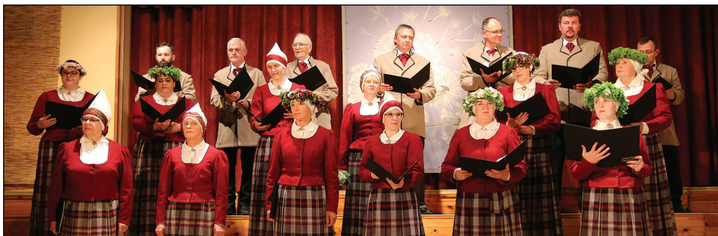
Kultūras nama jauktais koris "Suntaži"