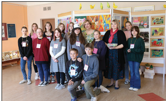
Mākslas skolas audzēkņi un skolotāji izstādes atklāšanā

Divās skolas zālēs klātesošie baudīja mūzikas skolas pūšamo instrumentu, ģitāristu un pianistu sniegumu. Secinājums viens - ciešā sadarbība: skolēns-vecāks-pedagogs, noteikti nes augļus.