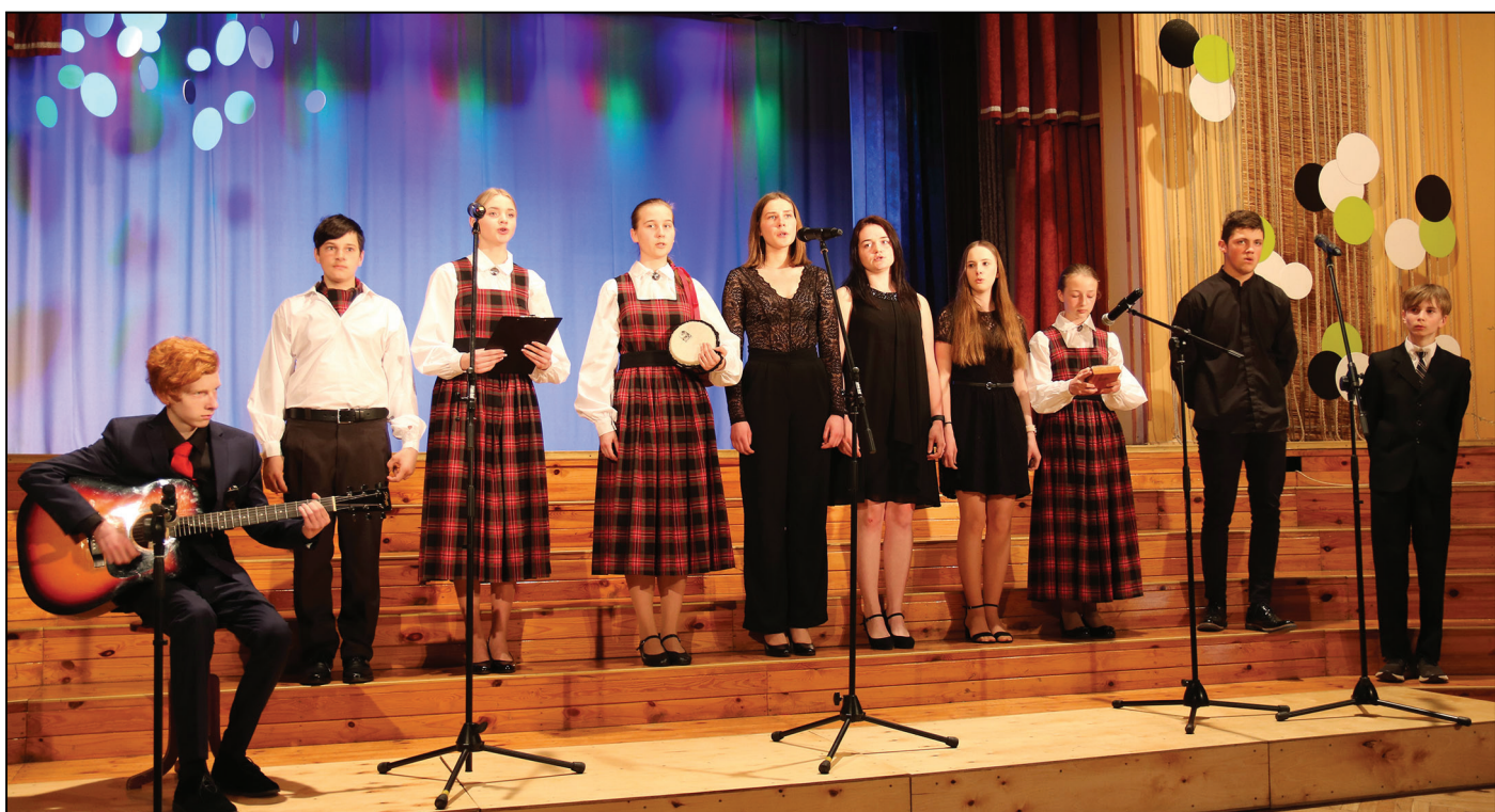
8.-12. klašu muzicējošo jauniešu grupa