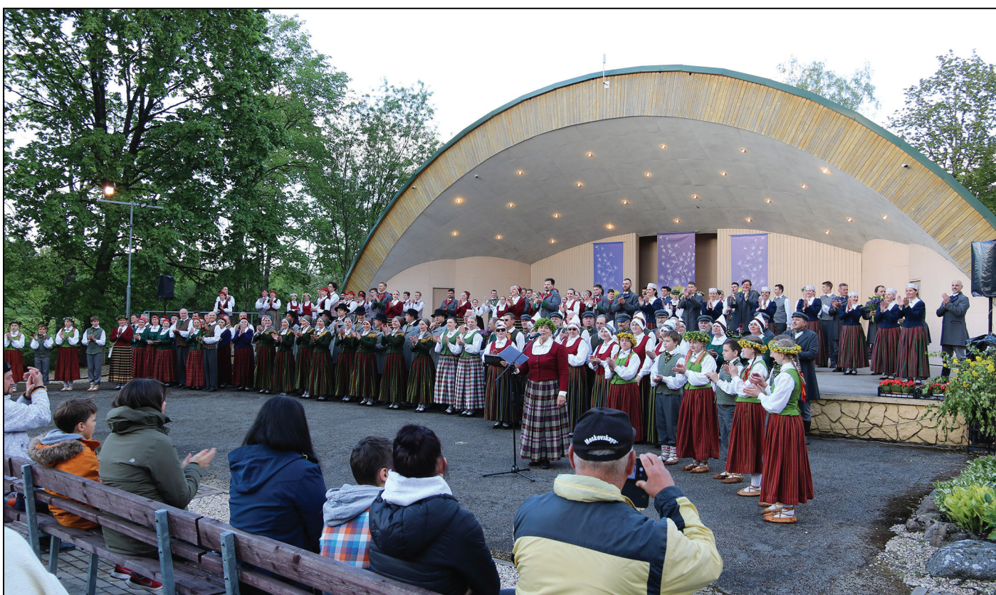
"B Optimist" priekšnesums