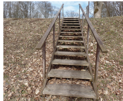
Koka kāpnes uz agrāko muižas vietu