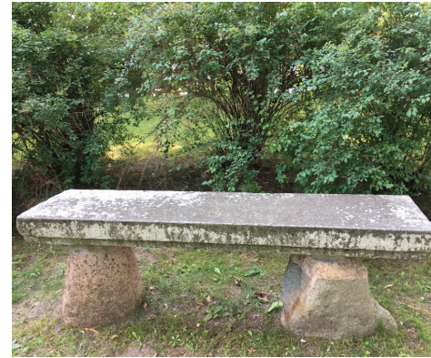
Granīta soli pie baznīcas