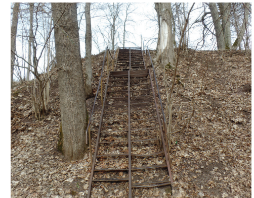
Rūsējušas, savu laiku nokalpojušas metāla kāpnes uz stadionu