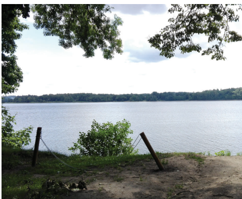
Norobežojošs elements pie pilsdrūpām