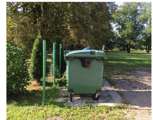
Atklāts atkritumu konteineru laukums pie dzīvojamās apbūves