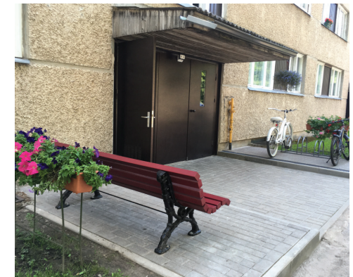
Rūpnieciski ražoti koka soli ar atzveltni pie dzīvojamās apbūves