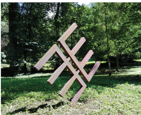
Vides objekts - etnogrāfiskā Ušiņa zīme