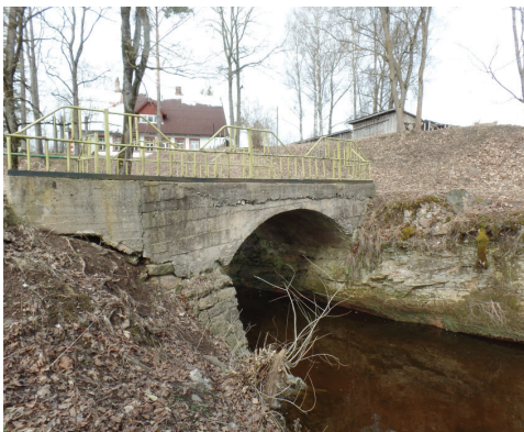
Tilts pār Rumbiņai