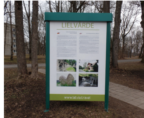
Informācija par Lielvārdes muižas apbūvi