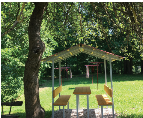
Lapene ar soliem un galdu pie dzīvojamās apbūves