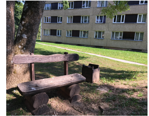
Amatnieka darināts sols pie dzīvojamās apbūves