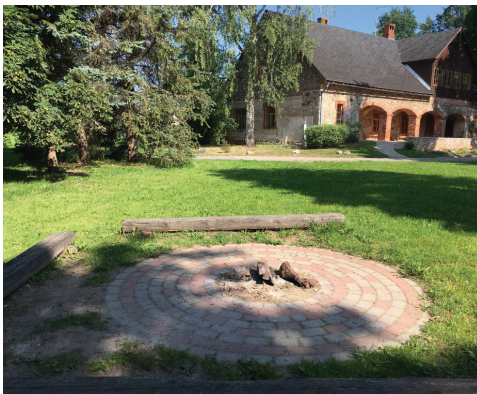
Ugunsкура vieta pie muzeja ēkas ar koka balķiem sēdēšanai