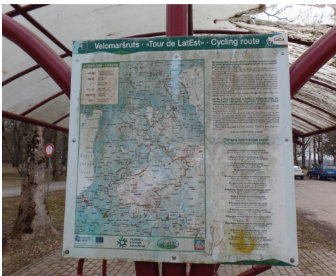
Pabalējuši velomaršruta shēma