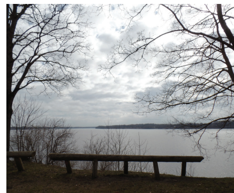
Koka balķu norobežojošs elements Daugavas stāvkrastā