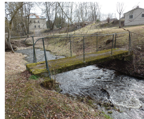
Betona plāksne - tilts pār Rumbiņu ar metāla margu