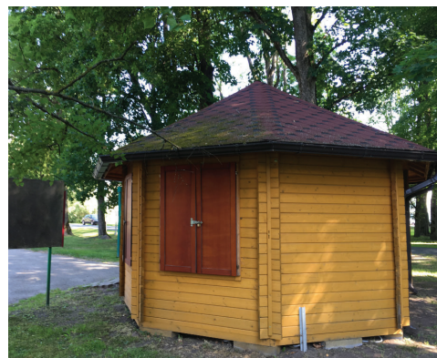
Info namiņš, ieteicams krāsot pelēkā tonī