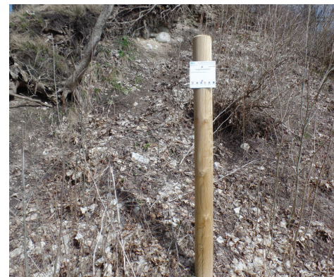
Informācija par Daugavas stāvkrastu