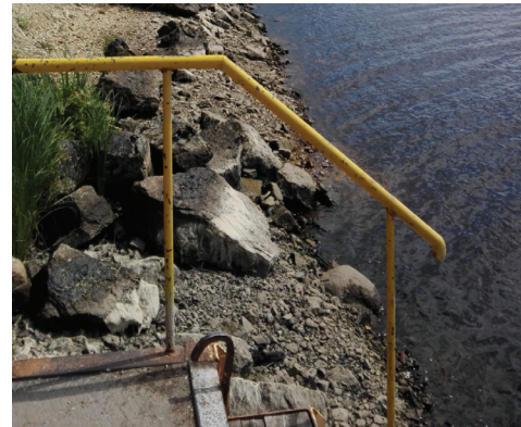
Piestātnes metāla margas ar atlupušu dzeltenu krāsojumu