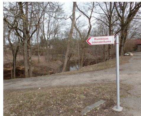
Norāde uz Rumbiņas ūdenskritumu