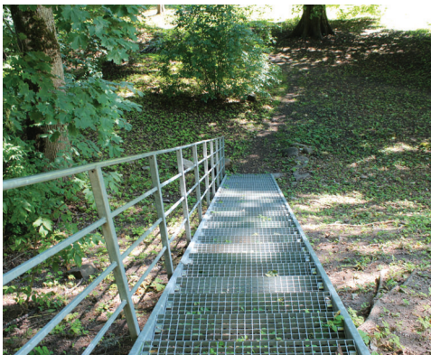
Cinkotas metāla režģa kāpnes ar margu