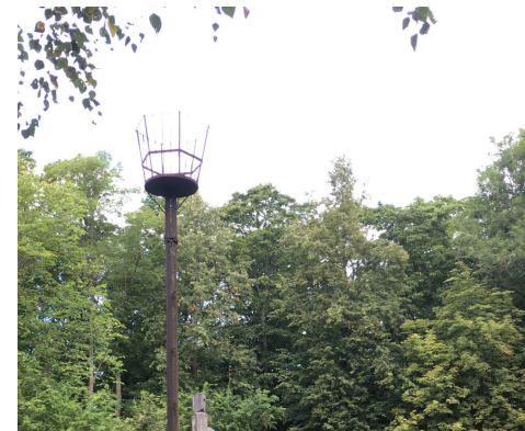
Pūdele Skulptūru dārzā