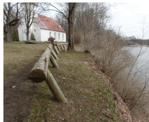
Koka balķu norobežojošs elements pie baznīcas un muzeja