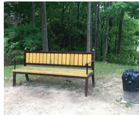
Individuāla dizaina koka soli Skulptūru dārzā