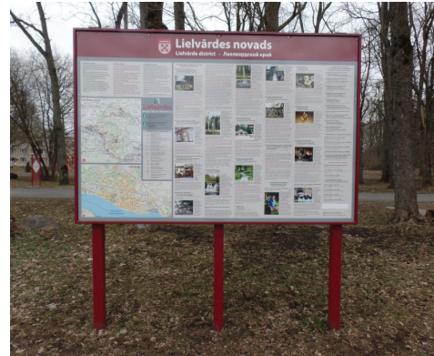
Novada tūrisma karte