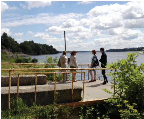
Laivu piestātne Daugavas krastā

Apkaimes teritorijā ir trīs tilti, kas ir bēdīgā stāvoklī. Mūra tilts, kas savulaik vedis uz muižas dzīvojamo ēku ir skaists sava laika būvniecības paraugs (19.gs. beigas, 20.gs. sāk.) un būtu pelnījis rekonstrukciju. Tādējādi teritorija iegūtu vēl vienu sakoptu kultūrvēsturisku būvi. Tilta apakšdaļa ir aizaugusi ar zemes slāni, lapām un aizkrauta ar muižas kolonnu atliekām, iespējams citiem būvgružiem. Otrs mazāks mūrēts tilts ved pār Rumbiņu pie ūdenskrituma, arī šim tiltam nepieciešama rekonstrukcija. Trešais tilts ir teritorijas ziemeļu daļā aiz Rumbiņas ūdenskrituma - betona plāksne ar metāla margām pāri Rumbiņai. Tiltu margas ir nolietojušās un neestētiskas. Betona konstrukcijas laivu piestātne Daugavas krastā ir vizuāli novecojusi. Arī šeit margām nolupusi krāsa. Norobežojošas apaļkoku margas izvietotas pie Daugavas stāvkrasta netālu no muzeja un baznīcas. Pie pilsdrūpām uz kraujas malas sašķiebušies metāla stabi ar ķēdi. Koka marga veidota uz skatu platformas pie Rumbiņas ūdenskrituma, šeit pat arī neestētiska metāla marga posmā no platformas uz mūra tiltu.