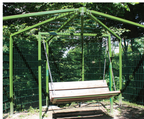
Metāla pņeļa konstrukcijas lapene ar šūpolēm Mīlestības kalniņā