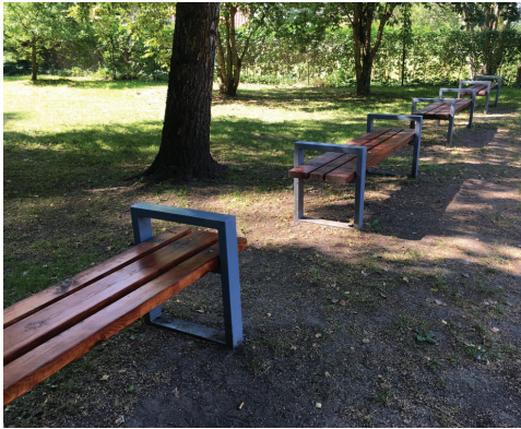
Koka soli bez atzveltnes pie autostāvvietas

Esošā labiekārtojuma infrastruktūra ir raiba, tai trūkst vienota dizaina un koptēla. Cik spēcīgas ir Lielvārdes parka vērtības, tik kvalitatīvi mazinošas ir arhitektūras mazās formas. Soliņi izvietoti visā parka teritorijā, tiem ir dažādi veidi un materiāli, kā arī krāsu toni. Pārsvārā redzami koka soli ar atzveltni, baznīcas tuvumā izvietoti granīta soli. Koka soli ir gan rūpnieciski ražoti, gan redzami arī amatnieku darinājumi. Katrā parka telpā ir pielietots cits solu dizains, tādējādi radot zināmu disharmoniju. Līdzīga situācija ir ar atkritumu urnām. Teritorijā izvietotas koka atkritumu urnas ar melnu plēvi, kā arī atklāti lielo konteineru laukumi.