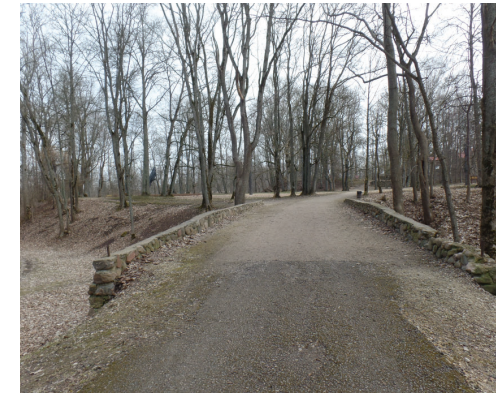
Akmens tilta atbalsta sienīņa 40 cm augsta