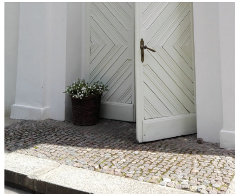
Šķelts granīta bruģakmens pie baznīcas ieejas