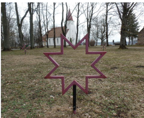
Vides objekts - etnogrāfiskā zīme "Auseklītis"