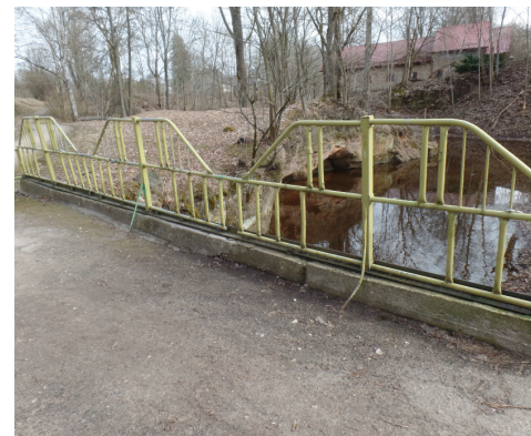
Tilta metāla marga ar dzeltenu krāsojumu