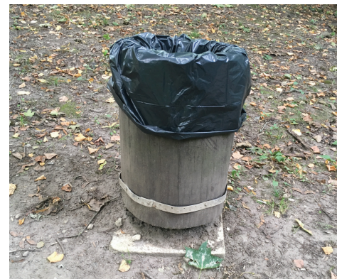
Koka atkritumu urna parkā