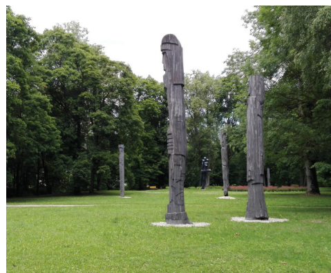
Koka skulptūras eposa "Lāčplēsis" varoņu atveidā