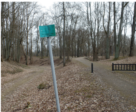
Norāde par suņu pastaigu vietu