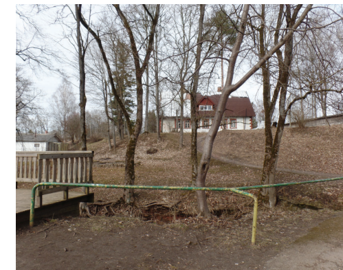
Metāla norobežojošs elements pie Rumbiņas ūdenskrituma