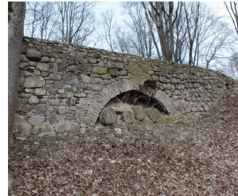
Akmens tilts, saglabājies no muižas laikiem (19., 20.gs)