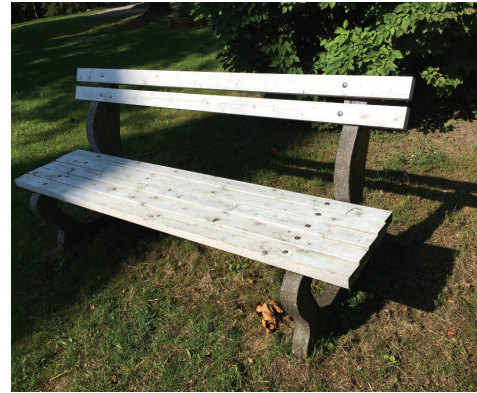
Koka soli Skulptūru dārzā