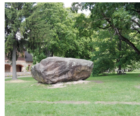
Dīžakmens "Lāčplēša gulta"