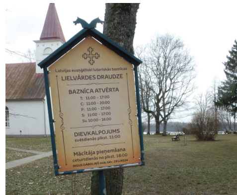
Lielvārdes luteriskās baznīcas informatīvais stends