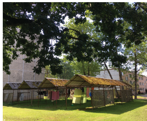
Nojumes veļas žāvēšanai dzīvojamo ēku pagalmā