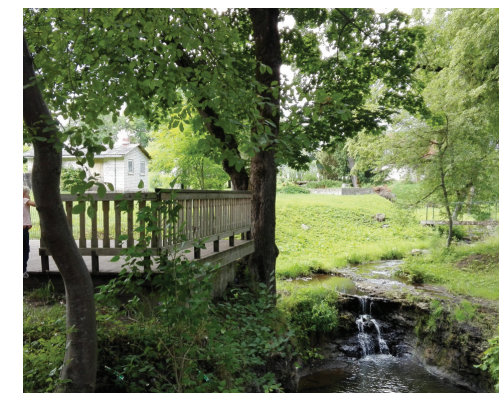
Koka skatu platforma ar koka margu pie Rumbiņas ūdenskrituma