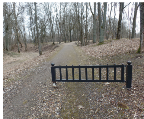
Norobežojoša metāla barjera