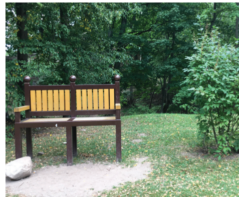
Individuāla dizaina koka soli Skulptūru dārzā