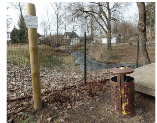
Informācija par Rumbiņas ūdenskritumu