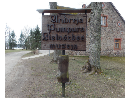
Muzeja nosaukuma zīme