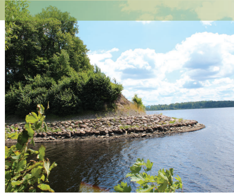
Dievu kalns, liecības par baltu apmetnēm 1.g.t. p.m.ē.