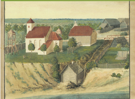
Vēsturiskas liecības par teritorijas un ainavas attīstību