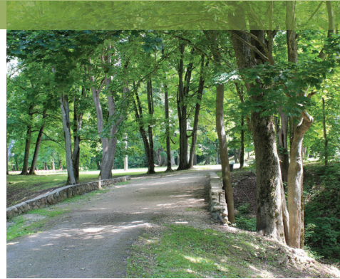
Lieli, veci koki, kas kalpo par mājvietu retu augu un kukaiņu sugām