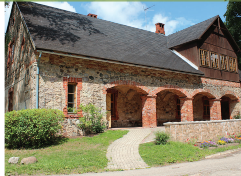
Andreja Pumpura muzejs, bijusī muižas klēts, 19.gs.