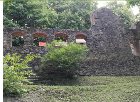
Lielvārdes viduslaiku pilsdrupas