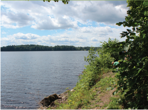
Daugava, Daugavas stāvkrasts ar smilšakmens atsegumiem