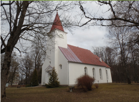
Lielvārdes luterāņu baznīca